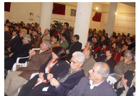
Yekbûyî bawerî pê heye.

Pêvajoya bûyer û guhertinan li avabûna komarê ve heya niha di Îranê û herêmê de ber bi aqarên cuda ve çûne, heke li Îraqa cîranê Îranê desthilata Bees hatiye hilosandin û di vir de xûşk û birayên me yê Kurd bi pişkek ji mafên neteweyî yê xwe di sîstema Federalî de şad bûn û di hikûmetên din yê herêmê de jî weke Turkiyê valahiye ber bi rûyê azadiyan û bi taybetî mafê Kurd hatiye vekirin, di welatê me Îranê de desthilata girûpeke paremayî ku Ol kirine amrazek bo berjewendiyên xwe û navê vê kirine Komara Îslamî a Îranê, cihê rejîma hov a Paşatiyê girtiye û welat ber bi dewranên berê ve zivirandiye, di vê hikûmetê de ku berevajî navê wê ne komarî ye û ne jî pêwendî bi xelkê Îranê ve heye, tu behsek bi navê azadî, demokrasi û mafê neteweyî di holê de nine. Ew ne tenê tu mafekê bo xelkê Îranê bi heq nizanin, belkî behsa ji nav birina neteweyek weke Îsraîl li ser rûyê erdê dikin, piştvanîyê ji terorîzmê dikin û dijî aşti û hêmdariyê di herêmê de ne. Em di vê roja dîrokî de careke din dubare dikin ku gelê Kurd li Kurdistanê Îranê û partiya avaker ya Komara Kurdistanê di eniya dijî terortê de ne, aligirî aşti û bi hev re jiyana serdem tevî cîranên xwe û pabend bi hemû buhayên mirovî ne ku Rêxistina Neteweyên