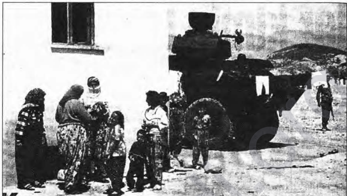
Piştî êrişa gerîla, tîmên taybet li ser gel teroreke mezin pîk anîne.

Li gorî çavderiyên heyetê rewşa gel pir xerab e. Li gorî agahiyan ku gel dane ev sal û nîvek e ku am-