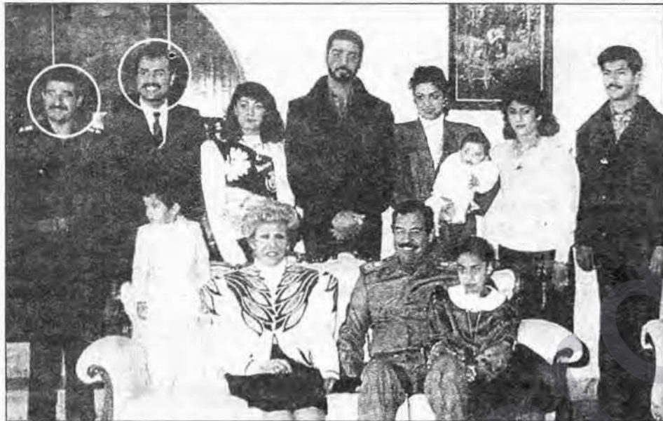
Amerîka ji bo ku cihê Sadam tijî bike, li dîktatorekî nû digere.

liyê dinê jî bi her îmanên xwe li gel dewleta Tirkîyeyê û li dijî gelê kurd li Bakur derdikeve. Holbrook bi xwe li hemû dewletên Ewrûpayê geriya da ku ev dewlet zêdetir alîkariya Tirkîyeyê bikin. Holbrookê li Bakur jî ji bo qirkirna gelê kurd bê deng dimîne û dipejirîne û Başûr mirîna kurdan "naxwaze". Ma ev mirovahî ye? Bêguman dewleta Amerîkayê her dem konevaniyeke berjewendî ji bo interesa xwe meşandiye. Lewre jî ku îro dewleta Amerîkayê şer-rawestîna di navbera PDK û YNK'ê de dixwaze, ne ji bo kurdan e. Hesan Al-Majid û malbata xwe bi xwe mirovê Sadam in û bi her cureyî qirkirin li dijî gelê kurd û ereb meşandine. Hem Sadam û hem Hasan Al-Majid wekî hev in û bi her awayî li hemberî mirovatiyê tawandar in. Lê dewleta Amerîkayê, CIA, bi xwe bi Hesan Al-Majid re ne û ew dixwazin wî li dijî Sadam bikin serokê muhalefetê. Di nav vê muhalefetê de kurd jî wê cihên xwe bigirin. Li gorî hin pisporên Amerîkayê dewletên Ewrûpayê bi taybetî Almanya, Fransa û Rusya politikayên Amerîka napejirînin û li