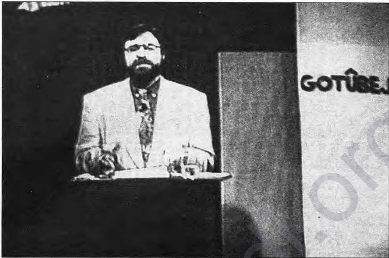
Spîkerê programa Gotûbêjê ya MED TV tê xuyan.

Du: "MED TV" Zimanekî ku jê nayê têgihîştin bi kar tîne. Ji weşana xwe ya testê heta îro qet pêşveçûneke berbiçav tê de çênebû ye. Hinek pêşveçûn hene lê ev jî vê rastiyê ji holê ranakin. Hinek bi zimanê gundê xwe dipeyivin. Yên ku bi zimanê gundê xwe nizanin, an jî li bikaranîna zimanekî edebî dixebitin, ji yên pêşîn jî zêdetir çewtî û xeletiyên dîkin. Yek ji wan bi aqsanekî erebî ji peyv bi peyv wergera tirkî dixwîne. Di