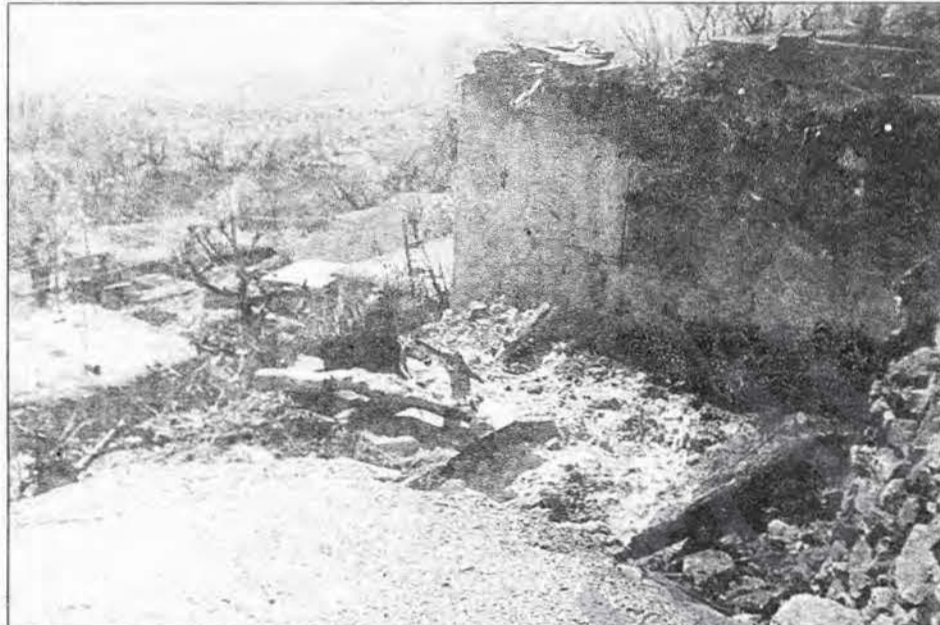
Bi hezaran gundên wekî Serdê hene li Kurdistanê.

rîndar dibin. Piştî vê leşker diavêjin ser malan û 5 gundî li ser îdiaya ku "bi gerilayan re alîkari kirine" tîn girtin.