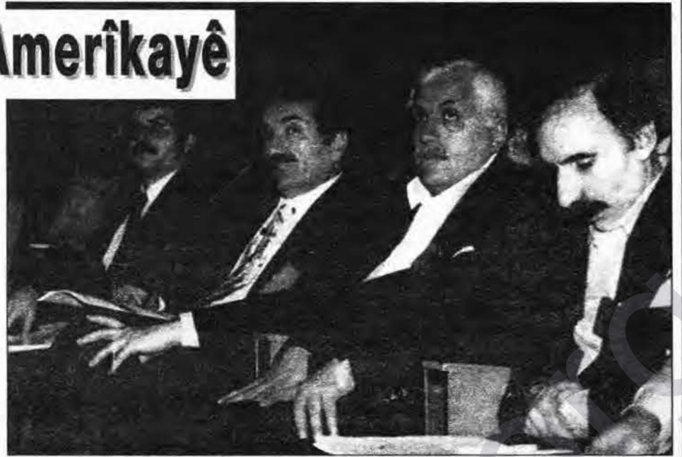
Hinek Endamên Kongreya Amerîkayê ji Clinton dixwazin ku ew PKDW'ê nas bike û ji bo çareserkirina pîrsa kurdî xebatê bike.