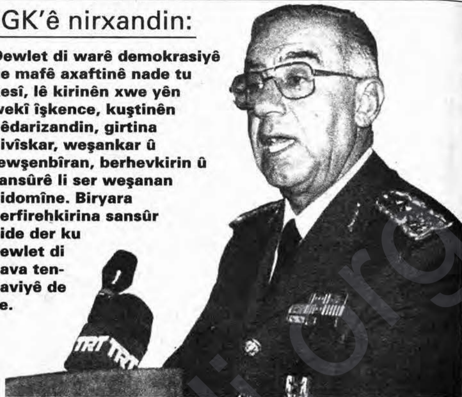
Serleşkerê Artêşa Tirk Org. İ. Hakkı Karadayı

Dewlet di warê demokrasiyê de mafê axaftinê nade tu kesî, lê kirinên xwe yê wekî îşkence, kuştinên bêdarizandin, girtina nivîskar, weşankar û rewşenbîran, berhevkerin û sansûrê li ser weşanan didomîne. Biryara berfirehkirina sansûrê dide der ku dewlet di nava tengaviyê de ye.