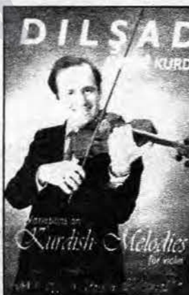
Kapaxa "Awazê kurdî"

Jêrenot: Ji bo ku bersiva we bê nixandî, divê hûn "Peyva Veşarî" di nava qutiyên li bin xaçepirsê de binivîsin û tevî adresa xwe ji me re bişînin.