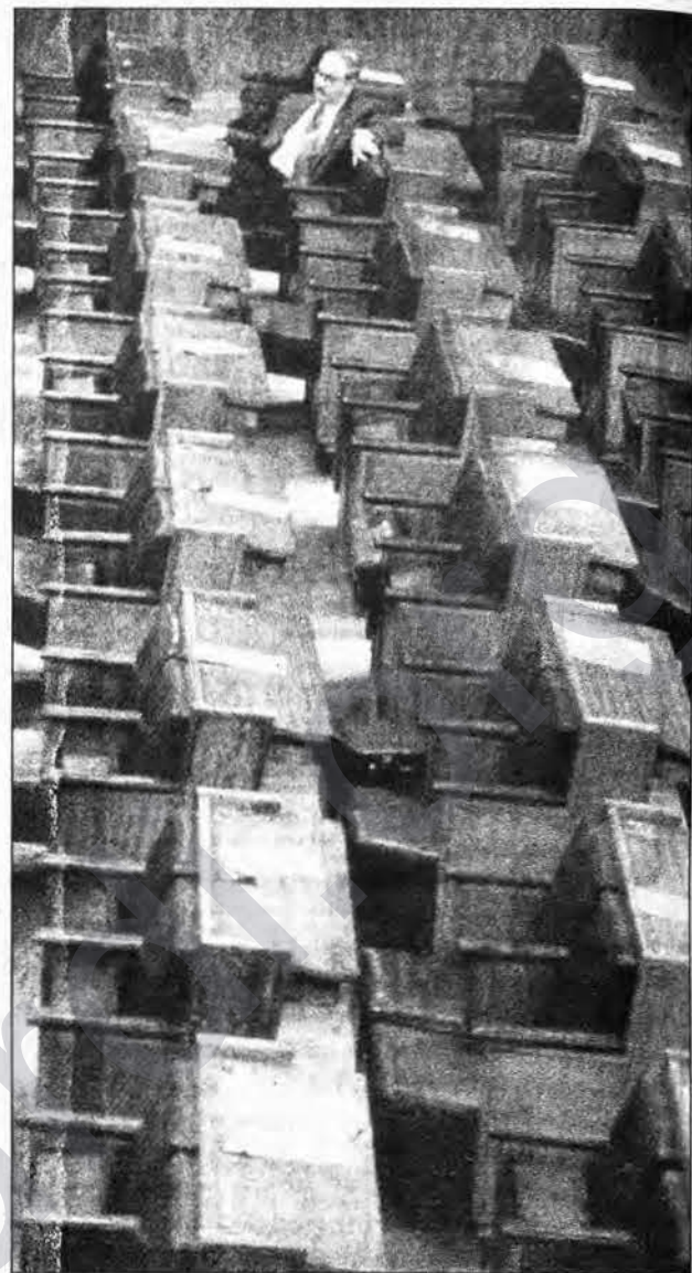
Heta guherîn çêbû, bêhna mebûsan çikiya.

Navê 5 kesên ku di xaçepirsa hejmara 36'an de peyva veşarî 'Banemêr' dîtine û kaseta "Deniz Koydum Adını" ya Metin-Kemal Kahraman qezenc kirine: