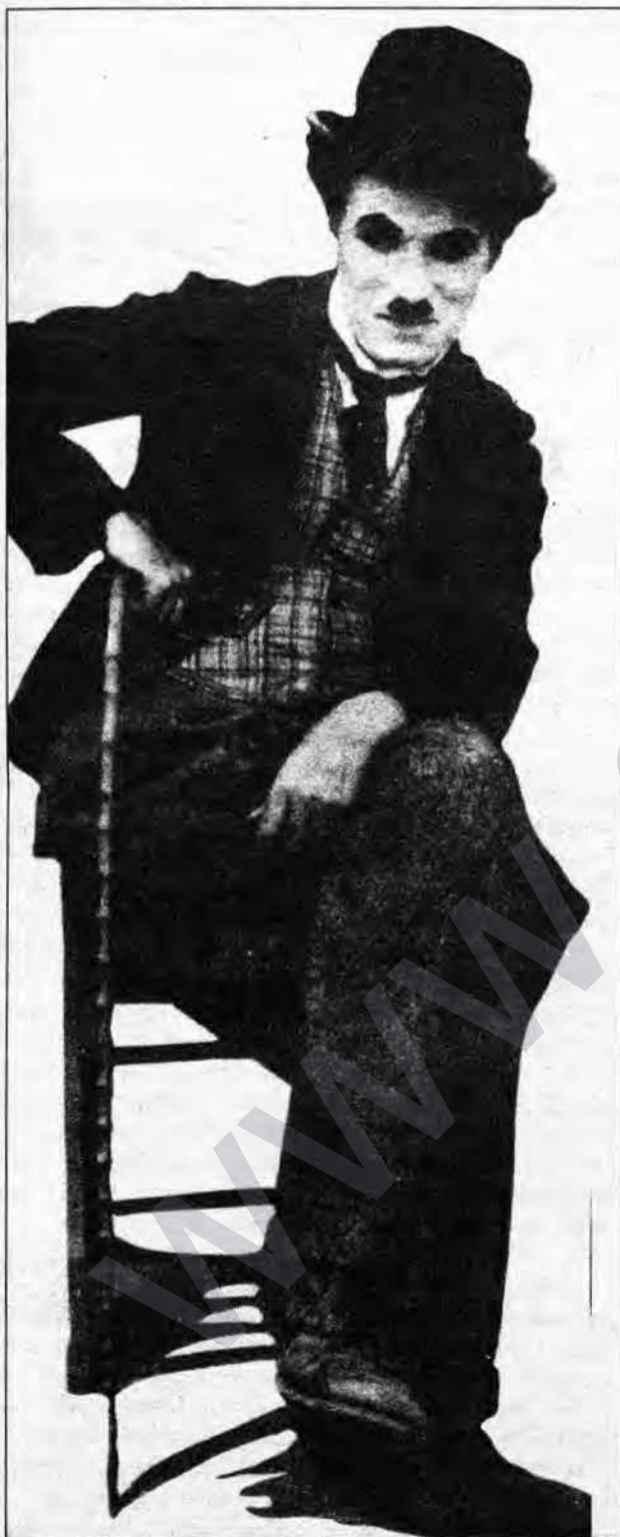
Hostayê sînemaya bêdeng Charli Chaplin