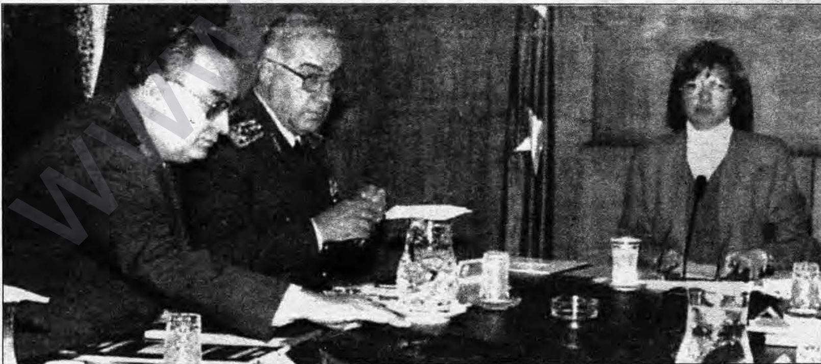
Wezîfeya MGK'ê 'tawsiyekirin' ya hikûmetê bicihanîna wê ye.