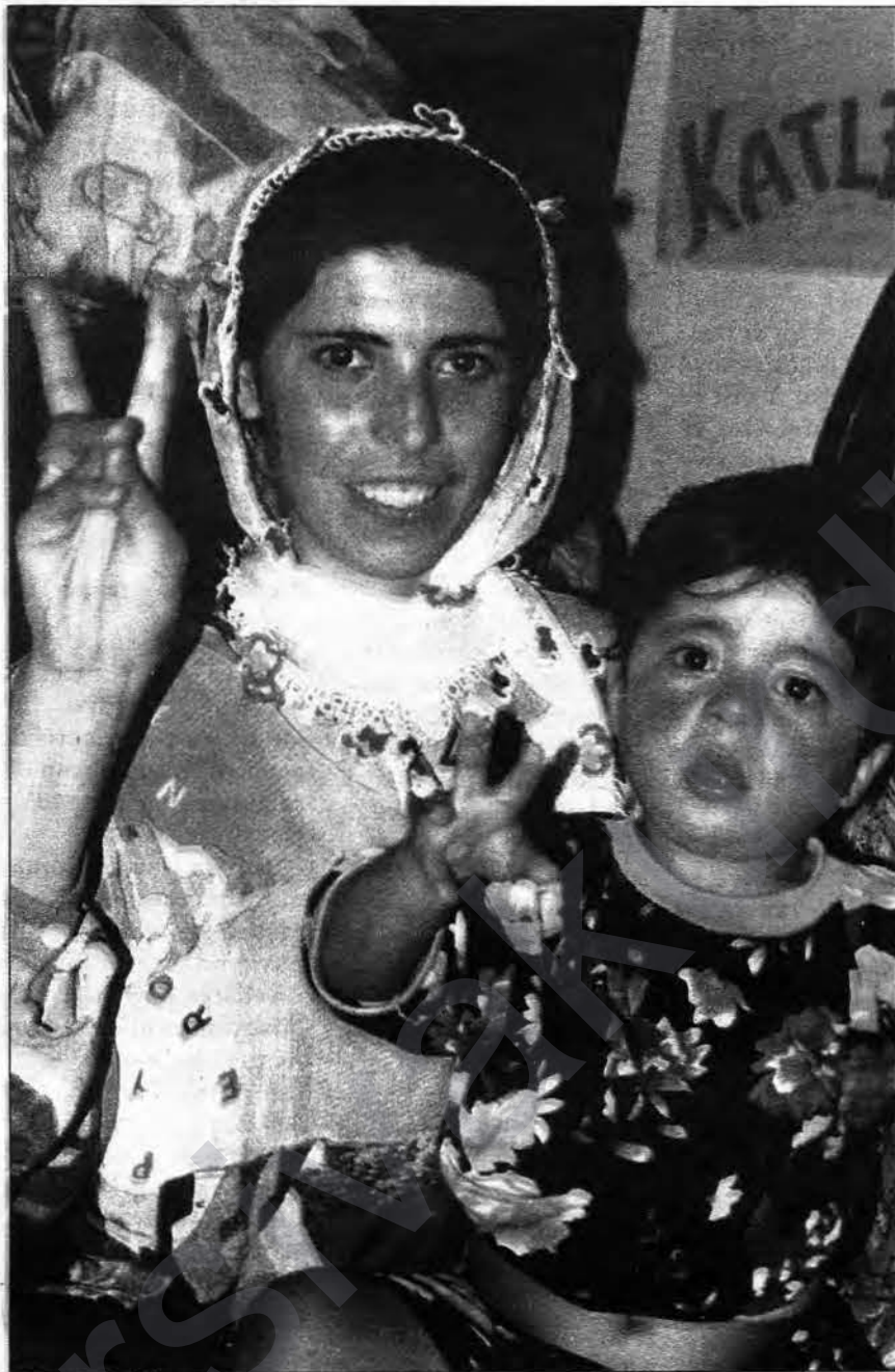
Zarokên nûhati jî bi malbatên xwe re dikevin livbaziyan û hînî nişana serkeftinê dibin.