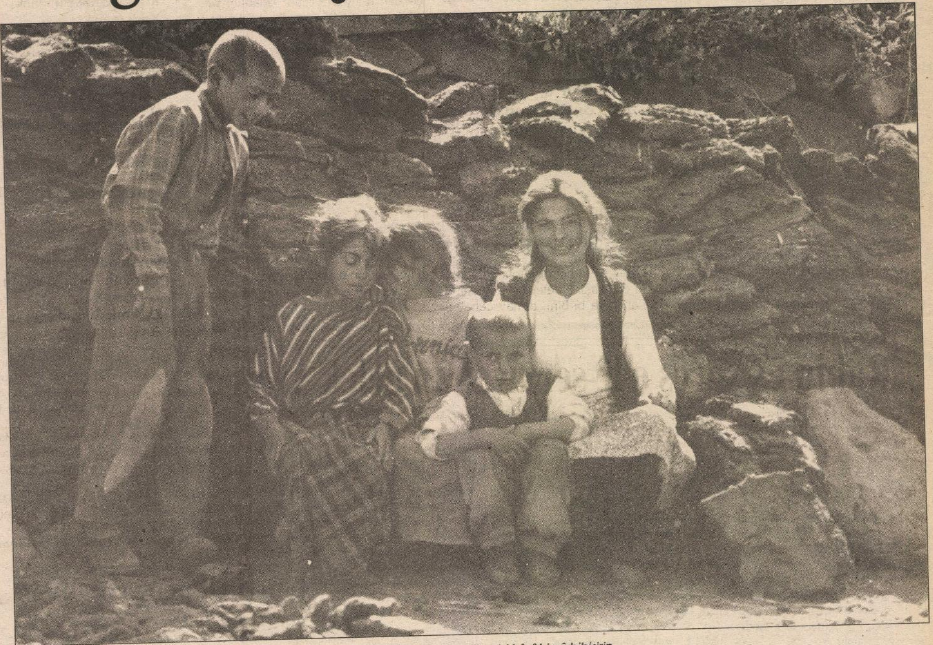
Bibişirin zarokno, hûn li ku û di çi rewşî de bin bibişirin. Jiyanêke nû û azad ava dibe, bi hevî bin û bibişirin.