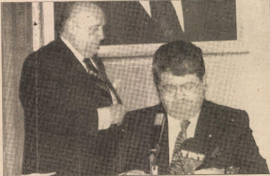
Turgut Özal Serokkomarê Tirkiyê yê 8. bû. Özal (li aliyê rastê) û Süleyman Demirel bi hev re.

Di dirûka Tirkiyê de, di nav rêveberên dewletê de, yên ku zêde li ser kirin û çespinên wan gengeşî û peyvîn tînin kirin yek jê jî Turgut Özal bi xwe bû. Özal di dema xwe de, di warê aboriya liberal de tiştên mezin kir û aboriya Tirkiyê bi aboriya dewletên kapîtalîst ve entegre kir. Her wisa di 13 salên dawî de Özal, ne bi tenê di warê aboriya liberal de, di qada siyasetê de jî guherînên