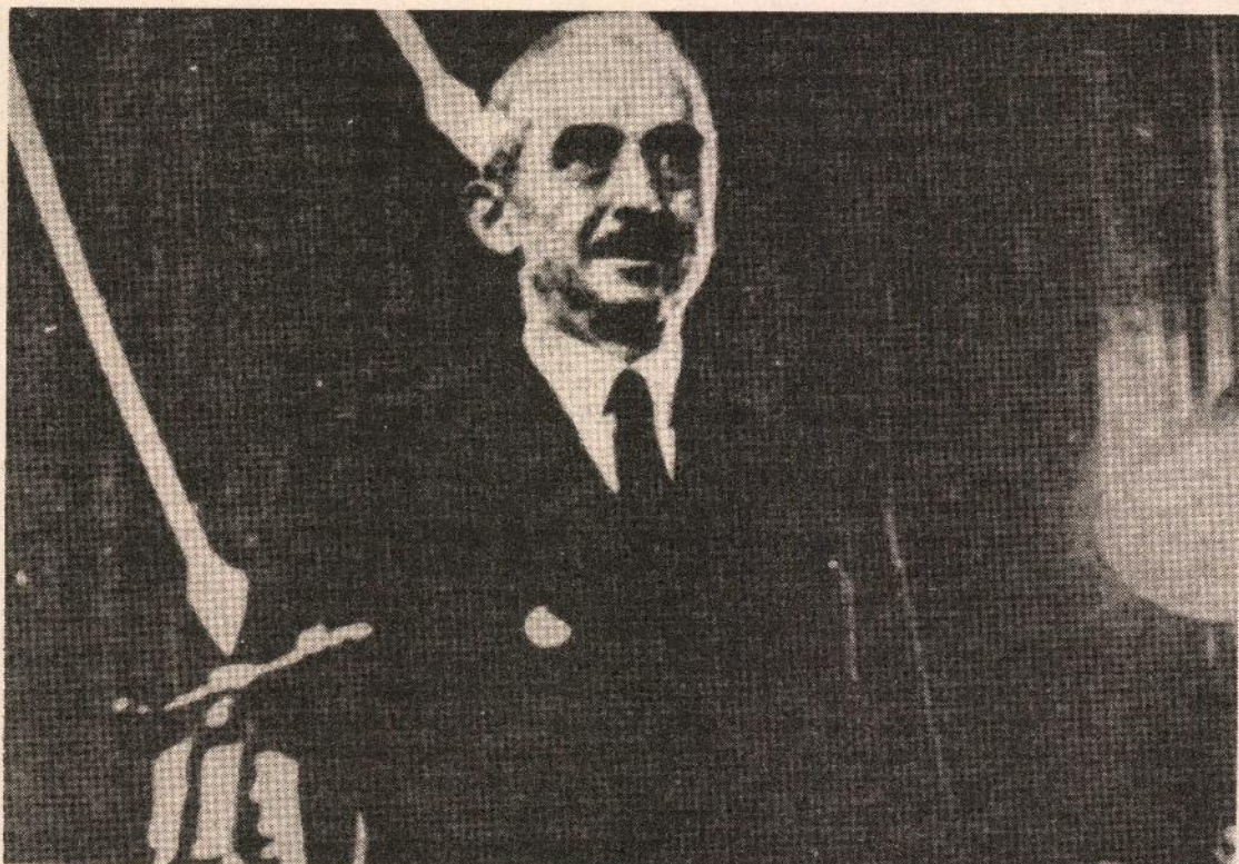
Li Lozanê serokê heyeta Tirk İsmet İnönü (İsmetê kem) bû.