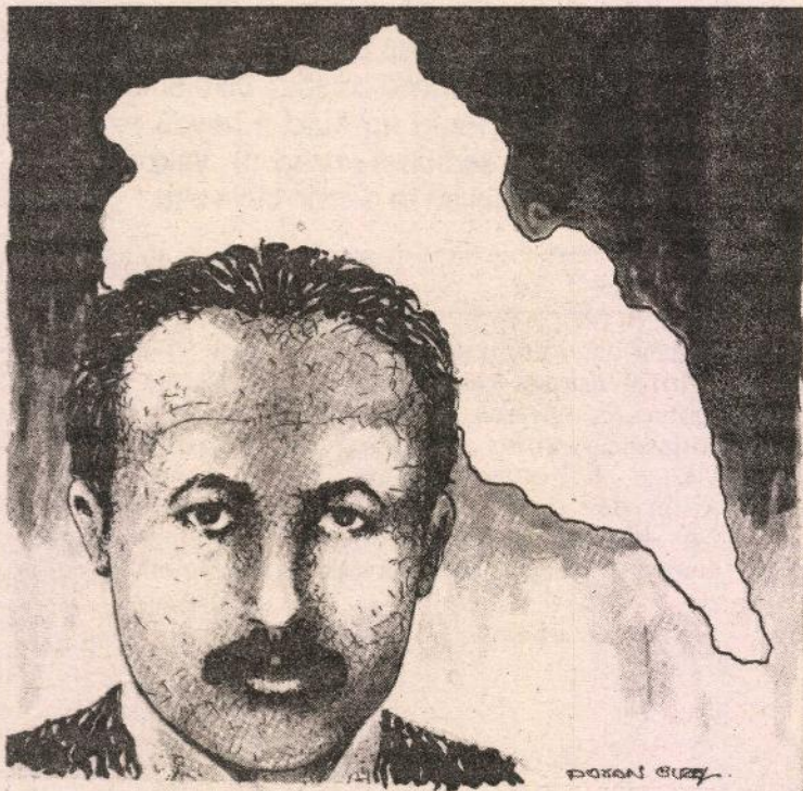
Di îdianamê de erdnîgarek (coğrafya) tesbît kirine. Ev erdnîgar, çiqas bê înkarkirin ji Kurdistan e. Lewra di vê dadgehê de yek (1) Tirkek tenê heye, ew jî, ji Sêwazê ye. Yê din hemû ji bajar, navçe û gundên Kurdistanê ne. Bi vî awayî jî, tixûbek hatiye tesbît kirin.

Dozgerê vê daweyê, dema ku îdianameya xwe amade dikir, nizanibû ku wê belgeyek girîng û dîrokî ji Kurdistanê