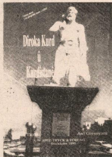
Pirtûka dersê: Dîroka Kurd û Kurdistanê

Ev çanda nû, li ser çanda kevin şîn dibe. Lê gelek tiştên çanda kevin, wek pelê daran-hildiweşin.