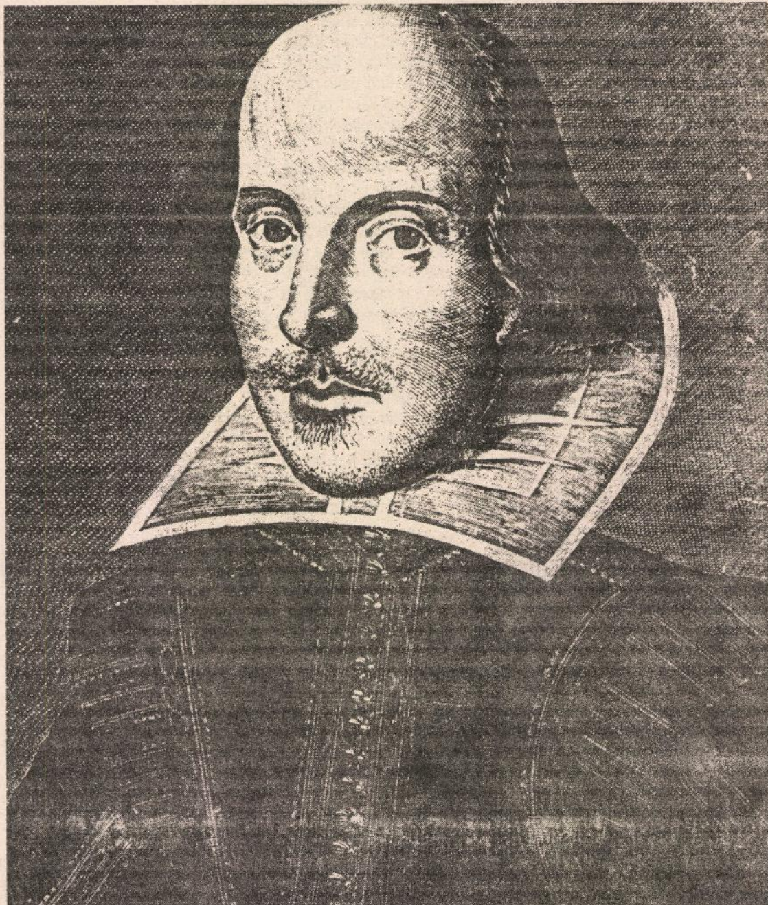
Shakespeare û imzeya wî

Shakespeare di sala 1664 an de li Londra mir, lê gengeşî û munaqesên li ser nivîskariya Shakespeare îro jî dom dikin.