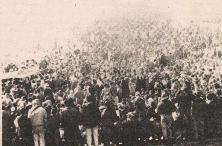
Wê ev herdu meş di cohefî de bigihin hev û wek çamekî gurr ve rejîma faşîst bînin ber pêlên xwe û belav bikin.

Li gor dîtina min beriya ku em bêjin Kurd û Tirk bira ne, Kurd û Ereba bira ne an Kurd û