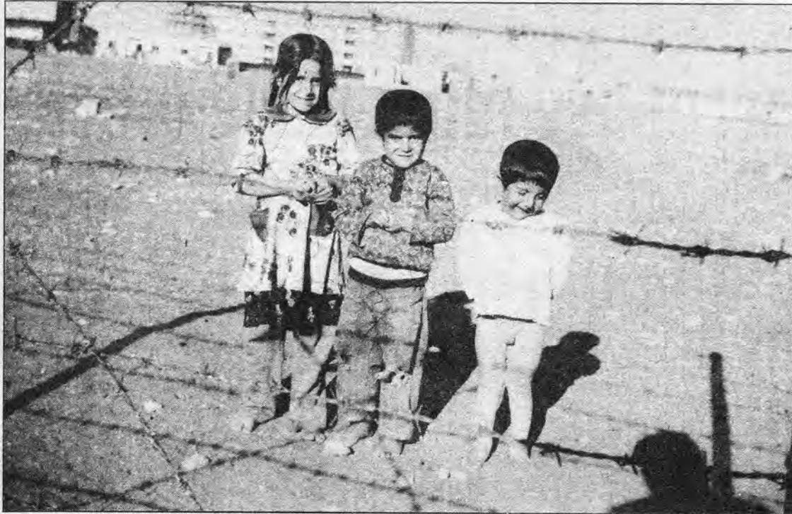
Kurd êdî di şûna navên Tirkî, Erebi û Farisî de yên Kurdî li zarokên xwe datînin.