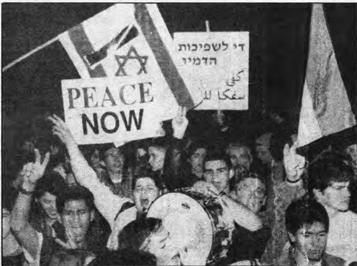
Çepgirên Îsraîlî li dij qetlîama El-Xelîlê xwepêşandanên protestoyê li dar xistin.

■ Aştîya di navbera RRF'ê û Îsraîlê de bi kampanyayên mezin pêşkêşî raya giştî ya cihanê bû. Pêkhatina vê peymanê wek serketina "Pergala Nû ya Dinyayê" hate binavkirin. Lê niha ev plana aştîyê jî wek "Pergala Nû ya Dinyayê" zû kete xetereyê.