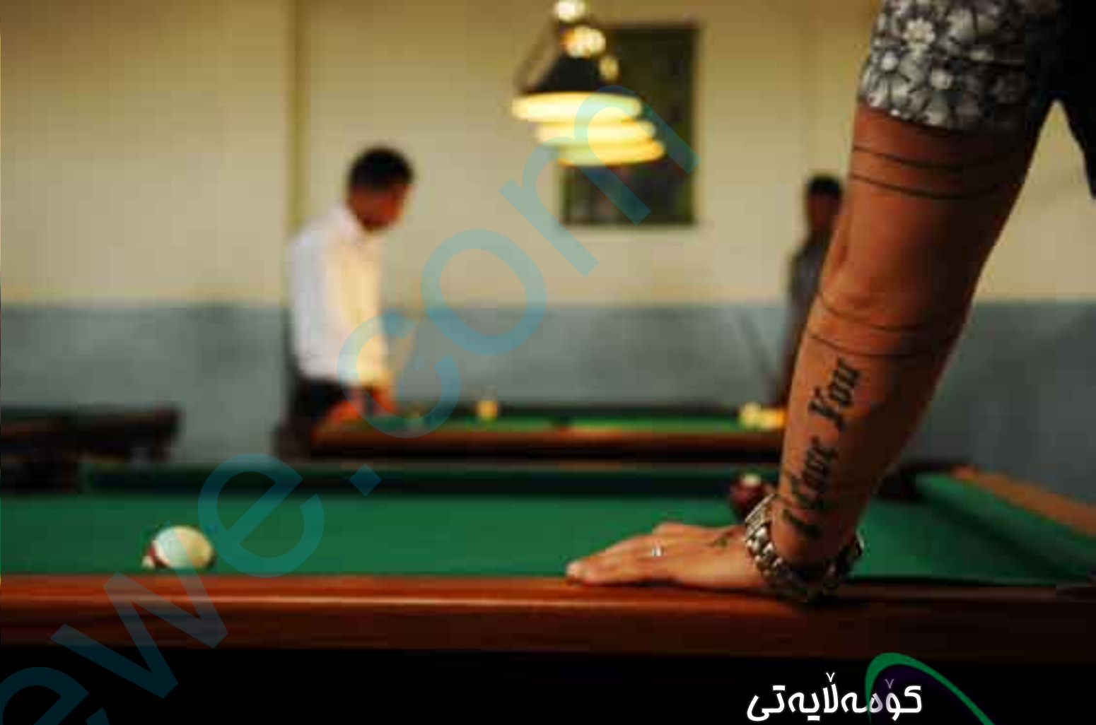
كوردستان - زاخۆ ۲۰۱۰ گولە لە یاری بیلاردو