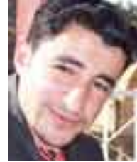
به ره فان نه حمه د

پاش نه وهى سزا كه ي گولى، ته واو ده بيت، حكوومه تى نئوريۆر بسپارده دات كه خۆى له سه رنيشه ي گولى رزگار بكات. بويه له كؤتابى ۲۰۰۹ دا بپارده دات كه بؤ هه ريمى كوردستانى بگه رپتته وه. به لام بپاره كه له به روارى ۲۰۱۰/۵/۵ رۆزى كرا. رۆزى ۲۰۱۰/۵/۵ حكوومه تى نئوريۆرى له ريگه ي فرؤكه خانه ي تۆسلؤوه و به ها ورپييه تى ۵ پؤليس به مه به ستي گه رانه وه گولى نارده وه بؤ فرؤكه خانه ي ئوردون. له ويش به هه ما هه نكي له گه ل پؤليسى نيوده و له تى (نه نته رپؤل) رۆزى ۲۰۱۰/۵/۸ گولى، ده نيزنه وه فرؤكه خانه ي هه وليتر. له ويش به پيى نه و هه ما هه نكييه ي كه له نئيوان فرؤكه خانه ي