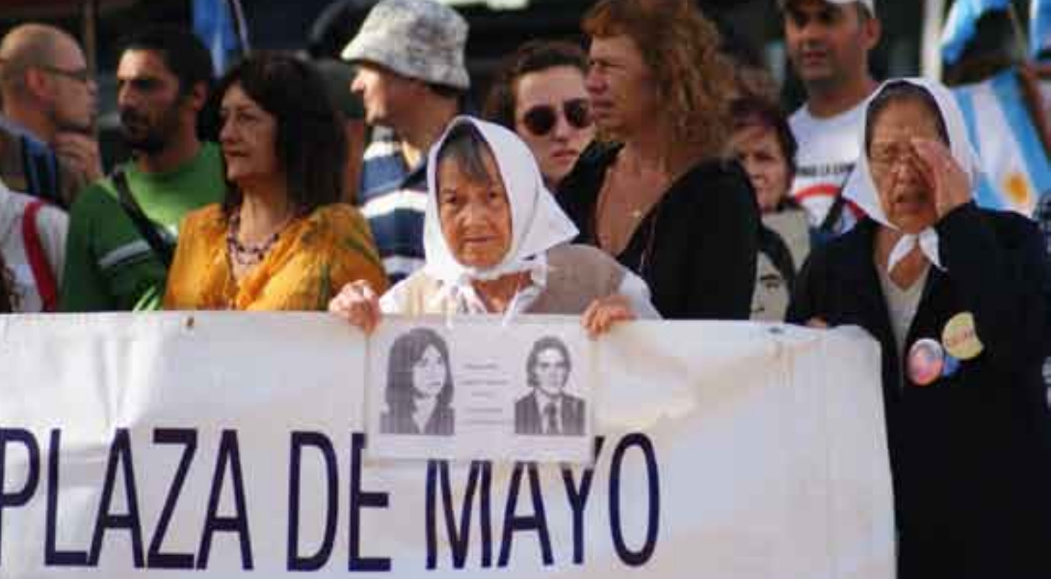
خۆپىشاندانى ژئانى ئەرژەنتىن بۇ سۇراخى مندالەكانيان

داىكانى پلازادۆمايۇ بەھوى بەردەوامبوون و نەبەزىنيان، خەلاتە نۆدەولەتئەبىيەكانى رىكخراوگەلى وەك يونسكو و پەرلەمانى ئوروپايان وەرگرت. ئەگەرچى سى ئەندامى دامەزرىنەرى رىكخراوگەو باقى ئەندامەكانى دىكەش زۆرچاران ھەرەشەيان لىكارو و نوسىنگەكەيان لەبۆينوس ئايرىس داخراو، بەلام ئەو گوشارانە نەبوونەتە كۆسپىك لەبەردەم چالاكئەكانىاندا. ئەوان ھەروا سوورن لەسەر داواكانىان لەپەيوەندى لەگەل كوژرانى كوپەكانىاندا. ئىستا بەتەپپەپىنى ئەو ھەموو سالە يەككە لەگەلەكانى ئەو رىكخراو ھەو ھەيە كە زانكۆيەكى گشتى لە نوسىنگەكانىاندا دابىرئ. مەبەست و ئامانچ لەو زانكۆيە پەروەردەى ئەو گەنجانەيە كە خەرىكى چالاكى سىياسىن. يەككە لەدايكەكان گرتويەتى»دەمانەوئ گەنجان فىرئى ئەو بەكەين كە چۆن ژيان و خەلكيان خۆشبووت و ھاوكات لەگەل خەباتى سىياسىدا بۇ چارەسەركردى كىشەو گرتەكانى خەلكى ھەولبدەن».