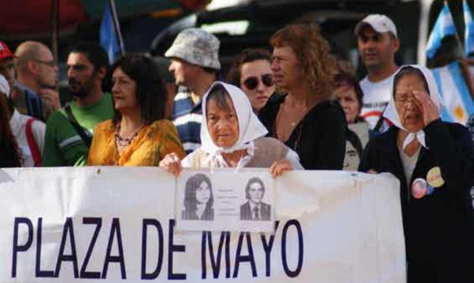
خۆپىشاندانى ژئانى ئەرژەنتىن بۇ سۇراخى مندالەكانيان

و گرنىگىيەكى بە ھەولە نەداو بزووتنەوەكەيان بەھىند وەرئەگرت. بۆيە، سەرەتا ھىچ رىڭكەيەكى لەكۆبوونەوەكەيان نەگرت. بەلام وردەوردە كە دەريان پىر بوو، ھەستى بەمەترسى كرد.