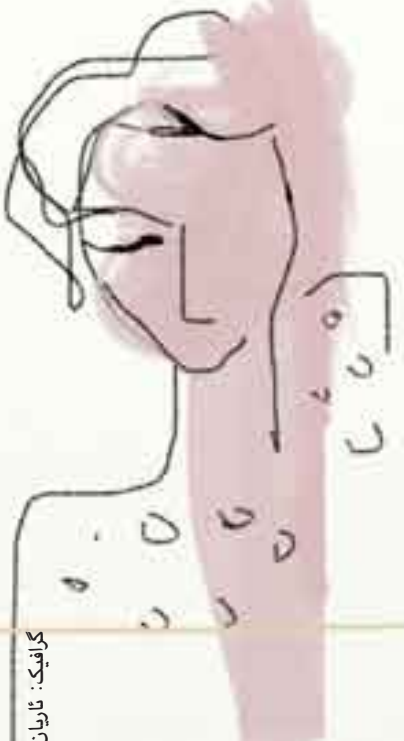
گراښك: تاريان ښهوبهگر