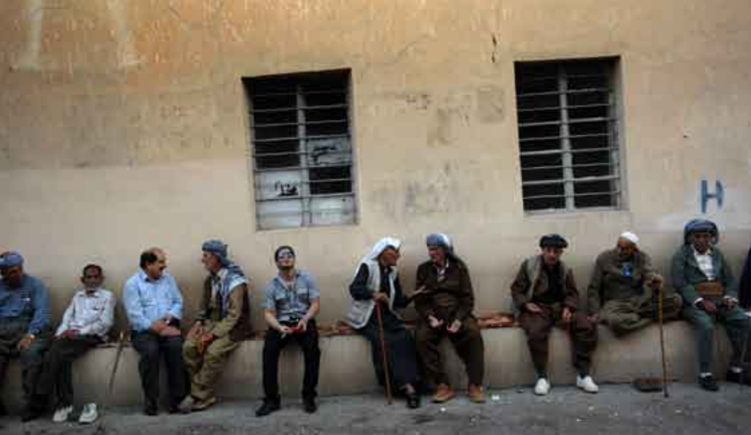
كوردستان - زاخۆ - ۲۰۱۰ گولي له نئو چاپخانه يهك

هه موويان هى خۆى نه بوون، به لكو هه ندىكياتى له قاچچيه كانى ديكه وه رده گرت. سنوورى بوونى شارى زاخۆ وايركردوه كه زۆر كه سىتر له شپوهيه گولى هه بن، به لام ته مهنى گولى نه وه ده رده خات كه حاله تىكى ده گه مهنه.