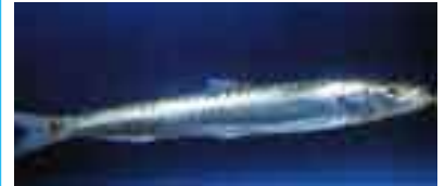
۲۹ - تیره ماسی (رهنگه)

کالسیۆم +Ca، مهگنسیۆم MG، ههروهها سههرچاوهیهکی گرنگی ترشه چهورییه بنه رهتیهیهکانه ESSENTIAL AMINO FATS، بهتاییهت (ئۆمیگا سێ).