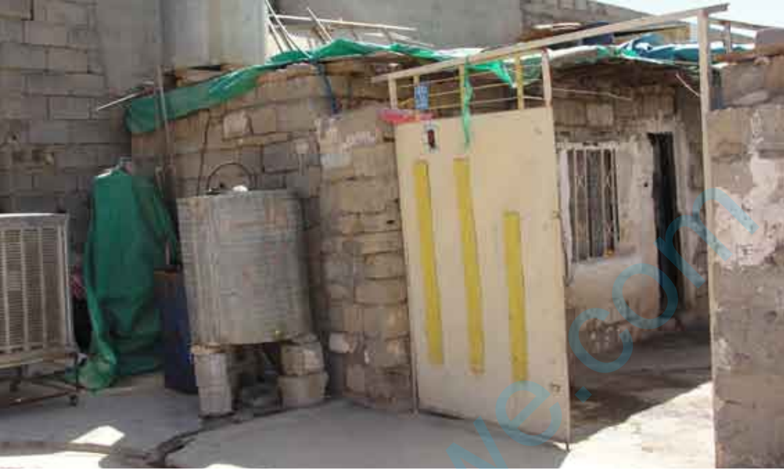
كوردستان هەولێر - ۲۰۱۰ . مالى كەوسەر

تەمەن لەقوناغىك بۆ قوناغىكىتر زۆركات كيشە بۆ تاكەكان دروست دەكات ((بەھۆى گۆرانكارى ھۆرمۆنەكانى جەستە و مېشكى كەسەكە، بەتايبەت گۆرانكارىيە ھۆرمۆنىيەكان لەكچ جياوازترە و زووتر دەردەكەوێت. ھەرەھا بەھۆى ھەلچونى لەناكاو، زۆركات كەسەكە والیدەكات نەتوانن بەناسانى خۆى كۆنترۆل بكات)). بەگوتەى داىك و باوكى كەوسەر، كچەكەيان لەمنداڵىيە كەسىكى توورە بوو. زۆركات بەھۆىيە كەلوپەلى نىزىكى خۆى شكاندوو. پىسپۆرەكەى بوارى دەروونى منداڵانىش، باس لەو دەكات توورەبوون پىويستى بەبەدواداچوون و لىكۆلینەو ھەيە، نابێت توورەبوون و ھەلچونى منداڵ پىشنگۆيخريت. باوكى كەوسەر، دەلى، كچەكەيان كاتىكى زۆرى بەسەيرکردنى تىقىيەو، بەسەر بردوو ((زۆركات تا اسى شەو سەيرى تىقى دەكرد)). د.ن.شمىل، ئاشكرای دەكات دراما و فىلمەكانى تەلەفزیون زیاتر كاریگەرى بەسەر كۆرپانەو ھەيە لەكردارە توندوتیژیەكان زیاتر كۆرپان لاسایى دراماكان دەكەنەو، بەلام بۆ كچان درامای سۆزدارى و خۆشەويستى، كاریگەرتن. وەك باسى دەكات كە زۆر حالەتى خۆكۆشتن بەكاریگەرى ئەو درامایانە روویداو.