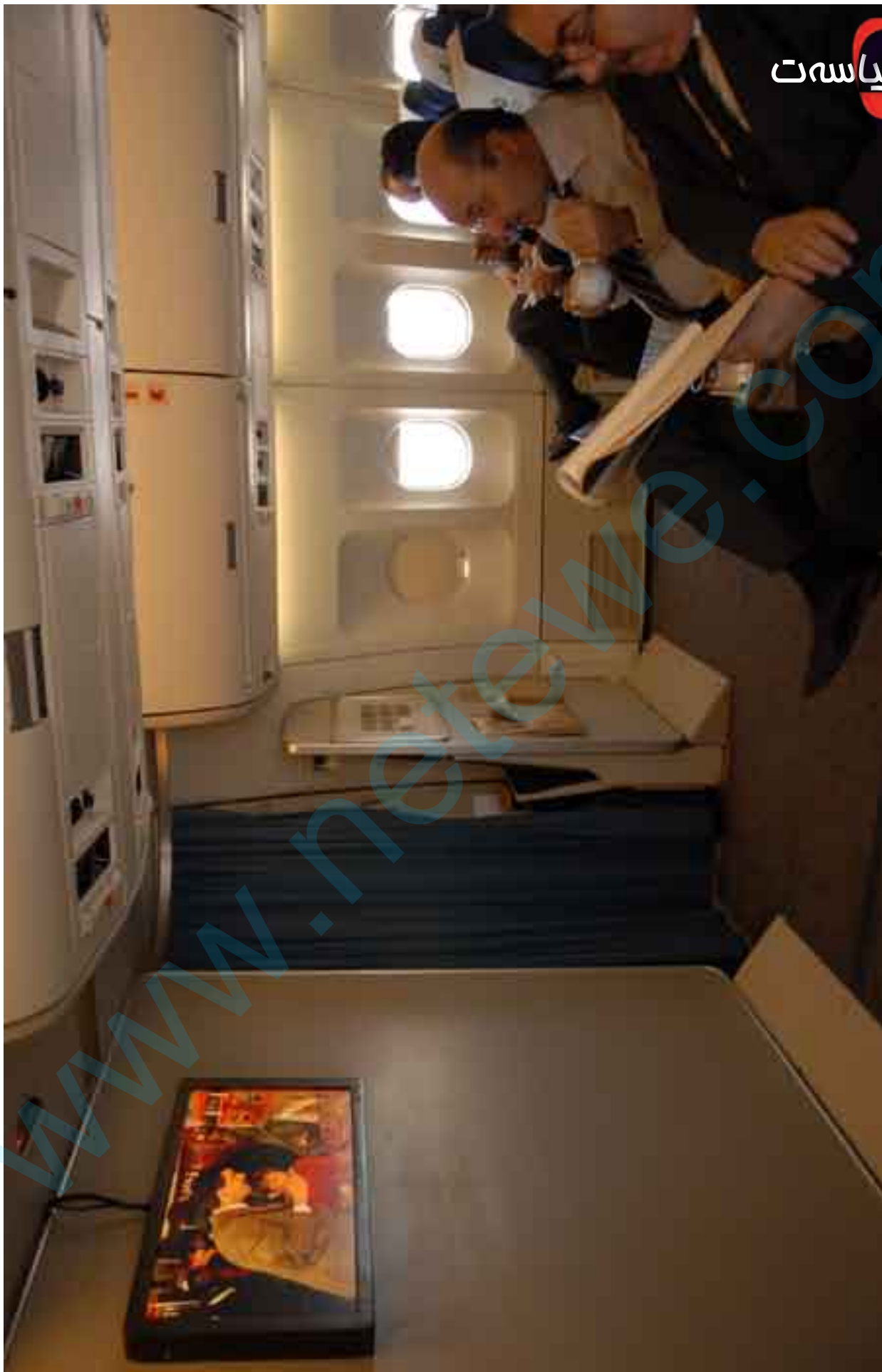
ناسمانی په‌غدا - ۲۰۰۸ . ستانی حکومه‌ت‌تکه‌کی مالکی سه‌پری فیلمی میسته‌ر بین ده‌گه‌ن