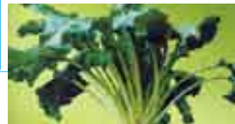
۳۱ - چهوه ندهر

فیتامین: C، ترشی فۆلیک (Folic Acid)، کالسیۆم +Ca، ئاسن Fe، مهگنسیۆم Mg، مهنگه نيز Mn، فسفۆر S، پۆتاسیۆم K