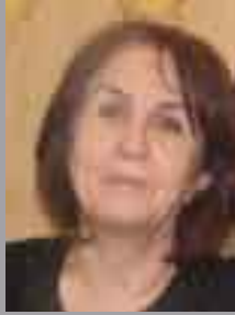
نازەنن فایهق فەرەج

وادەى مندالبون برىتتیهله، نازارى يەك لەدواى يەك و كرژبونى مندالان، لەگەل فراوانبونى مى مندالان كە بەهاتنەخوارەوى بەشە ديارەكەى كۆرپە دەست پىدەكات. يەكئەك لەگرنگترين و ترسناكترين ماكى مندالبون ئەو خوئىنبەرپونەيه كە لەماوەى نىوان لەدايكبونى كۆرپە و هاتنەدەرەوى وئالاش، روودەدات كە تاكاتمىرى يەكەمى دواى هاتنەدەرەوى وئالاش، بەردەوامدەبىت. بۆ ئەو حالەتەش دەكرئى هانا بۆ ئۆكسىتۆسىن بىردىت.