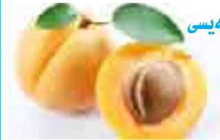
۲۸ - بهری قهیسی

فیتامین: C، کالسیۆم +Ca، مهگنسیۆم MG، پۆتاسیۆم K، ئاسن Fe، بۆرۆن Bo، ترشی فۆلیک (FOLIC ACID)، بیتاکارۆتین.