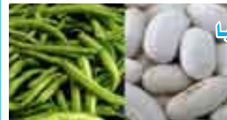
۲۰ - فاسۆلیا

ترشی فۆلیک (FOLIC ACID)، کالسیۆم +Ca، مهگنسیۆم MG، فسفۆر S، پۆتاسیۆم K، پڕۆتینی رووهکی.