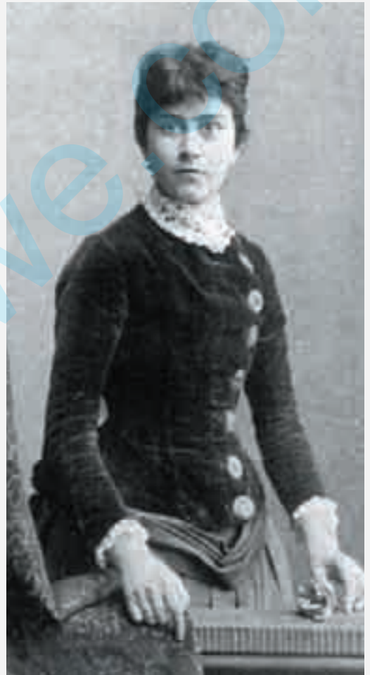
ئیلزه لاسکه شویله‌ر له تافی لای دا

سالی ١٩٢٨ مافی هاوولاتی بوونی ئەلمانی لئ دەست‌دراوه‌وه. سالی ١٩٣٩ له سوپسراوه به‌ره‌وه فه‌له‌ستین ده‌جیت. پاش ئەوه‌ی ناتوانی بگه‌ریته‌وه سوپسرا، سالی ١٩٤٤ به‌ سه‌ختی تووشی نه‌خۆشی ده‌بییت و له ١، ٢٢، له شاری ئۆرشه‌لیم (ئیسرائیل) ده‌مریت. ئەده‌بیاتی ئیلزه لاسکه شویله‌ر شوینی تایبه‌تی خۆی هه‌س له ناو سه‌رجه‌م ئەده‌بیاتی ئەلمانی دا.