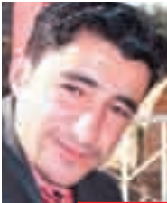
به رمان عه محمد

له وباره يه وه قايمقامي زاخو حسين خالد، راگه ياند "له گه ل نه و وداين که نه و بنکي به له زاخو بکړيته وه و بودجه و نيمکانياتيشي بو دابن بکړيت". به يار بافني، جهختي له سه رکړدنه وه ي به شي تاييه ت له به پښو به رايه تي پوليس، به مه به ستي به دوا داچوون له سه رکيشه کاني ژنان کرده وه.