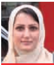
سه ماح سه مه د

"زوربه ي ئافره تان ده كونه ژىر كارىگه رى مودىل و كچه هونه رمانده جوانه كان كه له سه ر شاهشى ته له فزىون ده رده گه ون، ئىتر هه ولده دن شىويه جه سته ي فؤيان هاوشىويه ئه وان لىبكه ن، بويه هانا بؤ نه شته رگه رى ده بن، به بى له به رچا و گرتنى ئه و زيانانى له داها تودا به ره و رووى ده بنه وه"