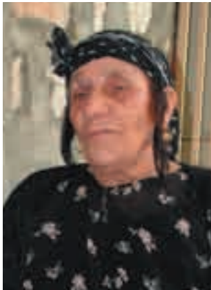
پوره که تی

به رچاوی خه لک په نا بو فالگرتنه وه ده بن. مالی پوره که تی، روژانه شوینی ئه و ژانیه که ده یانه ویت چاره نووسیان له ناو فنجانه قاوه که ی ئه ودا بدوژنه وه. ئه ویش به دم رۆکردنی فنجانه قاوه که ی رووده کاته کچه کان و مژده ی حاسلبوونی مراره کانیاں پیده لیت. پوره که تی، ژنیکی ته من هه شتا ساله و دانیشتویی شارۆچکه ی شه قلاوه یه، به قسه ی خۆی خه لکی له ده وروبه ری شه قلاوه شه وه به مه به سستی قاوه خویندنه وه دین بۆلای، چونکه زۆرجار ئه وقسانه ی به موشته ریه کانی گوتوه " راست" ده رچوو. ئه وده لیت: " زۆرتین موشته ریم هه یه و من له ته منی مندالییه وه قاوه خویندنه وه له پیریژنه کانی که رکوک فیربووم".