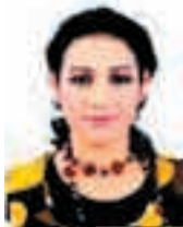
په یمان قهره داغی

نامینه، نه وه ده خاته روو که هندیک له و "قهره جانه" ژیانان باشه گوته ی "زوربه یان نوتمبیلیان هیه، له ژیر خیمه کانیاندا وه ستاندویانه، پوزانه ش به سوال کردن پاره ی باشیان ده ستده که ویت، به لام نه وانه تازه فیتری سوال کردن بوون و هرگیز وازی لینا هیتن". به شیک تر له و "قهره جانه" نیستا شوینی نیشته جیبونان هیه و له گه په که کانی