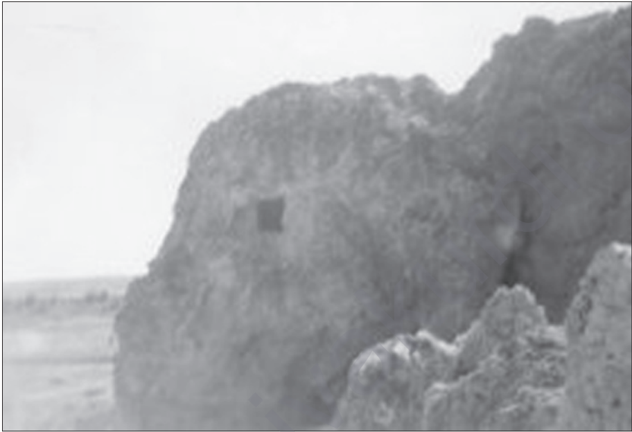
Rijnayîşî ra ver Kerrey Isporî

dest ra yeno çîyo weş virazeno û cayo bîn de zî însan şono rehet-rehet rijnenê.