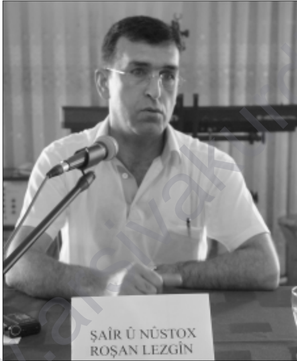
Roşan Lezgîn Çewlîgî de

Program de Roşanî yew şîra xo (Ruho Vîndîbîyaye) zî wende. Peynî de Roşanî da-hîris tene kitabê xo îmza kerdî û wendoxanê xo reyde