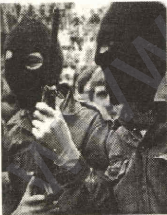
Dilxwazên rîvaxên yê IRA-Mîwexwet di xwepêçanokê de

Vê rêxistinê heta bi 1969an hebûna xwe domand, lê belê êdî wek tevgerê qedîyayî dihat hesabandin. Lê di wan salan de li Bakurê Îrlandê Protestanên piranî li hemberî Katolîkên hindikahî cudakarî û çewisandin dikirin. Vê yekê IRA'ya niv tefîyayî ji nuh de tev rakir, lê li ser awayên bersîvdanê