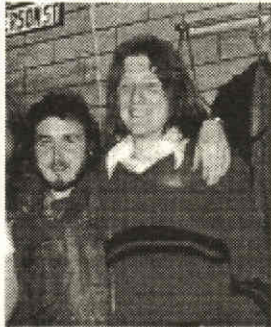
Denis Donaldson (li aliyê çepê) û Bobby Sands di girtîgehê de.

Li Bakurê Îrlandê, hêzên paramîlîter dilsoziya doza xwe ji malbat û hemû tiştên din girîngtir dibînin. Lewra heke yek dev ji dilsoziya xwe ya ji bo gelê xwe berde û bibe sîxur (ajan) an muxbîrê polîs, ev yek wek sûcê herî giran tê dîtin. IRA sîxur û îxbarkar tucari bête ceza nedihîştin. Lê dîsa jî sîxur û muxbîr di makîna îstîxbaratê de çerxeke girîng bû û MI5 (sazîya îstîxbarata Brîtanî) bi şarezabûna xwe ya di warê sîxurtiyê de têra xwe navdar e.