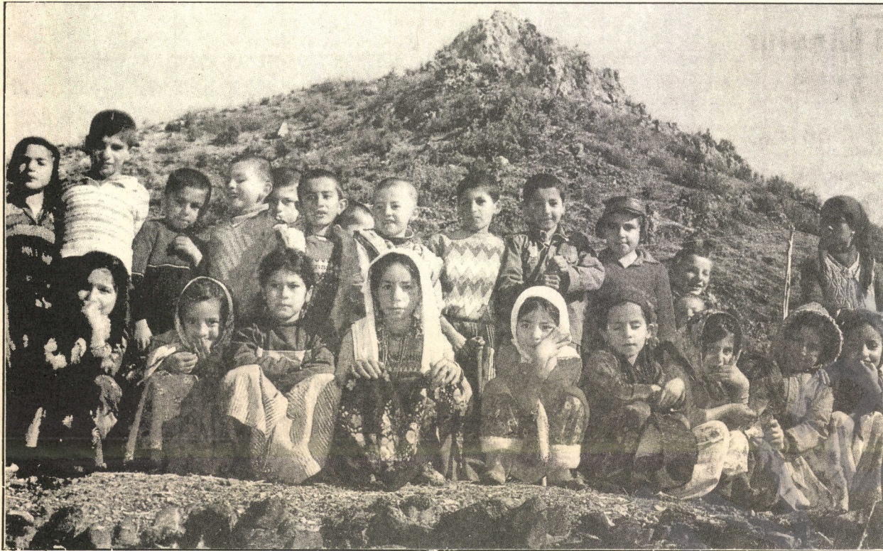
Gelo evana alîgirên dewletê ne an jî "xayîn" in ?

Parastina eşîra, şerê eşîrtiyê şuura netewiyê dikuje, ji çêbûn û geşbûna wê re mecalê nahêle. Dewleta Tirk di siyaseta xwe ye tradîsiyonali de, riko ye. Dîsa bi "destdanîna li ser Kur'anê" û "bi sê kevîran" sêdeqeta eşîran û bikaranîna van li dijî tevgera netewî ya Kurd dixwaze. Parastina dewletê û şerkirîna dijî "veqetinxwaz" û kominîstan cihada ji bo Xwedê ye. Eşîretan bi van û bi efûkirina "mehkûm û qaçaxên"