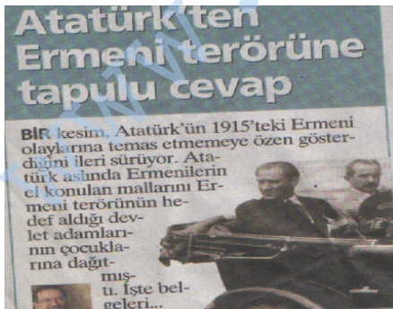
4 Şubat 2007 Sabah gazetesi

Görev; soykırımı savunan egemenlerin egemenliğine devrimle son vermek, onun yerine işçilerin, emekçilerin iktidarını kurmak; "herkese eşit