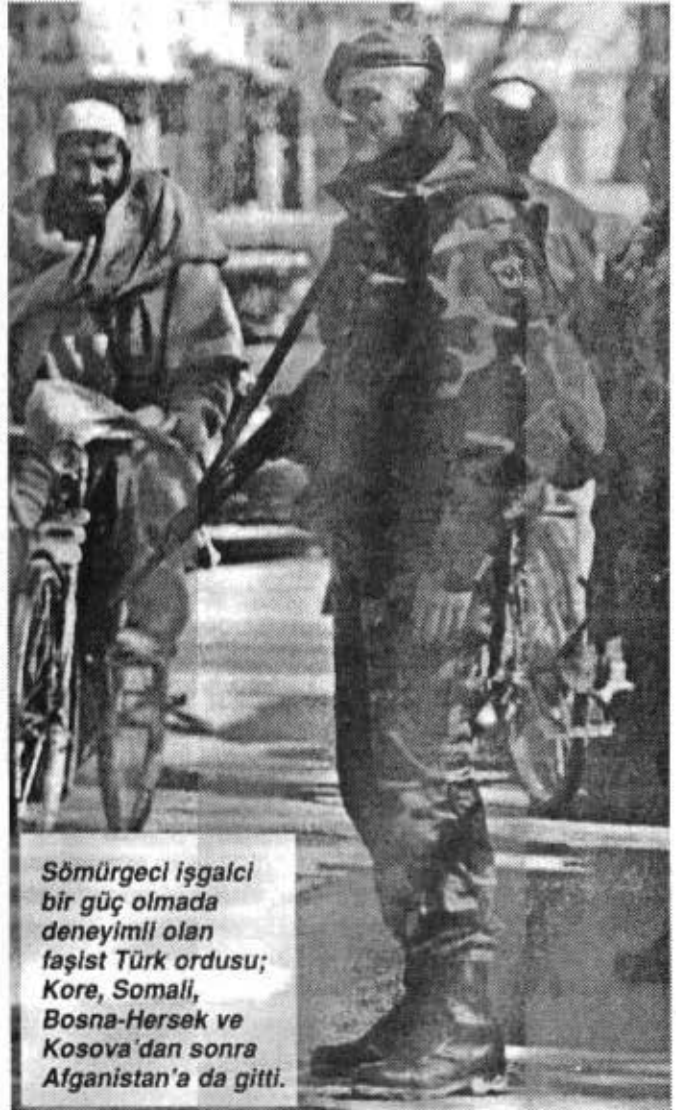
Sömürgeci işgalci bir güç olmada deneyimli olan faşist Türk ordusu; Kore, Somali, Bosna-Hersek ve Kosova'dan sonra Afganistan'a da gitti.

Türk hakim sınıfları kendilerine verilecek böylesi bir role, "Barış Gücü"nü komutasını üstlenmeye hazırdır. Fakat, Türk devletinin içinde bulunduğu ekonomik zorluklar bu görevi üstlenmeyi zorlaştırmaktadır. Türk hakim sınıflarının başta ABD emperyalistleri olmak üzere diğer Avrupalı emperyalist güçlerle pa-