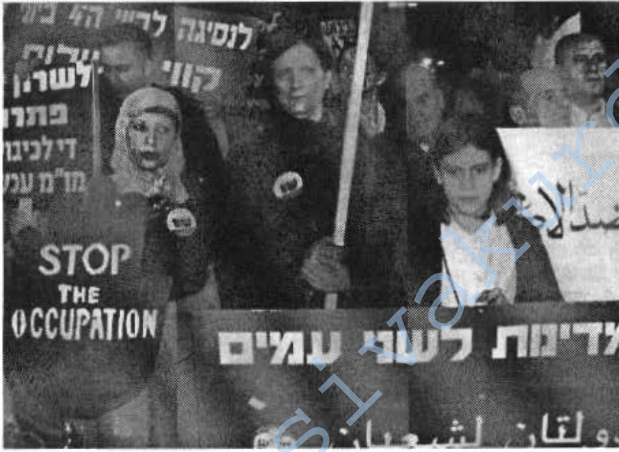
Onbinlerce Yahudi Şaron yönetiminin uygulamalarına karşı protesto eylemleri yaparak barış isteğini haykırdı.

tinin uygulamalarına karşı protesto eylemleri yaparak barış isteğini haykırdı.