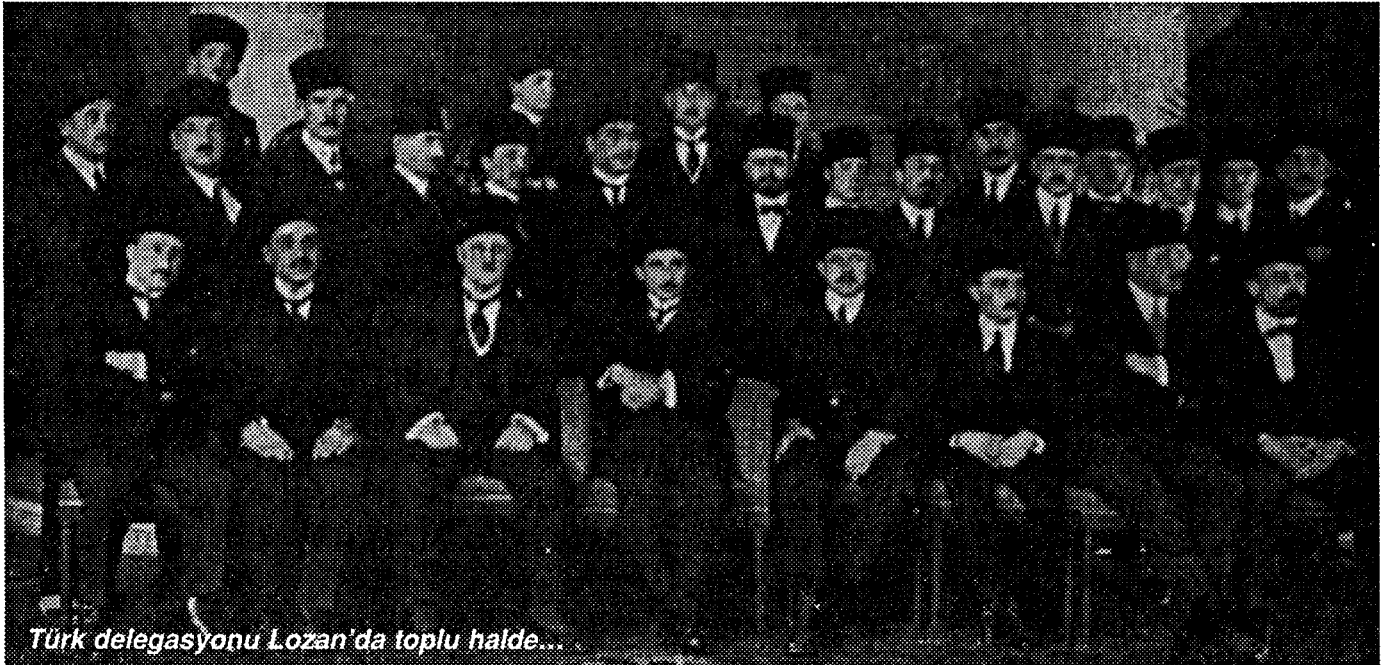
Türk delegasyonu Lozan'da toplu halde...

'Alternatif Lozan' isteminin, hâlâ antlaşmalar yolunun Kürt ulusunun diplomasi masalarında ve Avrupa'nın değişik emperyalist kurum ve kuruluşlarının sözde dostluk vb. sözlerinin yardımıyla birşeylerin olabileceği mesajını vermesi oranında doğru olmadığı görülmektedir. Lozan'ı bölge halklarının boynuna bir kement gibi geçiren emperyalist devletlerin, gelinen yerde Lozan'dan da geri bir pozisyona düştükleri ve Kürt ulusunun TC egemenliği altında tutulmasına esasta onay verdikleri ortadadır. Neyi kimden nasıl istediğini somut olarak gerekçelendirmeden, yalnızca istemler manzu-