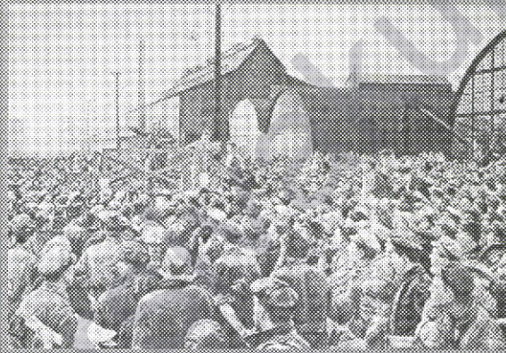
Ekim Devrimi sosyalizm mücadelesinde en büyük kazanımdır.

Aylık Teorik/Politik Dergi Sayı: 13 Ekim 2005 2 YTL / 2.000.000 TL