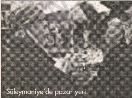
Süleymaniye'de pazar yeri.

"Yine ucuz döner-sandviç satan dükkanlar. Ellisekiz yaşşıma geldim, algı yaşım olan on yaşımdan sayarsam tam kırksekiz yıl ekmeği hep kudsisi bilip, lokmasını atmadım; mecburiyetten atacak olursam, başımla-dudağımla öpüp kudsayararak ve bir kağıt içinde atmak zorunda kalmışım daima. Döner etinin giremediği ekmek arasının alt bölümünün alenen ve sapır