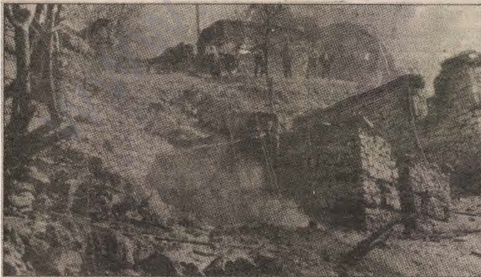
Şirnak, Kulp ve Varto'dan sonra yeni bir yerleşim birimi daha yerle bir edildi. Yanan evlerle birlikte üç bebek öldü.

getirilecektir. TC'ninde ABD'den izin almadan böyle bir operasyona girmesi mümkün değildir. Üstelik Çekiş Güç içindeki Amerikan hava kuvvetlerinin Türk askerlerine yardımcı olduğu belirtiliyor. Bölgede bir çok ABD ajanının bulunduğu biliniyor. Bu durum son operasyonlarda ABD-TC ortaklığının işaretidir. Trajik olan karşı cephe birlik halindeyken, birliğe daha çok ihtiyaç duyan ulusal cephenin parçalanmış olmasıdır.