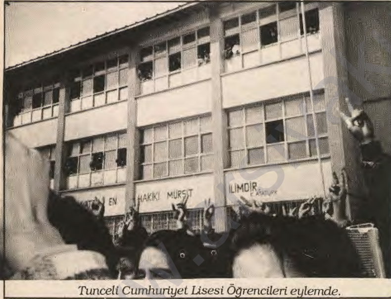
Tunceli Cumhuriyet Lisesi Öğrencileri eylemde.