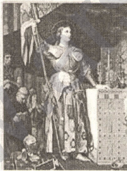
Fransız Kralı VII. Charles'ın taç giydiği gün ressam Jokond tarafından yapılan resmi.