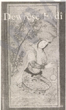
Dewrêşê Evdî romanı

Benim Kürtçe yazdığım ve Dewrêşê Evdî romanı Elma yayınları arasında yayınlandı. Kapağı aşağıda görülmektedir.