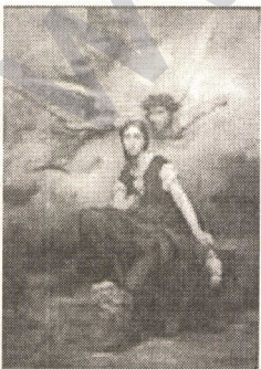
Ressam Eugene Thirion'un 1876 da Jan Dark ve melek Michael'i beraber resmettiği tablo.