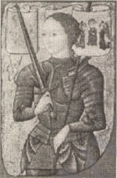
Jan Dark'ın 1505 yılında yapılan bir tablosu.

Aşağıda Jan Dark'ın değişik dönemlerde farklı ressamlar tarafından yapılan tabloları görülmektedir.