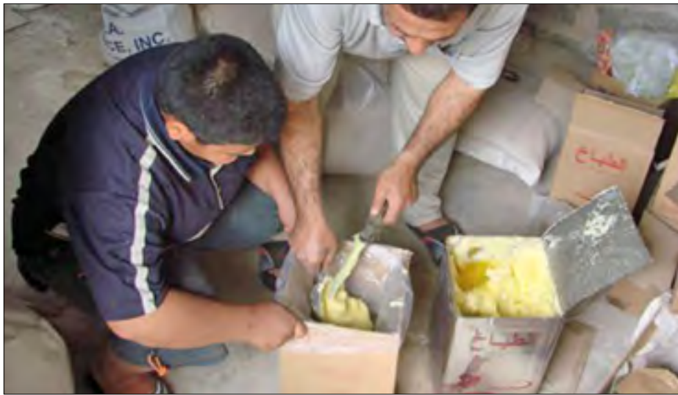
هه‌خۆراکی مانگانە له کاتی دابه‌شکردندا

«مانگی (٣) یه هیشتا به‌شه‌خۆراکی مانگی (١) مان بۆ نه‌هاتوه». «له ته‌له‌فزیۆنه‌کانه‌وه باسکرا که ئەم مانگه شه‌کری (٢) مانگ دابه‌شده‌کریت، به‌لام یه‌کشه‌مه شه‌کری یه‌ک مانگان بۆهات».