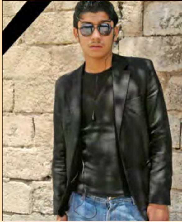
شه مید سورکتو

له خویشاندانه کانی چه ند روژی رابردوودا (٤) خویندکار کورزانو ژماره یه کیش بریندار بوون، به لام تا ئیستا وهزاره تی په روهرده ی هریمی کوردستان هیچ جوړه هه لویستی که له و باره یوه رانه گه یاندووه، هاوکات لیسته ئیژوسیونه کانی ماموستایان بیته لویستی وهزاره تی په روهرده بۆ حیزبییوونی نه وه وهزاره ته دهگه ریننه وه.