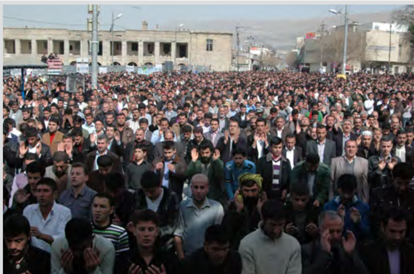
گۆرەپانی سەرای سلیمانی، چەندین هەزار خۆپیشاندا لە کاتی نوێژی هەیندا

یەکییتی ئەوروپا داوا لە دەسەلاتدارانی هەریم دەکات، توندوتیژی بەکارنەهێتن