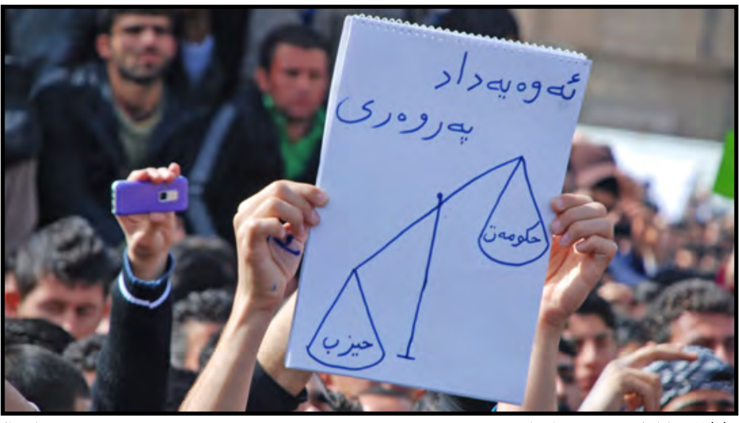
٢٥/٣/٢٠١١ په کيک له دروشمي خوږيشانده ران