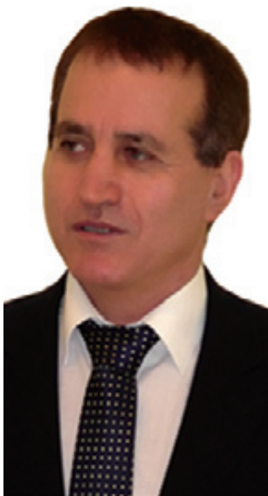
هه قال كويستاني

به كلاييكردنه وه ي نادا، به لام وهك ئه وه ده لىت: «له په رله مانى عيراقدا ئه وه سنوور جيا كرده وه يه نييه، ده توانين له ناو ئه وانه شدا كه به شدارى حكو مه تيان كرده وه، دهنگى ناره زايى بدو زينه وه به رامبه ر به سياسىيه كاني حكو مه ت و ئازادانه وه به پيچه وانه ي تيروانىنى سه رو كى ليسته كانيانه وه برياره ده وه ئه ستم نييه له وه په رله مانه دا (٢٥) ئيمزا بؤ لپيرسيه وه ي بهر پرسيكى كويستيه وه».