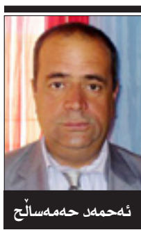
ئهممه له هه ممه سالخ

(مرکز التدریب المهنی) یه کیک له و پرۆژه گرنکو کاریگه رانه ی که له سه رده می فه رمانه وایه تی به عسیبه کانداه زۆربه ی شاره کانی عیراقدا هه بوو، ته نه ی له شاری سلیمانیا نه ییت، ناشکرایه که به عسیبه کان به مه به سستی په راویزخستن که هۆکاری سیاسی بووه، سلیمانیان له و پرۆژه یه و دروستکردنی نه خۆشخانه یه کی که وروه چه نه داها پرۆژه ی تر بیبه ش کردبوو.