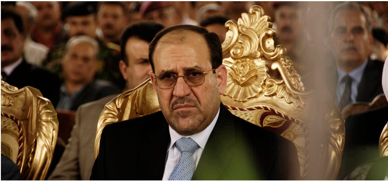
نایا مالیکی سەرگهوتوو دەبیت له کۆنترۆلکردنی دەستە سەر بەخۆکان؟