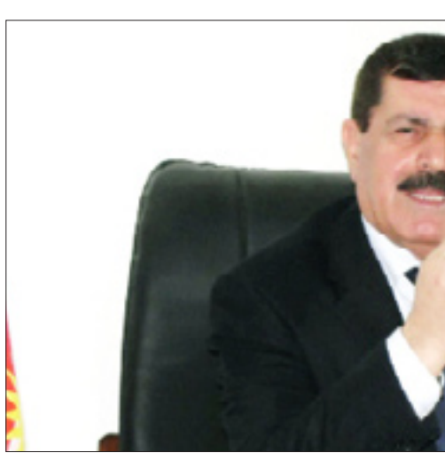
نیعمه ت عه بدولا

* به گشتی، له ولاتانی پشکه و تودا، نه ندای په رله مان و سهرؤکی په رله مان و جیګرو سکرتریز، پیش هه موو شتیک هه موویان نه ندای په رله مان، نه وه ندی هیه به ریوه برندی دانیشته کانی په رله مان له لایه ن سهرؤکه وهی که پی ده لین، قسه که ر یان (speaker)، هه روه ما به ریوه برندی کاروباری به ریوه برندی کاروباری کارگری و په ریوه ندییه کان که له نه ستوی سهرؤکایه تیبه، بویه نه گهر په ریوه یک به ر له مه هه بیت، پیوستی به جریکی تر هه لسه نګدن و هه موارکردن، یان گوزارکاری هیه، په رله مان وهک ده زکاګانی حکومت نیبه (رئیس و مرئوس) هه بیت، نه گهر وای لیها ت کاروباره کانی په رله مانیش که گه ل چاوه ری لئ دهکات، رو تین و بیروکراسی دهیانتکرتن. روژنامه: به رییه په ریه وی ناوخو،