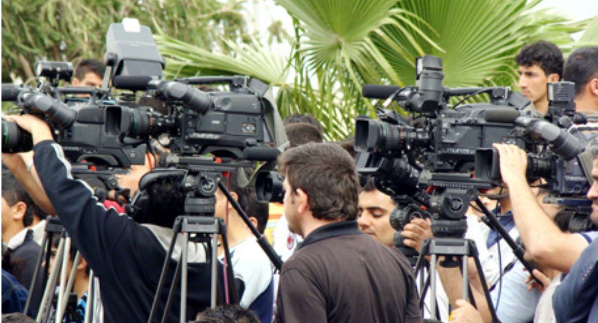
راگه یاندنکاران له کاتی روومالکرندی رودا ویکدا

وتیشی: «په رله مان، چن کراوه بیت به رووی