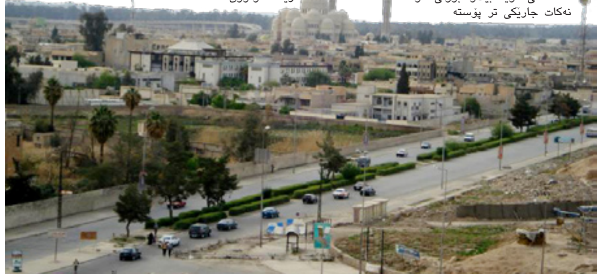
دیمه نیک له شاری موسل

وته بیژی لیستی برایه تی نه ی نه وا ئه وه شی خسته روو، له ئیستاشدا هه چ گفتوگۆیه کی فه رمی له نیوان ئیبه و لیستی هه دبا دا نییه، له گه ل ئه وه ی پیشتر به رپرسیانی لیستی هه دبا داوای ده رکردنی هیزی پیشمه رگه و جیبه جیکردنی ماده ی (١٤٠) یان کردوه، به لام داوای پیکهینانی حکومه ت که هه مو لایه نه کان به شدارییان تیدا کردوه، لیستی هه دبا هه لوئستیان تارا ده یه ک گسۆراوه، ئه وه ش هیوا ی