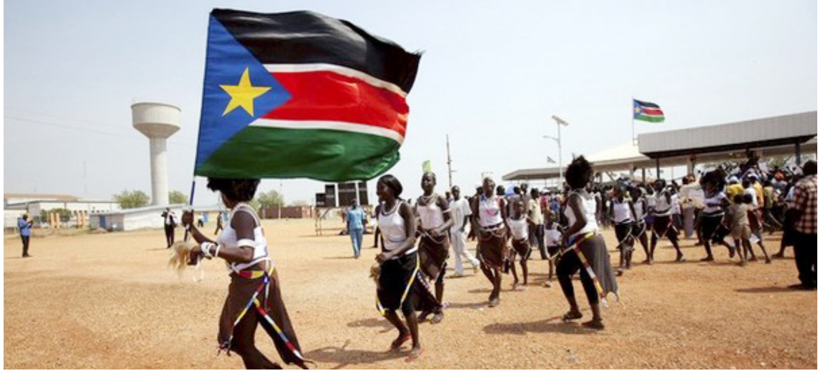
باشووري سوډان سهره بخوي ده وپت

هه ر چه نده پاره يه كي زور له دواي ٢٠٠٥ وه روي له باشوور كرده وه، كه به ٧ مليار ده خه ملينر ني ت، به لام هه مووي به فيرو چو وه ټيستا نه و هه ري مه له هه ژار ييدا گوز ه رده كات و پنيويستي به خوي دن گاو نه خوش خانه ي زوره. ولآتاي ديكه هه ولده دن بالانس له نيوان خيله كانياندا راگرن و بهر ژه وه ندييه كان دابه شكه ن، به لام باشووري سوډان فيري نه وه نه بو وه ته نيا بهر هه ميشي نه و ته. نه و تيش ملياري كي ديكه بهر هه مده هيني ت، به لام هم ملياره ش دهر و ات و خلك ناؤ مي در ده بيت و بهر به ره كاني دروست ده بيت.