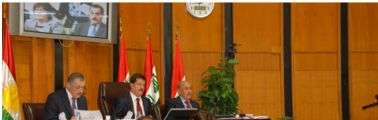
سەرۆکايەتتى پەرلەمان بەرپرسىيارە لە کەمىي دانيشتنەکان