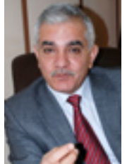
کامه ران نه حمه؛

له به رده و امی لیدو انه که پیدا نه و ه شی خسته روو، که دواتر حکومت بریار پیداوه به پی یاسا ده ستله کارکیشانه وه و له پروژه که لیکریت، به لایه له سره دمی عیما د نه حمه؛