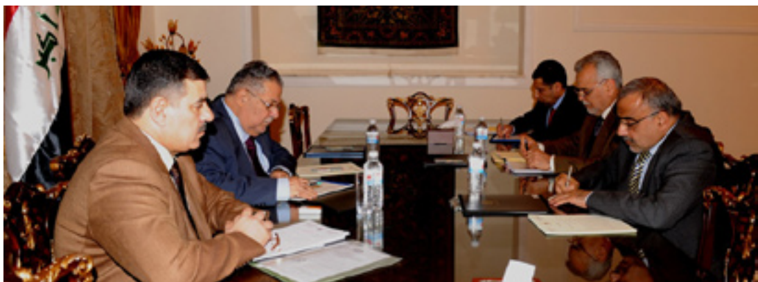
دەستە سەرۆکایەتی کۆماری وادە کۆتایی ھاتوو

یاساناسو ئەندامی ئەنجومەنی نوێنەران عیراق لەسەر فراکسیۆنی گۆران، جەختی لەسەر ئەوە کردووە: کە ئەو کەسایەتیانە سێفەتی رەسمی جیگری سەرۆک کۆماریان نەماووە ئەو ھەنگاوەیان بوو تە جێگە پرسیار، بە رۆژنامە راگەیاندا: «ئەو دوو کەسایەتیە وەک جیگری سەرۆک کۆماری و یلاھەتیان کۆتایی پێھاتوووە کارکردنیشان بە ناوی پۆستە کۆنەکانیانەو پەبووئە جێگە پێشینیو ھەبە، کە ھێشتا لە عیراق بەجێھێشتنی پۆست نەبوووە کەلتوووە رەنگە بەردەوامبوونیان لە پۆستەدا بۆ درێژپێدانو کردنی بێت بە ئەمری واقع».