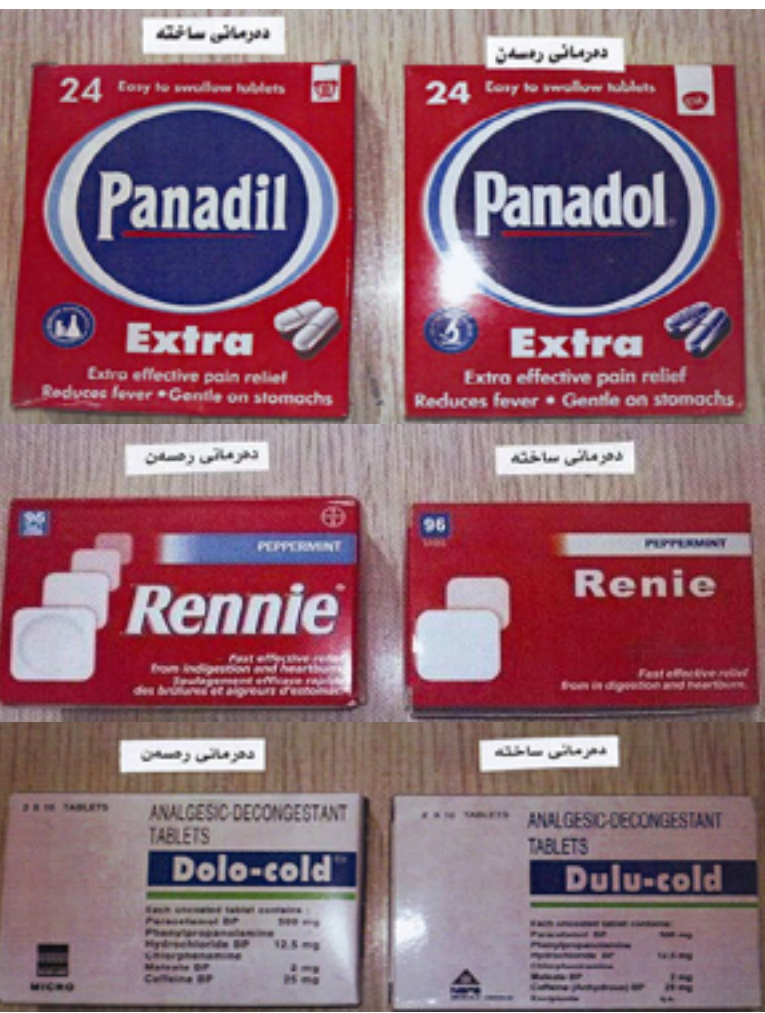
نمونه ی نه ووهی دهرمانانه ی که له بازاردا دفرؤشرین

د. تاهیر ههرامی، وهزیری تندرستی ههریمی کوردستان، جهختی له وه کرده ووه نه ووهی دهرمانانه ی دیت بۇ ههریم «هه مووی» له ریگه ی کوالیتی کونتروله ووه پشکنینی بۇ دهکرت، له لیدوانیکیدا بۇ روژنامه و تیشی: «هچ که سیک بوی نییه دهرمان فرؤشیت، تنیا پزیشکی دهرمانخانه کان نه بیته، نه وانیش ده بیته به شى دهرمانخانه یان ته واکردیته.»