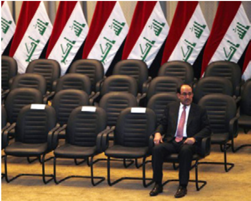
کورد ده‌توانی‌ت حکومه‌ته‌که‌ی مالیکی چۆڵ بکات

له‌ خالی (١٢)ی داواکارییه‌کانی ئینتیلافه کوردییه‌که‌دا، ئاماژه‌ به‌وه‌ دراوه‌ که‌ پۆیسته‌ پرۆسه‌ی پرچه‌ککردن و ئاماده‌کردن و پارهدارکردنی پاسه‌وانی سنووری هه‌ریم (پێشمه‌رگه) وه‌ک به‌شیک له‌ سیستمی به‌رگری نیشتمانی عێراق لێبکریت، به‌لام له‌ میتۆدی حکومه‌ته‌ نوێکه‌یدا، مالیکی ئاماژه‌ی به‌ هه‌نگاویکی له‌و جۆره‌ نه‌کردوو که‌ تایبه‌ت بێت به‌ پێشمه‌رگه‌ی ئاماژه‌ی به‌وه‌داوه‌ که‌ کارده‌کات بۆ بونیادانه‌وه‌ی هه‌زه‌ چه‌کداره‌کان له‌سه‌ر بنه‌مای پرۆفیشنالی به‌دوور له‌ ئینتیمای به‌رته‌سکو جه‌ختی له‌سه‌ر ئه‌وه‌شکردوو ته‌وه‌ که‌ ده‌بیت چه‌ک ته‌نیا به‌ده‌ستی ده‌ولت بێت و ریگه‌ به‌ هیچ چالاکیه‌کی ئه‌مینی ناردیت له‌لایه‌ن هه‌ر لایه‌نیکه‌وه‌ ئه‌نجامبدریت و ریگه‌ش ناردیت ده‌زگا ئه‌مینییه‌کان به‌ سیاسی بکریت، لێره‌شه‌وه‌ ئه‌گه‌ری ئه‌وه‌ هه‌یه‌ که‌ مالیکی