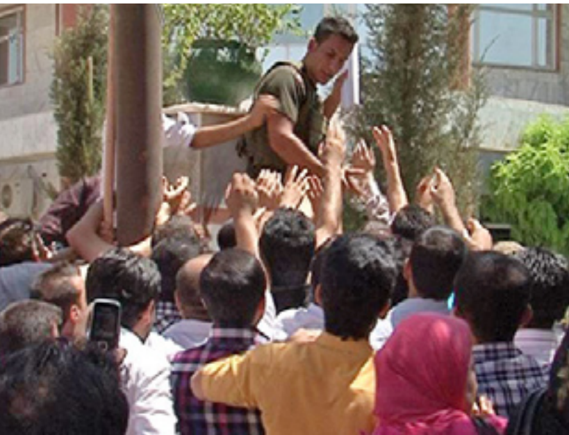
خوپیشاندانی دهرچووانی زانکو په یمانگانا

بیرمه که سالی خویندنی (١٩٩٠-١٩٩١)، هه و کات له پولی یه که می په مانگا بووم، ماموستای زمانی ئینگیزی ناوی (م. په یمان) بوو که ماموستایه کی پیاو بوو، پاش گه رانه وهی له گه شته که ی له ولاتی نه مسا، بو من و هاوپوله کانمی گزراپه وه گویا هه و ولاته، کار که یه کی ئوتومیلی دامه زرا ندوه بو به ره مه پینانی جوریک له ئوتومیلی تابه ت به ماموستایان و له گه ل ده ستبه کار بوونی هه ماموستایه کدا، نه ک ته نیا ئوتومیل، به لکو کلیلی خانووه کی پر کالو مواسه فاتی پیده ریت له و ناوچه تابه تیه ی که بو ماموستایان دابینکراوه و ناوی لیزاوه ماموستایان. بیرم نه چیت که هه وه شی پوتین، به هیچ شیوه یه ک ماموستایانیش، نه ک هه ر که مته رخمی ناکه ن له کاره که یان، به لکو کاتژمیراسا ئیلتیزام به کاتکانی دهوام و یاساکانی پهروه رده وه ده که ن، به لام خو له شاره حه یاته که ش، که ره کیک هه یه به ناوی ماموستایانه وه که ژماره ی مالی ماموستا تیایدا له په نجه ی یه که ده ست تیپه ر ناکات، که رهنه هه ندیک له مانه ش کریچی بن.