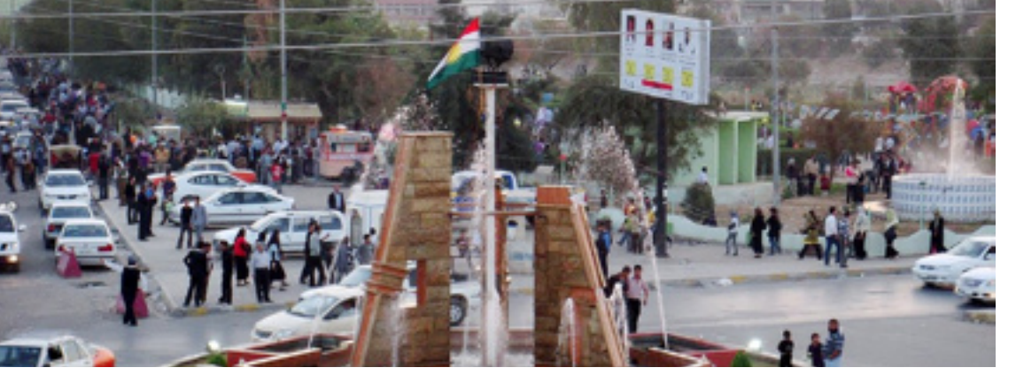
دیمه‌نیک له‌ شاری کەرکوک

به‌پێی زانیارییه‌کانی رۆژنامه‌، تائیسنا زیاتر له‌ پینجسه‌د خیزانی کورد له‌ ناحیه‌ی جه‌له‌ولا و نزیکه‌ی شه‌سسه‌د خیزانی دیکه‌ش له‌ ناحیه‌ی سه‌عدیه‌ ناوچه‌که‌یان چۆلکردووه‌و روویان له‌ شارەکانی که‌لارو سلێمانی و خانەقین کړدووه‌، به‌شیکیش له‌و خیزانانه‌ مولکو ماله‌کانیان به‌ عه‌ره‌ب فرۆشتووه‌ته‌وه‌، دیاردی چۆلکردنی ناوچه‌ کوردنشینیه‌کانی پارێزگای دیاله‌ به‌رده‌وامه‌و تائیسناش هه‌چ هه‌نگاوێک به‌ ئاراسته‌ی چاره‌سه‌رکردنی ئەو پرسه‌دا هه‌له‌نگه‌یراوه‌.