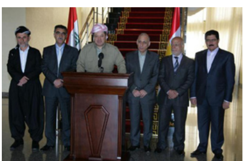
ئىتيلافى فراكسيۆنە كوردستانىيەكان بەر لە كشانەوى بزوتتەو ھەى گۆران

فراكسيۆنى گۆران بە نىيازىشە بۆ داواى روونكردنەو لەو مەسەلەدا گەلگەل فراكسيۆنەكانى يەكگرتوو و كۆمەل بەكەن لە پەرلەمانى كوردستاندا، عەبدان عوسمان، وتى: «ھەرچەندە قسەكردنى ئىمە لەسەر ئەو مەسەلە، دەبىتە قسەكردنى راگەياندن، چونكە ئەوان زۆرىنە لە پەرلەمان، واتە ئەگەر نەيانەوت ناتوانىت بەخريتە بەرنامەى كارىشەو، بەلام ئىمە وەك مەسەلەيەكى سولوى مەبەدئى قسەى لەسەر دەكەين.