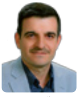
کاردۆ محمەد ئەندامی پەرلەمانی کوردستان