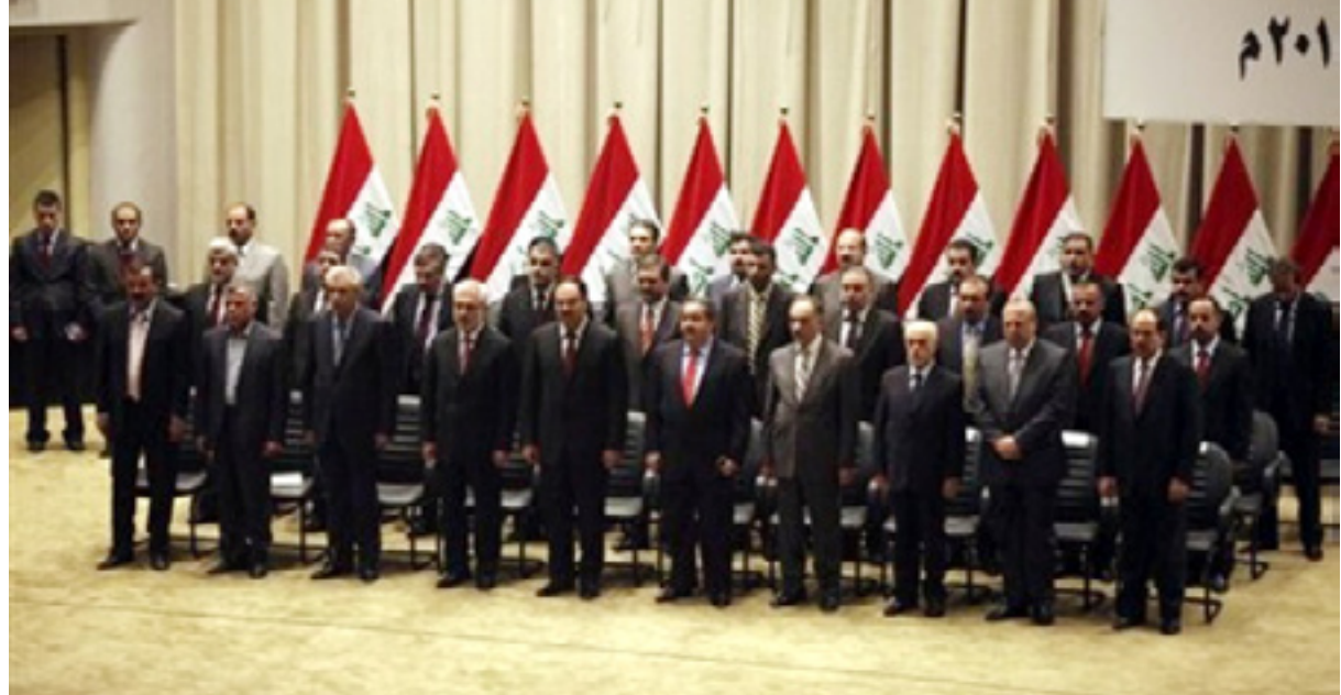
راگه‌یاندنی کابینه‌که‌ی مالیکی له‌به‌رده‌م ئه‌نجومه‌نی نوینه‌رانی عیراقدا

سه‌نگی کورد له‌ ده‌سه‌لاتی جیه‌یه‌جینکردن (٢١٪) هه‌و بۆ (١٦,٥٪) و له‌ ده‌سه‌لاتی یاسادانانیشدا (٢١٪) هه‌و بۆ (١٧٪) که‌مه‌ده‌ب‌یتیه‌وه‌ هه‌روه‌ک له‌ سه‌رۆکایه‌تی لێژنه‌کان و چاوهر وانیش ده‌کریت له‌ وه‌رگرتنی بریکاری وه‌زیر و سه‌رۆکایه‌تی و ئه‌ندامه‌تی ده‌سته سه‌ربه‌خۆکان و سوپا و ده‌زگا ئه‌منیه‌کاندا، رێژه‌که‌ به‌ره‌و که‌مه‌بوونه‌وه‌ی زیاتر ب‌چیت.