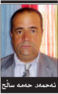
شمه مده حمه صالح

له دواى راپه رینه ووه له پیناو کومه لگه په کی به بهرهم و بهر زبونونه ووهى بارى نابوری ولات، ژیرخانی نابوری گورانیکی نه وتوی به خووه نه بییوه.