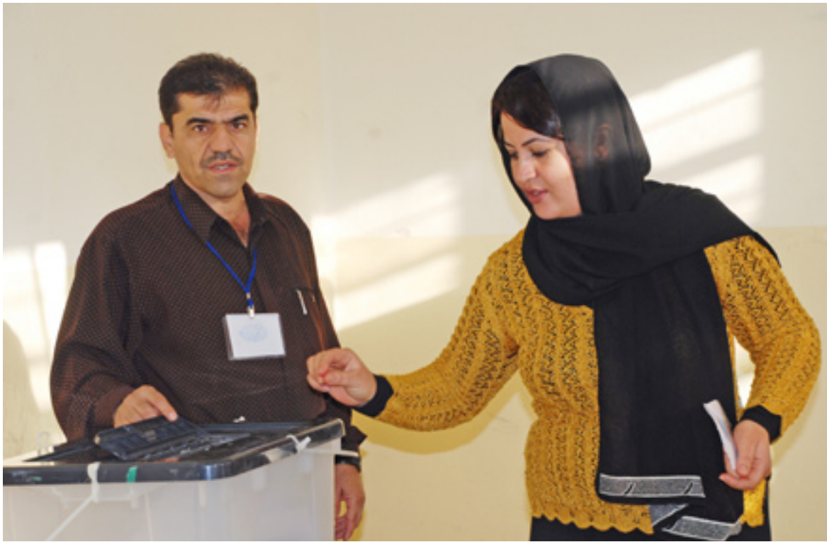
سلیمانی ٢٠١٠/١٢/٢ هلبزاردنی ماموستایان