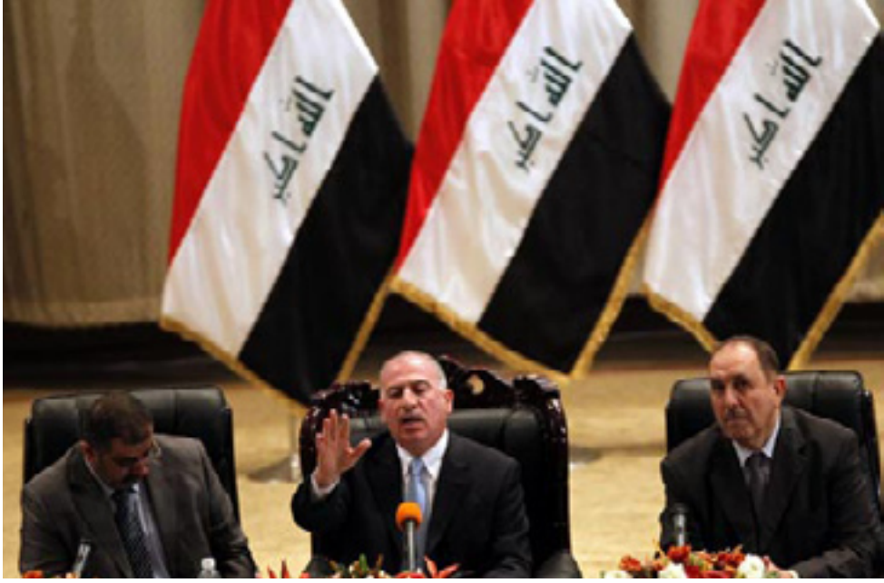
نوجیفی و دوو جیگره‌که‌ی

له ده‌ستووری عیراقدا ئاماژه به‌ چه‌مکی ده‌سته‌ی سه‌رۆکایه‌تی نه‌کراوه، به‌لکه‌ سه‌رۆکی ئه‌نجومه‌ن و جیگری یه‌که‌م و دووم هه‌یه‌و ده‌بیت له‌ په‌ره‌وی ناخۆی په‌رماندا، ئه‌رکی جیگری یه‌که‌م و دووم سه‌رۆکی ئه‌نجومه‌ن جیابگریته‌وه. به‌مه‌ش ده‌سه‌لاتی ته‌واوله‌بری ده‌سته‌ی سه‌رۆکایه‌تی ئه‌نجومه‌نی نوێه‌ران، ده‌دریته‌ سه‌رۆکی ئه‌نجومه‌نه‌که‌، که ئوسامه‌ نوجیفی و به‌ پیچه‌وانه‌شه‌وه، ده‌سه‌لاته‌کانی هه‌ریه‌ک له عارف ته‌یفورو قوسه‌ی سوه‌هیل، که جیگرانی سه‌رۆکی ئه‌نجومه‌نی نوێه‌ران، که‌مه‌به‌یته‌وه‌و ده‌گه‌رپه‌ته‌وه‌ بۆ سه‌رۆکی ئه‌نجومه‌ن. له‌وباره‌یه‌وه‌ به‌کر حه‌مه‌سدیق، یاساناس و په‌رله‌مانتاری کورد