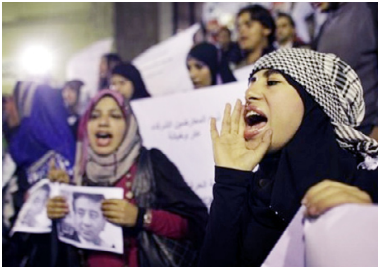
حوسنی موبارکه، جهمالی کوری بۇ سهر رۆک کۆمار ناماده دهکات

هه لپژاردنه په رله مانیه که ی میسر، ئەو ولاته بهر ه و تاکر ه ویی زیاتر ده بات، له کاتیکدا ئۆپوزسیونی ئەو ولاته ش به هوی بوونی ساخته کارییه کی زۆر له هه لپژاردنه که کشانه وه.