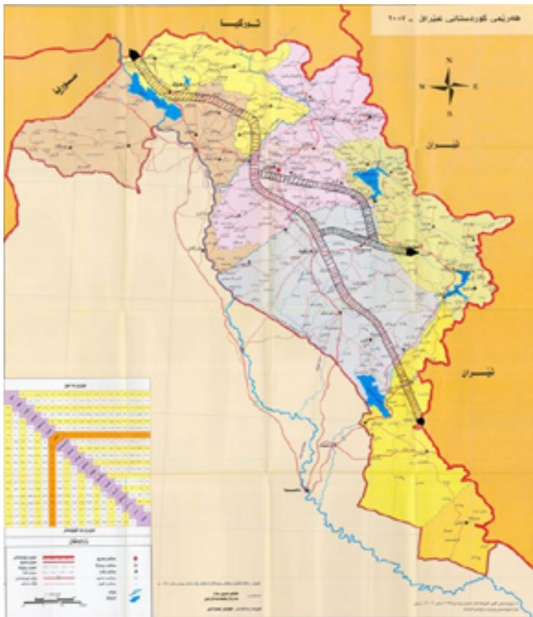
هیلنى ناسن پيوستییەکی گرنگە بۆ کوردستان

گواستەو و گەياندن، شادەماری بێمالەى ئابووری هەموو ولاتیەکەو نامرازەکانی گواستەو بریتین لە رێگاوبان، هیلەکانی ناسن، هیلە دەریاییەکان، هیلنى ئاسمانی و ئەمڕۆش لەسایەى شۆرشى ئەلەکترونییهو، ئینتەرنێت گشت سنوورەکانی بەزاندوو، بۆیه لەئێستادا ئینتەرنێت بۆه بە نامرازیکى گواستەو و زانیاری و داتا و پەيوەندییه بازگانییهکان، بە تاییهت لە کاری بانکەکاندا. هیلەکانی ناسن بۆ گواستەو، چ لە بوارى بازرگانى، گەشتوگوزارو گواستەو و هیلەکانى هاوڵاتیان لە کاتى جینهجێکردنى کارە ناساییهکانى رۆژانەدا بەکاردين، لەبەرئەوه هیلەکانى ناسن، گەرترین خزمەتى راستەوخو بە گشت سیکنەرەکانى ئابووری پێشکەش دەکەن. لەبەر گرنکی رۆلى هیلەکانى ناسن وەک نامرازى گواستەو، ناماژەیهکی کورت بۆ ولاتى ئەلمانیا دەکەین، وەک نمونەیهکی چالاک لەو بوارەدا. لە ئەلمانیا، سێ جۆر لە خەتى ناسن هەیه-