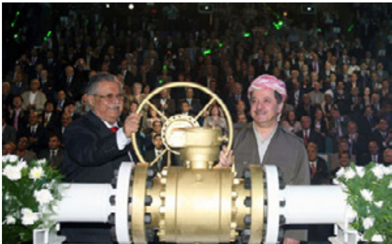
پاره‌ی داهااتی نهوت له هه‌ریم گلددریته‌وه

به پێی پرۆژه‌یاسای بودجه‌ی (٢٠١١)ی عێراق، که له ئه‌نجومه‌نی وه‌زیرانی عێراقه‌وه ئاراسته‌ی ئه‌نجومه‌نی نوێنه‌ران کراوه به مه‌به‌ستی تاووتوێکردنی، رێژه‌ی (١٧٪)ی هه‌ریم دیاریکراوه به جیاکردنه‌وه‌ی بودجه‌ی سیادی و حاکییه‌وه له‌نیو ئه‌و بودجانه‌ی که خراونه‌ته‌وه له‌نیو ئه‌و جیاکردنه‌وه‌وه له بودجه‌ی گشتیی بۆ دیاریکردنی به‌شه بودجه‌ی (١٧٪)ی هه‌ریم بری تێچوونی گریه‌سته‌کانی وه‌به‌ره‌ینانی نه‌وته به پاره‌ی ئه‌و گریه‌سته‌نه‌شه‌وه که کۆمپانیا بیانییه‌کان