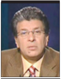
د. خالد مونتەشیر

مروۇف سەرکەوتن، شۆرتتو ناوبانگ و نەمری وەك دەرمان و خۆراکی ناو قوتوو بەرواری بەسەرچوونیان هەیه! «ئۆپرا وینفری» ژنە پێشکەشکاری ئەمریکی وێستی بە کەناریگروونی خۆی لە پێشکەشکردنی بەناوبانگترین بەرنامە لە میژوودا ئەم پەيامە بە گوماندان بەدات: «پیش ئەوەی بەسەرچیت، لە وادەي گونجودا وازبەهێنە، پیش ئەوەی بریسکانهوەی خەلکیت بکوژیت، دەرەوشانەوی خۆت بپاریزە»، بیرمان نەچیت ئەو خەلکییە بوونەتە مایەي سەرکەوتنی تۆ، پیش ئەوەی هێلکەي بۆگەن و تەماتەي ریزوت تێ بگرن، با بە چەپلەپێزان بەریت بکەن، بیستو پێنج سالا ئۆپرا وینفری روژانە لە سەرکەوتندا بوو، سی ملیون بیئەری ئەمریکی هەبوو و لە سەدو چلو پێنج و لاتدا پەخش دەکر.