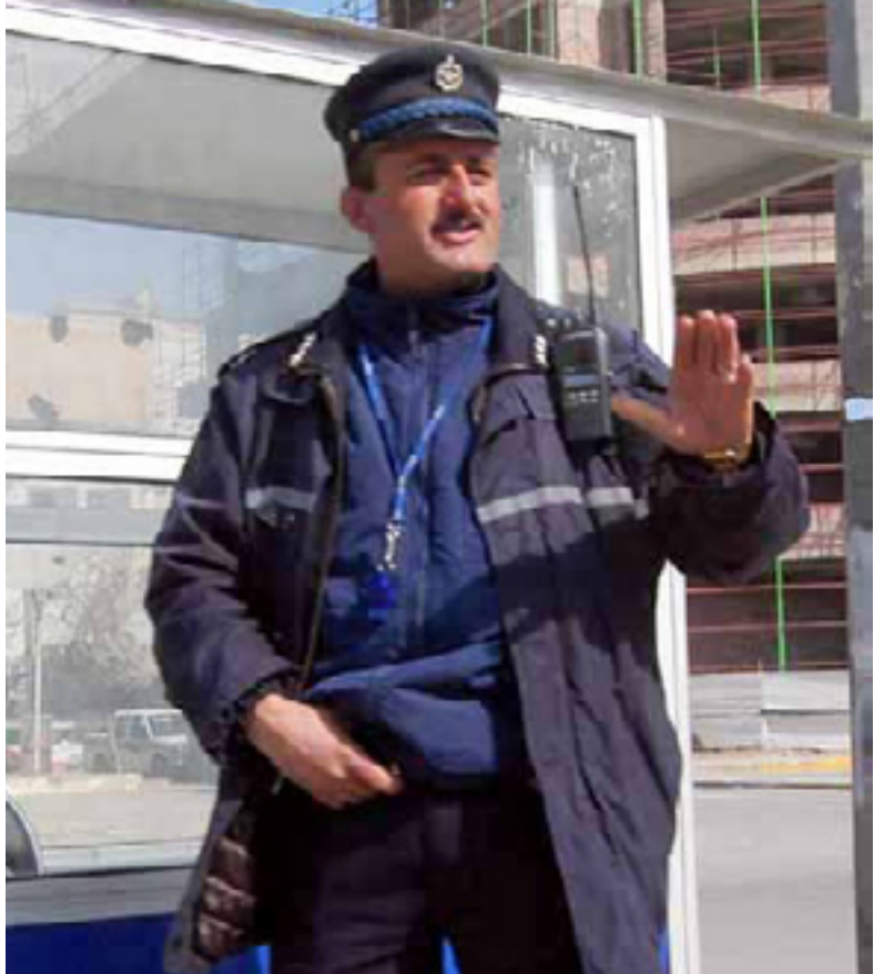
پۆلیسیکی هاتوچۆ لهكاتی راپهراڤاندنی ئهرکهکانیدا