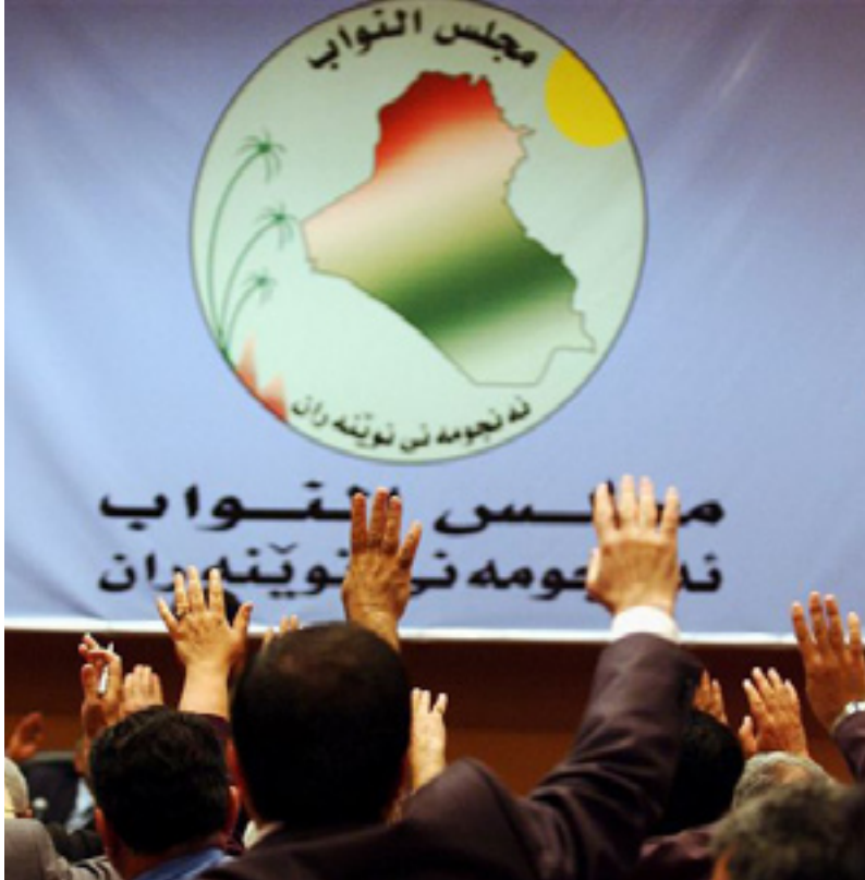
پەرله‌مانی عیراق

هاوکات به‌پێی زانیارییه‌کانی رۆژنامه، سه‌رۆکایه‌تی هه‌ردوو لیژنه‌ی یاسایی و ئابووری و وه‌به‌رئێنان له‌نیوان ئیئتلافی فراکسیۆنه کوردستانییه‌کان و عیراقیه یه‌کلا یه‌بووه‌ته‌وه، له‌کاتێکدا که عیراقیه داوای لیژنه‌ی یاسایی ده‌کات، ئیئتلافی فراکسیۆنه کوردستانییه‌کانیش داوا ده‌کات، که سه‌رۆکایه‌تی ئه‌و لیژنه‌یه‌یان پێدراوه‌و ئاماده‌ن له به‌رامبه‌ردا ده‌ستبه‌رداری سه‌رۆکایه‌تی لیژنه‌ی نه‌وت و گاز بن و ئالوزبونی ئه‌و کێشه‌ش لایه‌نه‌کانی ناچار کردوه په‌نا به‌رته‌ به‌ر لیژنه‌ی بچووکراوه که به‌ لیژنه‌ی ده‌ستپێشخه‌ری ناسراوه هه‌ریه‌ک له درۆژ نوری شاوه‌یس، له ئیئتلافی فراکسیۆنه کوردستانییه‌کان و حه‌سه‌ن سیند، له هاوپه‌یمانی نیشتمانی و رافع عیسای، له ئیئتلافی عیراقیه تیاپا