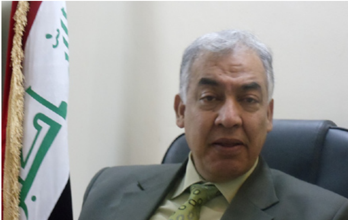
شاکر كه تاب

* پشت به مه بده ئى ته وافوق و ده نگدان ده به ستين له ئه نجمه نى نوينه راندا بۆ چاره سهر كردهى ئه و دۆسيه