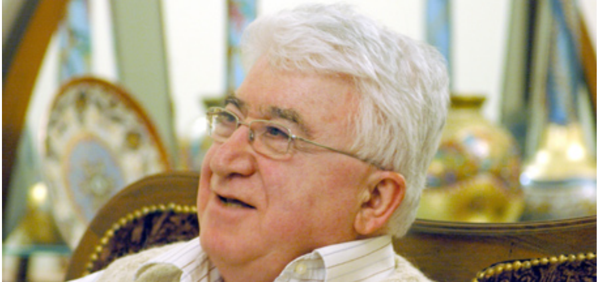
د. فوئاد مەعسوم