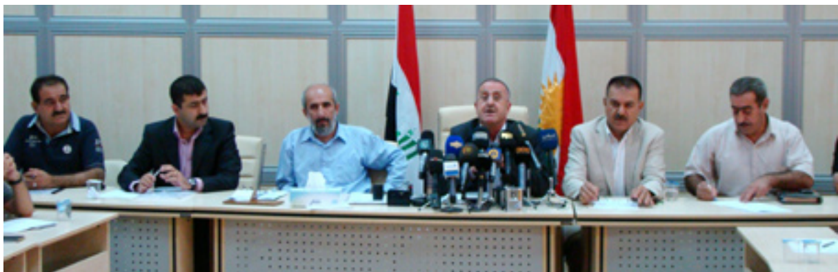
كۆبوونەوهىكەى ئەنجومەنى پارێزگای سلیمانى

پارێزگای سلیمانى، كە ئامادەى كۆبوونەوهىكەى بوو، ئەو دەخاتە روو: كە كۆبوونەوهكە ئەنجامى باشى نەبوو بەپىشەى حكومەت چارەسەرى بێرەتتى بۆ نەبوو، لە لێدانىكدا بۆ رۆژنامە وتى: «ئومیدمان هەبوو ئەو بانگێشتكردنە بۆ چارەسەرى ئەو كیشەى بێت، كە هەیه، بەلام كەچووینە ئەوئى هەستمان نەكرد بە چارەسەرىكى بێرەتتى و هاتین و بیانەوت كیشەكە چارەسەر بكن».