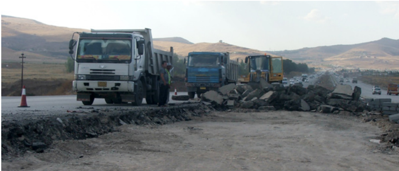
هاولاتیان بیزاریون له تیکان و نوێکردنەوی شەقامی تاسلوجە- سلیمانی

له نۆژەنکردنەوی شەقامی سەرەکی نیوان تاسلوجە - سلیمانی هیچ شوینیک بۆ گەرانهوی ئۆتۆمبیل (یوتیرن) نههیلراوتهوهو گرفتى بۇ هاتوچوى هاولاتیان دروستکردوه، له ئیستاشدا بهوهوییه جاریکى دیکه بهشیکی شەقامهکه تیکدراوتهوه.