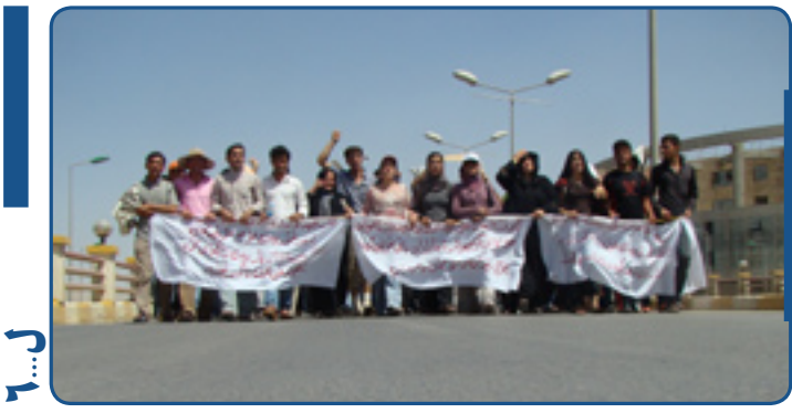
دەسلەلات و ئۆپوزىيۇن لەسەر خۇپشاندان ناكۆكن