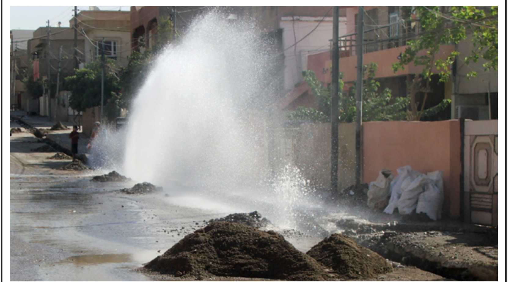
هه فیه رۆدانی ناو له یه کی که له پرۆژه مانی حکومه ت له گه ره کی به ختیاری - سلیمانی

ریژهی (١٠٠٪) ته وا بو وه خه لگی ئه و ناوچه یه، شایه تحال ن كه ئه و پرۆژه یه بوونی هه یه، یان نا! ٤- له به ره ئه وه ی (٥٪) ی سلفه ی پرۆژه که وه رنه گه یراوه، بۆیه سالانه له بودجه دا دوو باره ده بیته وه به هه لو اسراوی (معلق) ی ماوه ته وه تا سلفه ی کوتایی بو ورده گه یریت، كه له مسالدا ئه ویش کوتایی پیدیت. له راگه یان دن: هوناد ئه حمه د