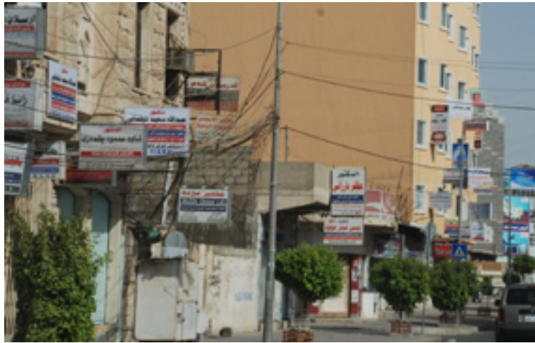
تا عیاده کان زۆر بن نرخ زیاد ده کات

ریخراو، فراوانبو نه که ش بۆ نه وه یه کاروچالاکیه کانمان له سه رجم شه ره کانی کوردستاندا بلاویته وه هه ولده ده ین له ریگه ی که ناله کانی راگه یاندنه وه، رای هاولاتییان سه بارهت به نرخ ی عیاده که موکۆرتیه کان بخریته روو، له پاشان هه لمه تی ئیمزا کۆردنه وه له سه رجم شه ره کان ده ستپیکه ین.»