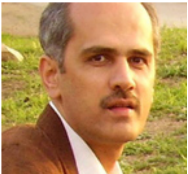
د. نیبراهیم محمه د جها