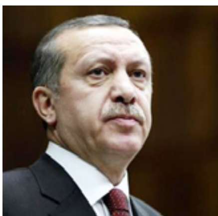
وه له پۆستی سەرۆک وەزیرانی ئەو وڵاتەدا دەستبەکاربوو تا ئێستا حیزبەکی توانیویەتی له دوو خولی هەلبژاردنی ئەو وڵاتەدا، سەرکەوتن بەدەستبەینیت.

بە رۆژنامەیی راگەیاندا: ئەو رەفتارەیی نەخۆشخانە دەروونیەکان لەگەڵ نەخۆشی دەروونیەکان دەیکەن، تەنیا پەیوەندی بە رەفتاری پزیشکەو هەیه، ئەگینا لە پەرلەمانی کوردستان تائیسیتا یاسایەکی نێه لەمبارەییو، وتیشی: «وێکو فراکسیونی گۆران پرۆژە یاسایەکیان ئامادەکردووە، بەلام تائیسیتا پزیشکەشی سەرۆکایەتی پەرلەمانمان نەکردووە، لەبەرئەوێ ریکخراوی هاردلانیش بریاره پرۆژە یاسایەکی لەو بارەییو ریکخەن، بۆ ئەوێ لەگەڵ ئەوان پزیشکەشی سەرۆکایەتی پەرلەمانی بکەین».