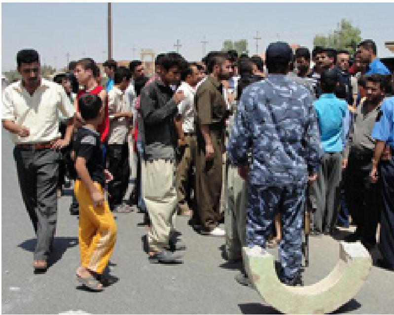
دیمه نیک به خو پیشاندانی ههفته ی رابردوو