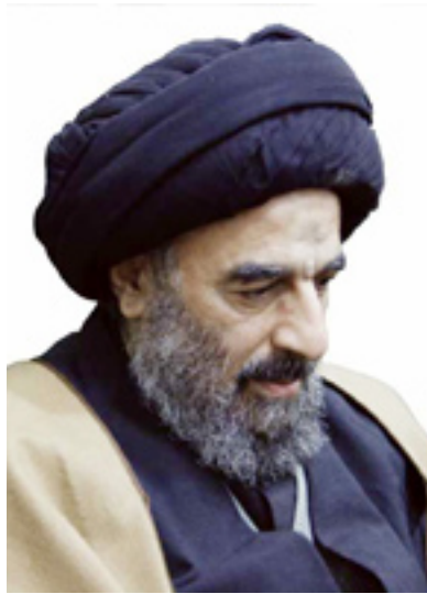
محەمەد تەقی مودەریسی