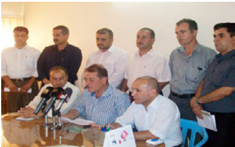
كۆبوونەو ھى ۸ لىستى مامۇستايان

ھاوكات رۆژى (۸/۱۴) لىستەكانى مامۇستايانى دەرەو ھى يەكئىتى و پارتى لە كۆبوونەو ھەيەكىندا سووربوونى خۇيان لەسەر داواكارىيەكەيان راگەياندو برىارىاندا «كۆبوونەو ھەيەك لەگەل مەكتەبى سكرتارىەتى و تەنقىزىدا ئەنجامبەندەو دواتر ياداشتىك ئاراستەي سەرۇكايەتى پەرلەمان و لىژنە پەيوەندىدارەكان بەكەن».