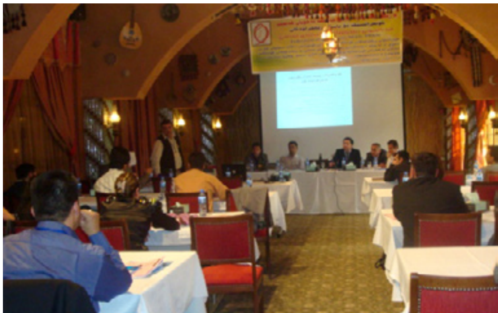
چالا کوانیک: ریکخراویک بیته بار به سه ر کۆمه لگه وه داخرانی باشتره

حکومه تی ههریمی کوردستان له دوا پرۆژهدا بۆ ریکخراوه کانی کۆمه لگه ی مه دهنی بریاریدا له جیاتی بودجه ی چه سپاو بۆ ریکخراوه کان چیدی له سه ر بنه مای پرۆژهدا و پرۆژه ی به سه وود پاره باده ریکخراوه کان و تا ده رچوونی یاسای نوی تاییه ت به ریکخراوه کانی کۆمه لی مه دهنی مانگانه بری دوو ملیون نیو دینار خه رج ده کریت بۆ ئه و ریکخراوه تی تا ئیستا مینحه له حکومه ت وه ره دگرن و به وه نگا وه ش مانگانه زیاتر له 300 ملیون دینار بۆ حکومه ت ده گه ریته وه. چالا کوانانی بواری ریکخراوه کانی کۆمه لگه ی مه دهنیش پینانوائیه بریاره کی حکومه ت له به رژه وه ندی هه ندیک ریکخرا و ه دات و چالا کوانیکیش له و بروایه دایه ئه گه ر ریکخراویک بۆ بودجه پشت به حکومه ت بیه ستیت باشتره» برواته وه ماله وه.