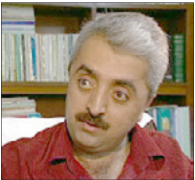
د. که یوان ئازاد هه نومر