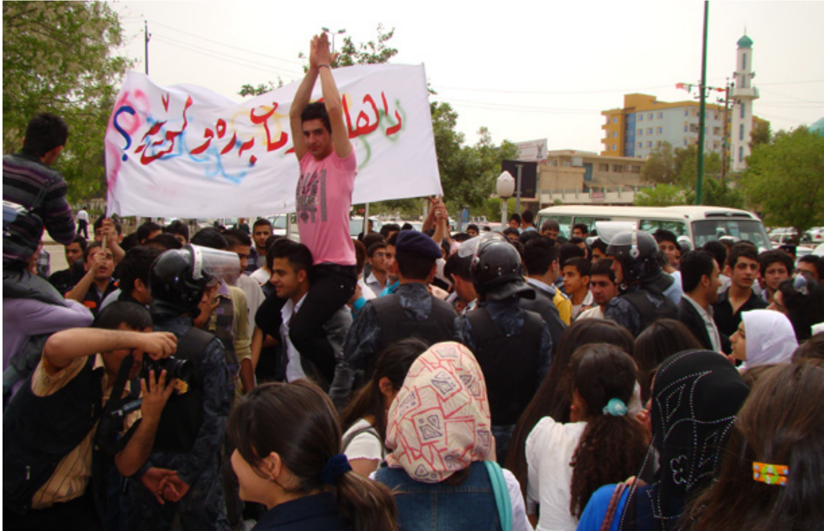
خویندکاران یه‌که‌م قوربانی بیپلانی سیستمی په‌روه‌رده‌ن له‌هه‌رمێدا