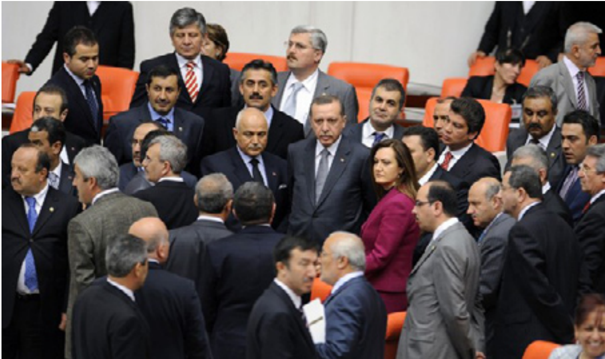
ئهردوگان له گه ل په ره له مانتاران ی تورکیا له باره ی هه مواری ده ستووره ده دوت

پاش ئه وه ی پارتی دادو گه شه پیدان بریاریدا که چه ند ماده یه کی ده ستوور هه مواری بکات، بو ئه و مه به سته ش هه وله کانی ئه که په به ره وه م بوو تاوه کو به هۆکاری چه ند ماده یه ک هه موار کرا، سه باره ت به ریگریه کانی به رده م پرۆسه ی هه مواری کردنه که، لایه نه ئۆپۆزسیۆنه کانی بوون، که تانیستاش ئه و ریگریانه به ره وه مان، به لام سه باره ت به کورد بو چوونیکی یه کلاییکه ره وه له ئارادا نییه، پارتی ناشتی و دیموکرا تی، که تاکه پارتی کوردی جه ماوه ری بنکه فراوانه و له جیگه ی ده ته په ی داخراو درژه ی به کاری سیاسی داو دژایه تی هه مواری کردنی ده ستوور ده کات، ئه مه ش بووه ته جیگه ی سه رسوسپمان و تیزامانی ئه ندامانی پارتیه کی ئه ردوغان و هه ندیک لایه نی دیکه ی کوردی. رۆژنامه ی زهمانی کوردی له راپۆرتیدا ئه و ناکوکیه ی بلاوکردوه ته وه که له نیوان پارتی ناشتی و دیموکراسی و پارتی به شداری دیموکراسی (KADEP)، که پارتیکی دیکه ی کوردستانی تورکیا، به لام به هوی ئه وه ی که به شنیوهیه کی راسته خۆ پشتگیری له هه لویتسه کانی په که که ناکات، ئه و بنکه یه کی جه ماوه ری فراوانی نییه، سه باره ت به گۆرانکارییه کانی ده ستوور، سکریتکری پارتیه که نیزامه تین ماسکان ره خنه له هه لویتسه نه رییه کانی (به ده په) ده گریتو پینوایه؛ «پنویسته پارتی ناشتی و دیموکراسی پشتگیری له هه رگۆرانیک بکات و ئه گه ر پیچه وانه ی ئه م کاره بکات، ئه و دژی ویسته کانی کورد ده وسیتته وه، هه روه ها خه لکی کوردی تورکیا دژی ئه وه یه که هاوه لویتسی دروستیت له گه ل پارتیه توندپه و