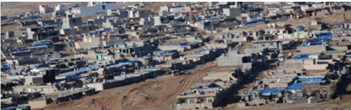
ﮔﻪﺭﻩﻛﻰ ﻛﺎﻧﻰ ﺳﯧﭙﯩﻜﻪ ﻟﻪ ﺳﻠﯩﻤﺎﻧﻰ

ﺑﻪﺭﯨﯟﻩﺑﻪﺭﻯ ﺑﺎﺧﭽﻪﻛﺎﻥ ﺋﺎﻣﺎﯞﻩﻱ ﺑﻪﯞﻩﺷﻜﺮﺩ؛ ﺋﻪﯞ ﺷﯘﻳﻨﺎﻧﻪﻱ ﻛﻪ ﺑﺎﺧﭽﻪﻳﺎﻥ ﺗﯩﺪﺍ ﺩﺭﯗﺳﺘﻪﻛﺮﺍﯞﻩ، ﺑﻪﮬﯘﻱ ﺋﻪﯞﻩﯞﻳﻪ ﻛﻪ ﮬﯧﭻ ﺧﺰﻣﻪﺗﮕﯜﺯﺍﺭﯨﻴﻪﻛﻰ ﺩﯨﻜﻪﻱ ﺑﯘ