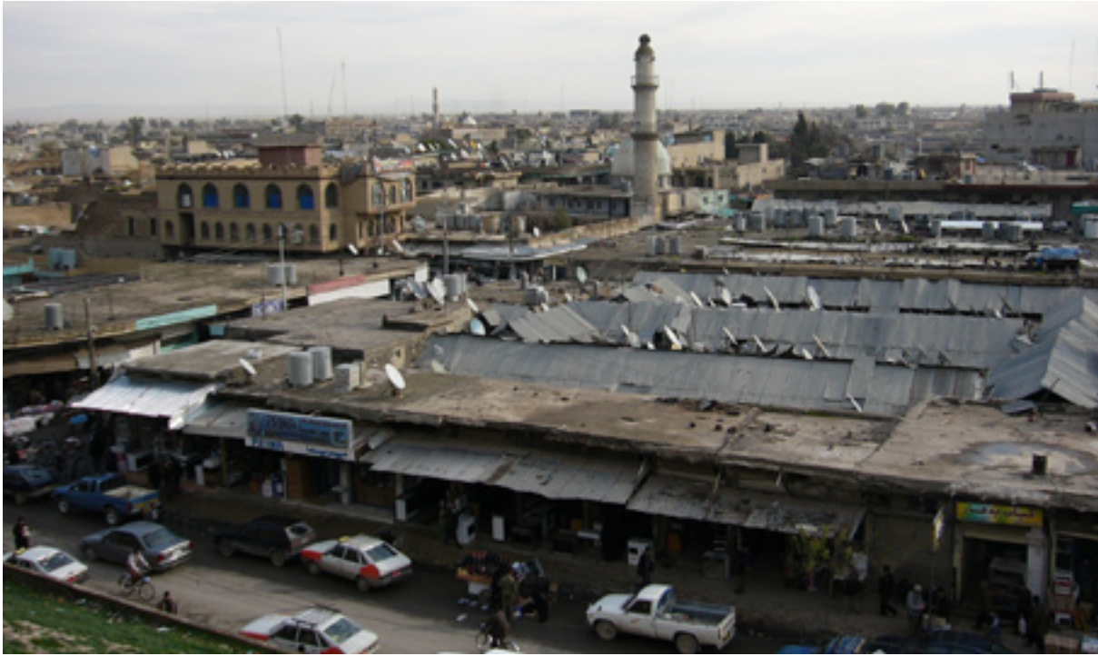
هه‌ولیری پایته‌ختی هه‌ریمی کوردستان

پیناوبو: ئەم پرۆژه‌یه‌ له‌ کابینه‌ یه‌ک له‌دوای یه‌که‌کانی رابردو ده‌بوو به‌ جدی کار یه‌سه‌ر بکریته‌ زووتر ته‌واو ببوایه‌، وتیشی: «ئه‌وه‌ وه‌لامه‌ی وه‌زیری شاره‌وانی که‌ پرۆژه‌که‌ کاتی پیناوبوووه‌ ئیستا چاره‌وانی به‌لینده‌رایه‌تییه‌، وه‌لامه‌ی ته‌واو نییه‌و که‌مه‌رخه‌می حکومه‌ت نیشانداده‌ت.»