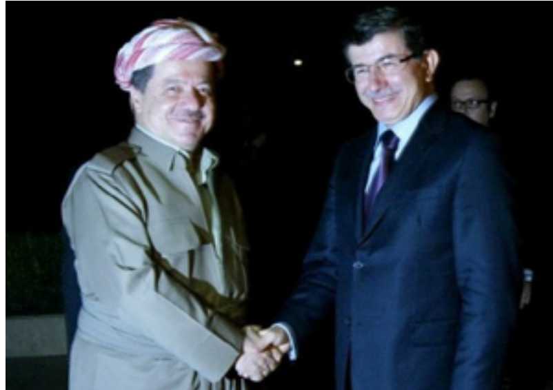
داود تۇغلۇو مهسعود بارزانی

پاش ئه وهی ماوهیه کی زور تییه ری به سهر ئه و ناکوکیه سیاسیانه ی نیوان هه ریمی کوردستان و تورکیا، له ئیستادا رۆژ به رۆژ بارودۆخی نیوان هه ریمی کوردستان و تورکیا ههنگاو و گۆرانکاری تاز به خۆیه وه ده بینیت، کردنه وهی کونسولخانه ی تورکیا یه کیگ بو له ههنگاو گرنگه کانی ئه و هه ولانه ی تورکیا بو نزیگبوونه وه له هه ریمی کوردستان، هه ر دوا ی ئه و ههنگاو به شنیوهیه کی فراوان په یوه ندیه بازرگانییه کانی که و ته جوله و چه ندین شانده کومپانیای زور هاتون بو هه ریمی کوردستان به مه بهستی وه به رهینان، سالی رابردو کاتیگ ئه حمده داود تۇغلو، هاته هه ریمی کوردستان بابه تی سهردانی بارزانی بو تورکیا هاته کایه وه، سهردانی سه روکی هه ریمی کوردستان هه لگری چه ندین شیکردنه وهیه، چونکه تانیستاش تورکیا ئاماده نییه ناوی کوردستان به بینیت، ئیستاش که چه ندین به رژه وه ندی ئابووری و سیاسی هه ریمی کوردستان و تورکیا لیکتیزکردوه ته وه، ئه و بارودۆخه که و ته وه ته حاله تیکی ناچاریه وه بو تورکیا. جۆرایه تی پینشوازیکردن له سه روکی هه ریم بو تورکیا جیگه ی شروقه ی زور، رۆژنامه ی حوریه ت و سایه ی تورکیه ی ده لی نیوز، راپۆرتیکیان سه باره ت به سهردانه چاوه روانکراوه که ی بارزانی بو تورکیا بلاوکردوه ته وه، له و راپۆرتا چه ندین ته وه ر باسکراوه، یه کیگ له و کیشه سه ره کانه بریتیه له ناوینشانی بارزانی، له راپۆرتا که دا ئه و نمونه خراوه ته وه؛ که سالی رابردو