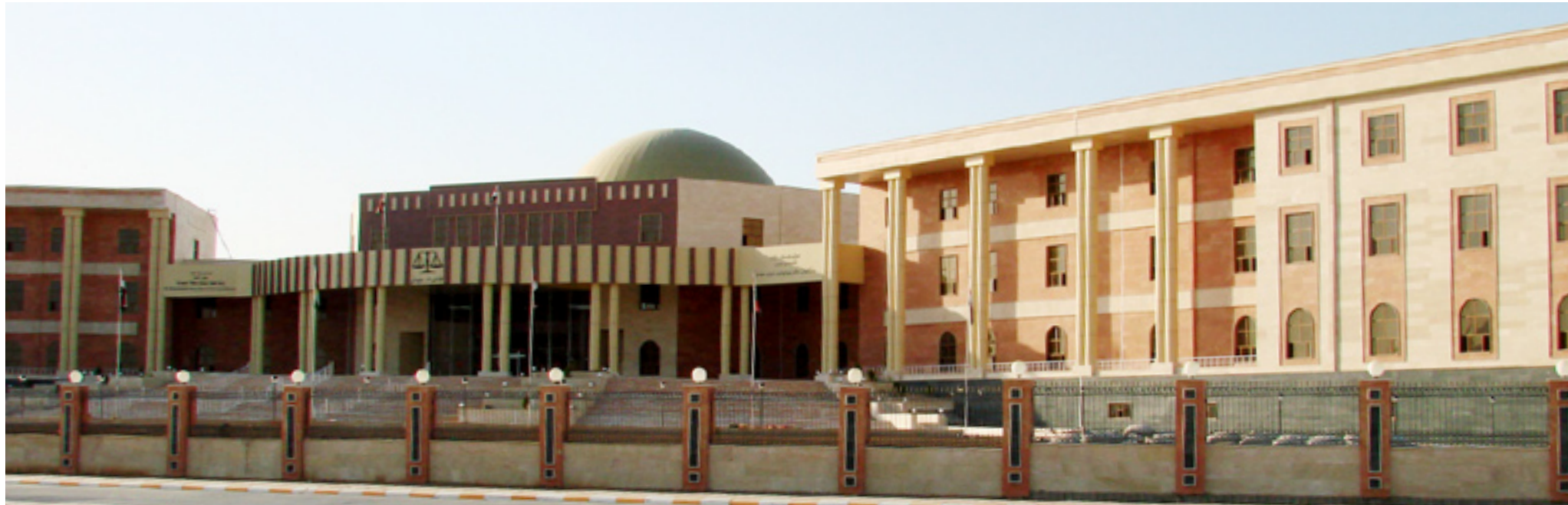
بیدادی له‌ خانه‌ی داد دا کراوه

له‌ مانگی ئازاری (۲۰۰۵) دا گریبه‌ستی دروستکردنی پرۆژه‌ی بینای خانه‌ی دادی سلیمانی ئیمزاکراوه‌و له‌ (۲۰۰۵/۴/۱۲) وه‌ ده‌ست کراوه‌ به‌ کارکردن تیا‌داو به‌ پێی گریبه‌سته‌که‌ش، بریاربووه‌ له‌ ماوه‌ی (۴۲۶) روژدا پرۆژه‌که‌ ته‌واوبییت و له‌ مانگی ئایاری (۲۰۰۶) دا ته‌سلیم بکریت،