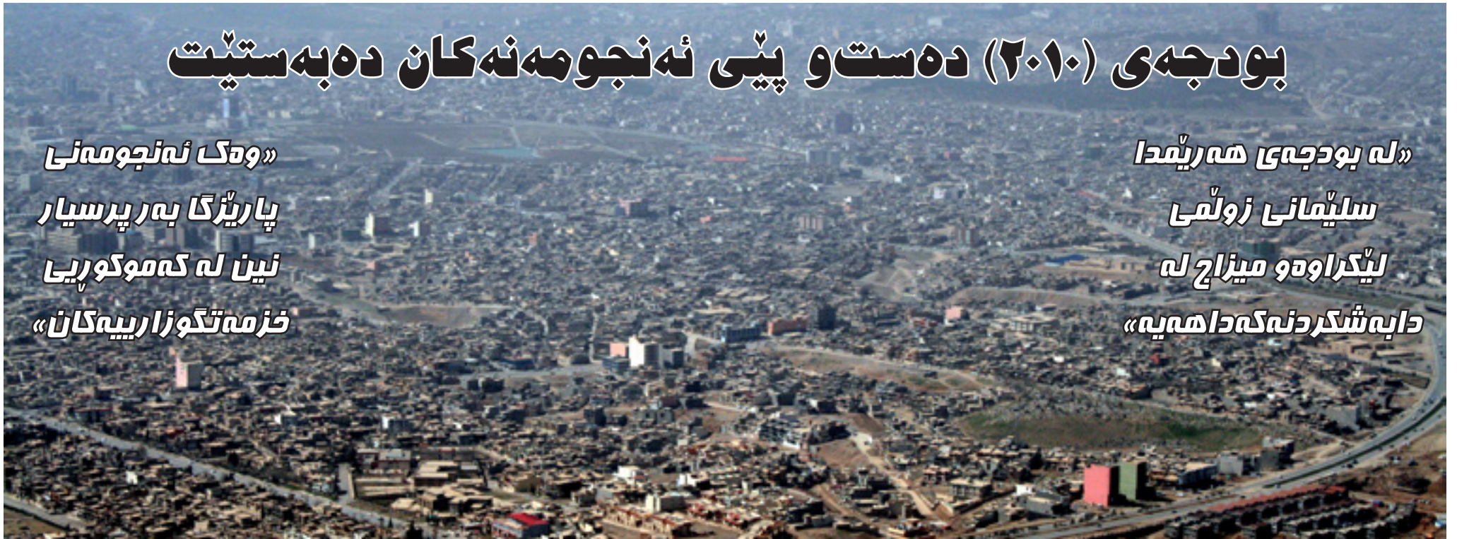
بودجه زه‌به‌لا‌حه‌که له‌چیدا خه‌رجده‌کریت؟

«ووک له‌نجومه‌نی پارێژگا به‌ر پرسیار نین له‌که‌موکوری خزمه‌تگوزارییه‌کان»