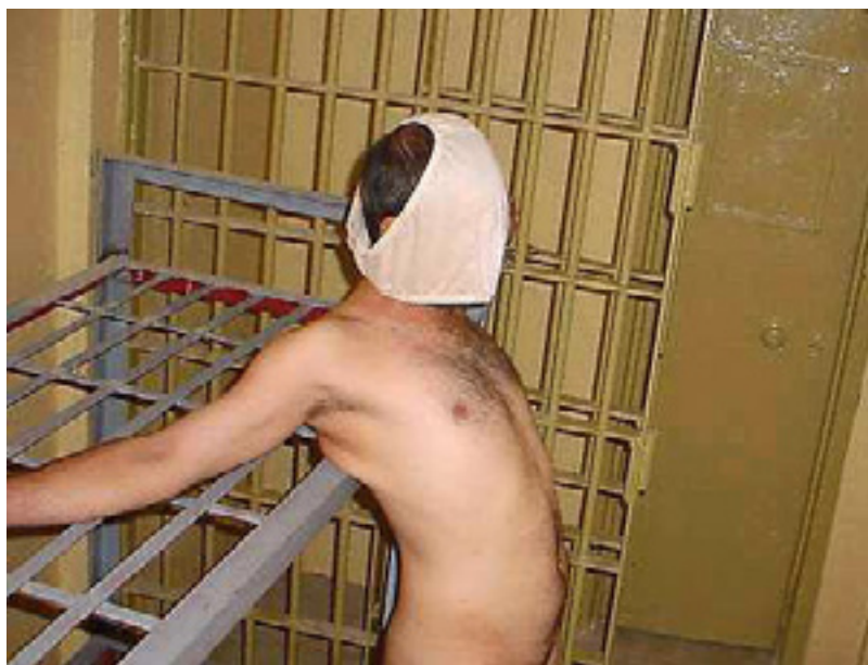
ئەشکەنجەدانی زیندانەکان لە کاتی لیکۆلینەوهدا

بکەن و هیچ بەلگەنامەیهکی رەسمیی دەستگیرکردن و دۆسیەی لیکۆلینەوهیان بۆ دروست نەکراوه و ئەو دادوهرەشی که لە دۆسیەکانی روانیوه، لە نزیک شۆینی ئەشکەنجەدانهکانیانەوه نزیک بووه. داوی ئەوهی رۆژنامە لۆس ئەنجلس تایمزی ئەمریکی بۆ یەکەجار لە (١٩)ی نیساندا لەسەر ئەو پیشلکارییی نووسی، حکومەتی عێراقی راگەیاند، لیکۆلینەوه لە دۆسیەکه دەکات و سێ ئەفسەری سوپای عێراقی به تۆمەتی دەست هەبوون لەو رووداوه نابرووچەردا دەستگیرکردوو.