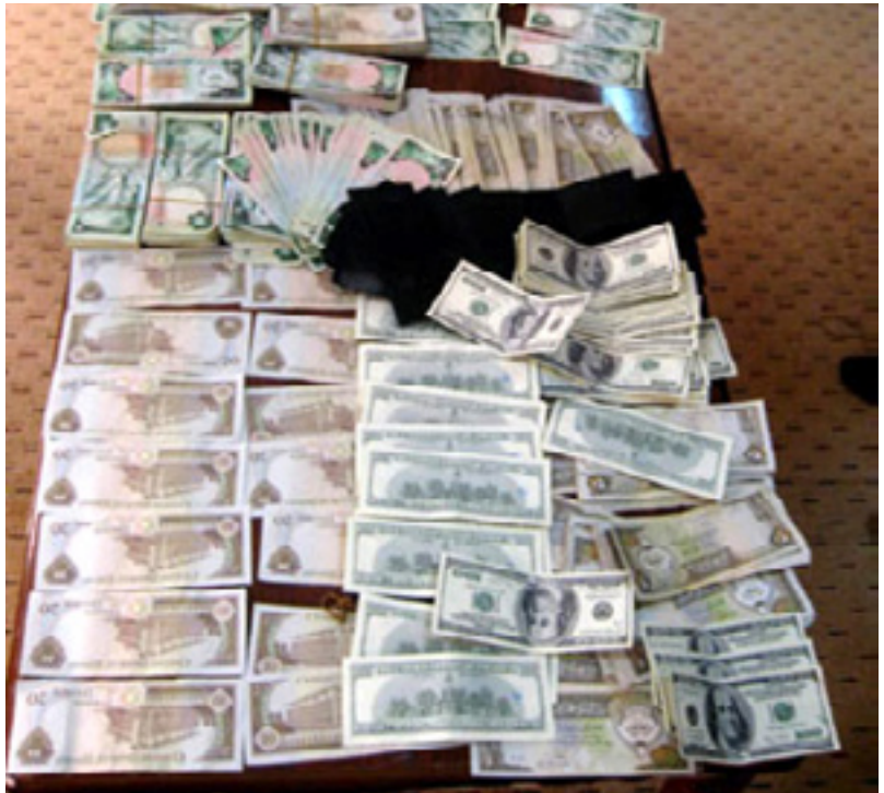
ژماره‌یه‌که‌ دراوی ساخته‌ی ده‌ستبه‌سه‌رداگیراوه

نه‌مه‌ش دووم وه‌جبه‌ی ده‌ستبه‌سه‌رداگریتی گۆشت بووه له‌م مانگه‌دا که له‌لایه‌ن هیزه‌کانی ئاسایشی سلیمانی‌وه ده‌ستی به‌سه‌رداگیراوه، پاش ئه‌وه‌ی له‌ رۆژی (۱۱/۴/۲۰۱۰) دا هیزیکی ئاسایش، توانی له‌ ناوچه‌ی شیزکۆزی نزیک به‌نداوه رووخاوه‌که‌ی سه‌رچنارو له‌مالیکدا (۳) تۆمه‌تبار به‌ تۆمه‌تی بازرگانیکردن به‌ گۆشتی هاوردی هیندی به‌سه‌رچوووه به‌ناوه‌کانی (د.ع)، (د.ع)، (أ.ع) ده‌ستگیر بکه‌ن.