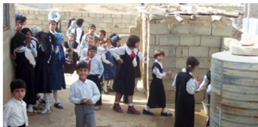
قوتابخانه‌ حکومییه‌کان کرێچی و ئه‌هلییه‌کانیش خاوه‌ن مال

خانویه‌کمان بده‌وه‌ که تیایدا بژین. ره‌زا محهمه‌د ته‌لانی، قایمقامی پینچوین، سه‌باره‌ت به‌ لابردنی گونده‌که‌ به‌ روژنامه‌ی راگه‌یاند: «قه‌ره‌بووی ماله‌کان و خاوه‌ن دوکان و بارخانه‌کان ده‌که‌ینه‌وه، به‌ پێی بیناقه‌ره‌بووده‌کرینه‌وه، بۆ ئه‌و مه‌به‌سته‌ش لیژنه‌ی دارایی