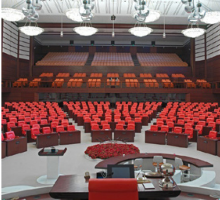
پەرله مانیه تورکيا

پەرله مانیه تورکيا مشهور له سەر ټو ريفورمه دستورويانه دهکات، که (ټکه په) پيشکته شى کردووه ټه مش مشتمريکي زوری له نيوان هيزه سياسييکانو هاولاتياني ټو ولاته دا دروستکردووه، بهراده يک پارتکته ټو ټوړوځان سکالای خوی له (جهه په) (ټوپوزسيون) له پەرله مانیه ټوړوځا توماردهکات، به لام له مکاته دا ټوړوځان داوايکي کونی خوی زيندوودهکاته ټو بۇ گورپنی سيستمی تورکيا بۇ سەر وکایه تی.