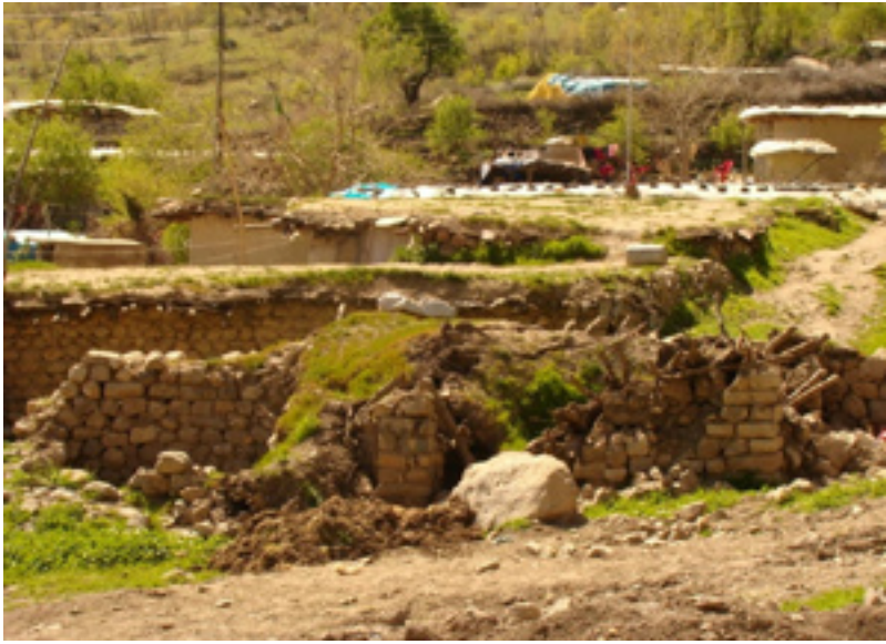
گوندنشینه کان ناتوان چتر له گوندنه کاندایمینه وه