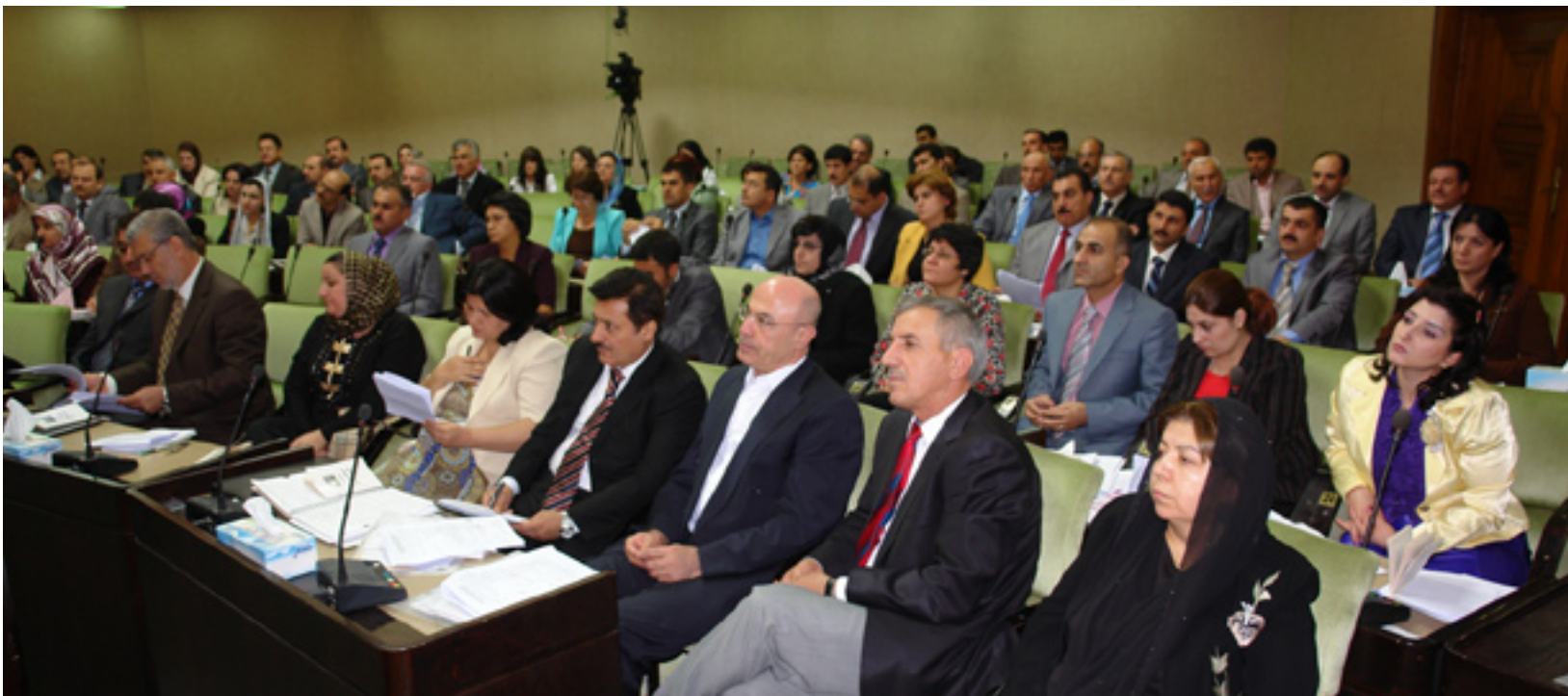
دانیشتنێکی په رله مانی کوردستان

چاودێرانی سیاسی، پسروری ئایینی، په رله مانتاران، خۆیان جهخت له سهر بهرپرسیاریتی ئایینی، یاسایی، وێژدانیی و کۆمه لایهتی ئه وه که سانه دهکهن، که بریاره دهدهن «نۆینه رایه تی خه لک» بکن. ئەندامانی هۆله بچوکه کهی په رله مانتار له نیوان خواستی حیزبو و گرووپه کانیان، له کۆنیدا بیریان دهکوه و ئه وه سهر بهرۆه وهندی جوگرافیا فراوانه کهی ههریمی کوردستان. (111) په رله مانتاره کهی کوردستان، ئه که چی به لیستی داخراو بهشاری و کینیرکی هه لێژاردنیان پیکراوه، به لام دواچار به دهنگو متمانهی خه لک رهوانهی هۆلی نۆینه رایه تی خه لکی کوردستان کراون. ئه وه خه لکه به ژماره زۆره چاوه رێ ئه وه که سانه یه، که له نیوان بهر داری بهرۆه وهندی حیزبو و گرووپه سیاسییه کاندایه بهرۆه وهندییه کانی ئه وان نه هارن، له م راپۆرتدا بۆچوونی جیاوازی له وه رووه ده خه رتیه روو: هه ن پێناوایه به هۆی لیستی حیزبیه وه که سایه تی په رله مانتاره کانی له ناو بۆته ی بهرۆه وهندی حیزبیدا ده وتیته وه، په رله مانتاره کانی هه رچهنده له هه ولی بهرگرکردن له خۆیان، به لام له کاریگه ریی ئاراسته سیاسییه کانی ده رباز نابن، ئه وه ی له و نۆینه وهندا نازانرێت ده شکیزیت، یان ناشکیزیت ئه وه سوینده یه به رامبه ر خه لک ده خوریت!