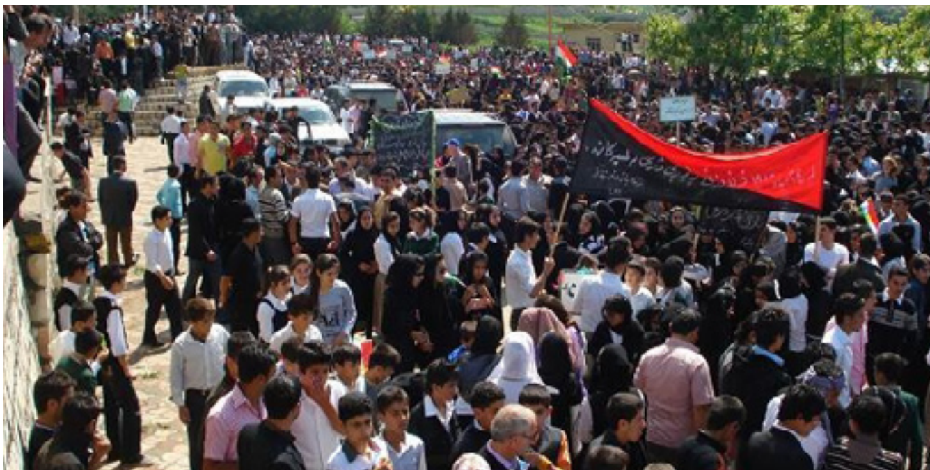
مه‌راسيمي يادكرده‌وه‌ي بۆردوماني قه‌لادزي ۲۰۱۰/۴/۲۴