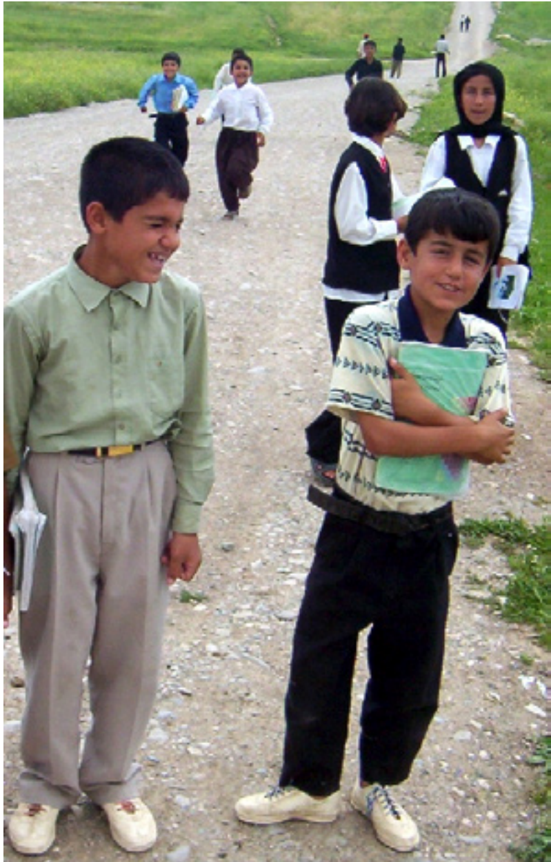
سه‌دان قوتابی له‌به‌ر نه‌بوونی خویندنگا به‌ پێ ده‌چن بۆ دێیه‌کی تر

پلانی درێژخایه‌نی هه‌بێت بۆ نه‌هه‌شتی نه‌خوینده‌واریی و ده‌رگا بۆ ئه‌و که‌سانه‌ بکریته‌وه‌ که‌ بواری خویندنیان نه‌بووه‌ خویندنگای تایبه‌تیان بۆ بکریته‌وه‌ و هاوکارییان بکریته‌. هه‌رچه‌نده‌ ئاماژه‌ به‌ هه‌وله‌کان ده‌کریته‌ بۆ نه‌هه‌شتی نه‌خوینده‌واریی و ریڤکراوی یونسکو له‌سالی (٢٠٠٢) وه‌ پلانی بۆ به‌رنامه‌ی نه‌هه‌شتی نه‌خوینده‌واریی له‌ عێراقدا داناهه‌، به‌لام به‌هۆی که‌می بینا و ئاسته‌نگه‌کانه‌وه‌ نه‌توانراوه‌ هه‌وله‌کان وه‌ک پێویست بخریته‌ بواری جێبه‌جێکردنه‌وه‌ و ته‌واوی گه‌نجه‌ نه‌خوینده‌واره‌کان لێی سوودمه‌ندن. هه‌رچه‌ندێک له‌ ئێستادا (٣٠سال)، به‌هۆی نه‌بوونی بینای خویندنگه‌وه‌ له‌ نزیک شوینی نیشته‌جێبوونیان له‌ خویندن بیه‌شبووه‌، ئه‌وه‌ش ئاسته‌نگی بۆ دروستکردنه‌وه‌ که‌ به‌رده‌وام له‌ ماله‌وه‌یه‌ و وتی: «به‌وه‌ هۆیه‌وه‌ زۆر بێزارم، ئه‌گه‌ر ئیستاش هه‌لی خویندنه‌ بۆ بره‌خسێت ده‌خوینم، به‌لام ئه‌و خویندنگایه‌نی لێمانه‌وه‌ نزیکن هه‌چیان پرۆسه‌ی نه‌هه‌شتی نه‌خوینده‌وارییان تیدا نییه‌، بۆیه‌ نه‌توانیوه‌ سوودمه‌ندبم.» له‌باره‌ی ئه‌و گرفتانه‌شه‌وه‌ به‌رپوه‌به‌ری فیڕکردنی ناناسایی، که‌ کاریان ئه‌وه‌یه‌ له‌ رێی راهێنان و خوله‌وه‌ ئه‌و که‌سانه‌ بۆ خویندن بگه‌رێنه‌وه‌ که‌ له‌ خویندن دا‌ب‌راون، باس له‌وه‌ ده‌کات، که‌ پێویستییه‌کی زۆریان به‌ بینای قوتابخانه‌ هه‌یه‌ له‌ناو شارو قه‌زاو ناحیه‌و گونده‌کاندا، بۆ ئه‌وه‌ی به‌رده‌وامبو و سوود به‌ زۆرتین ناوچه‌ بگه‌یه‌ن، وتیشی: «پرۆگرامه‌کانی ئیتمه‌ هه‌ی خویندنی ئاساییه‌ و پێویستی به‌ بینای خویندنگه‌ هه‌یه‌، به‌لام تانیستا ئه‌و پاسایه‌ش جێبه‌جێکردنه‌وه‌، که‌ ده‌لێت ده‌بێت خویندکار به‌ناچاری تا (٦) ی بته‌رته‌ بخوینت.»