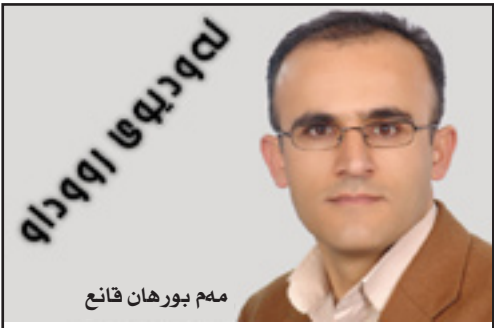
مهم بورهان خانان