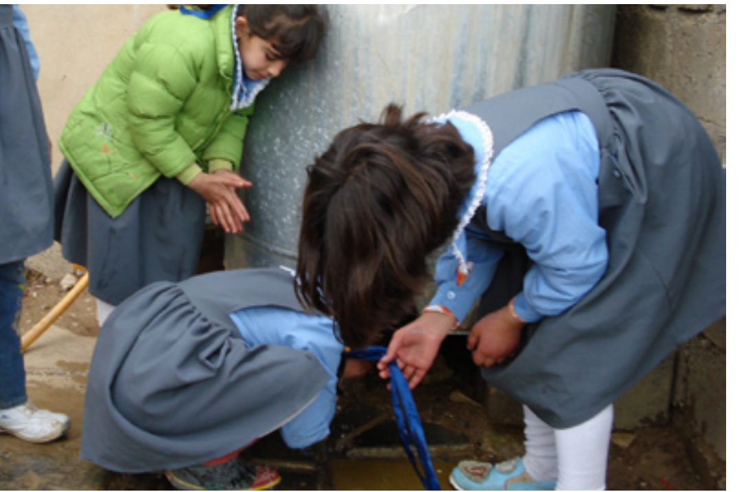
خو ينده گان به ده ست خرا يي سيستم ي ټاو و ټاوه رو وه ده نالين