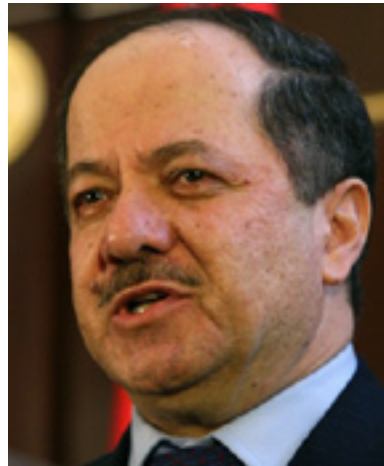
مه سعود بارزاني