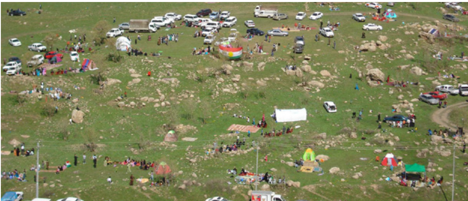
حكومەتى ھەرىم ھىچ رۇلىكى نىيە لە دروستكردنى سەيرانگاگان و سەيرانگاگان سىرووشتىن

راپورتى: ئەھمەد بالەكەي والى عوسمان، لاڧە بەشارەت