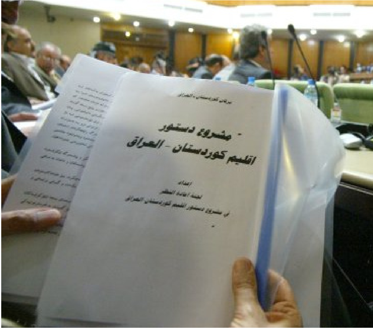
دەستوری ھەریم بەرھو کوئ دەگات؟

لیستە ئۆپوزسیونەکانی پەرلەمانی کوردستان ھاوێران لەسەر ئەوەی کە پەرۆژە رەشنووسی دەستوری ھەریم کەموکوورپی تێدا و داوا دەکەن بگەڕێنرێتەو بۆ پەرلەمان بۆ دووبارە قسەکردن لەسەری و دواتر بخریتە ریفراوندو. پەرۆژە رەشنووسی دەستوری ھەریمی کوردستان لە (۲۰۰۶/۸/۲۲) ھو بە پەرلەمانی کوردستان ئامادەکراو خرای بەر دەستی رای گشتی خەلکو یاسانسانو شارەزایانی بواوی دەستوری و ریکخراوەکان و حیزبو لایەنە سیاسییەکان و تا ناوەرستی سالی (۲۰۰۷) پێشینیازی لەسەر وەرگیرا، دواتر لیژنەیکە کاتی بەناوی لیژنە پێداچوونەوی دەستور لە پەرلەمانی کوردستان پیکھینرا بۆ لیکولینەو لەو پێشینیازو سەرنج و تێبینیانە لەسەر دەستورە کە ھەبوو، بەلام ئەو پەرۆژە وەک خۆی مایەو ھەتا خولی دووھمی پەرلەمان، لە ماوھە بەسەرچووی خۆیداو لە رۆژی (۲۰۰۹/۶/۲۴) دا دەستوری ھەریمی پەسەندکردو داوای لە کۆمسیون کرد، کە راپرسی لەسەر دەستور لەگەل ھەلبژاردنی پەرلەمانو سەرۆکایەتی ھەریمدا ئەنجامبدا، بەو ھۆیەشەو نەرەزاییەکی توند لەناو چین و توژە حیاچیاکانی کوردستانا سەریبەلدا، لە ئیستاشدا ھەرسێ لیستە ئۆپوزسیونەکی ناو پەرلەمانی کوردستان داوای گەراو تەو ئەو پەرۆژە بە دەکەن بۆ گتوگۆکردن لەسەری.