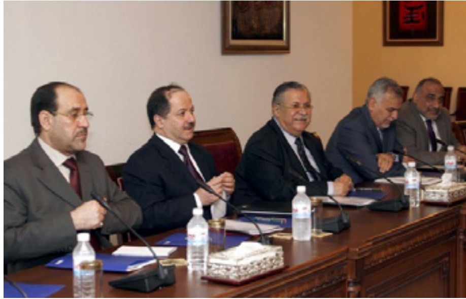
لیسته‌کوردیه‌کان له‌ نیوان عێراقیه‌و لیسته‌ شیععه‌کاندا

یان لیستیکی دیکه‌ی هاو‌په‌یمان ده‌نیشته‌وه‌، ئەوه‌ی گرنگه‌ کورد له‌نیوان هه‌ردوو لیستی سه‌رکه‌وتوودا جوړیک له‌ ته‌حه‌فوزو هه‌لوه‌سته‌کردنی هه‌یه‌. له‌وباره‌یه‌وه‌، ده‌محمود عوسمان که‌ خۆی به‌وردی ئاگاداری خیلافو کێشه‌کانی کوردو پێکهاته‌کانی ئه‌و دوو لیسته‌یه‌ له‌ به‌غدا به‌ رۆژنامه‌ی وت: «ئهو دوو لایه‌نه‌ هه‌ریه‌که‌یان ئیجابیه‌ت و سه‌لبیاتی خۆیان هه‌یه‌، که‌ پێوستی به‌ دیراسه‌تیکی جدیی هه‌یه‌، هه‌رچی نوری مایلیکیه‌ ئه‌زموونی چوارسه‌مان له‌گه‌لیدا هه‌یه‌و کێشه‌کانمان دیاره‌، له‌باره‌ی لیستی عێراقیه‌وه‌ ئه‌یاد عه‌لاوی، خۆی خراب نییه‌و ده‌میکه‌ په‌یوه‌ندیمان له‌گه‌لیدا هه‌یه‌، به‌لام له‌ناو لیسته‌که‌یدا کۆمه‌لیک خه‌لکی تێدایه‌، که‌ له‌گه‌ل کورد ریک نینو ریکیش نابن، بۆیه‌ بریاری هاو‌په‌یمانی له‌گه‌لیان قورسه‌و پێوستی به‌گه‌رێ گه‌وێو دیراسه‌ت هه‌یه‌».