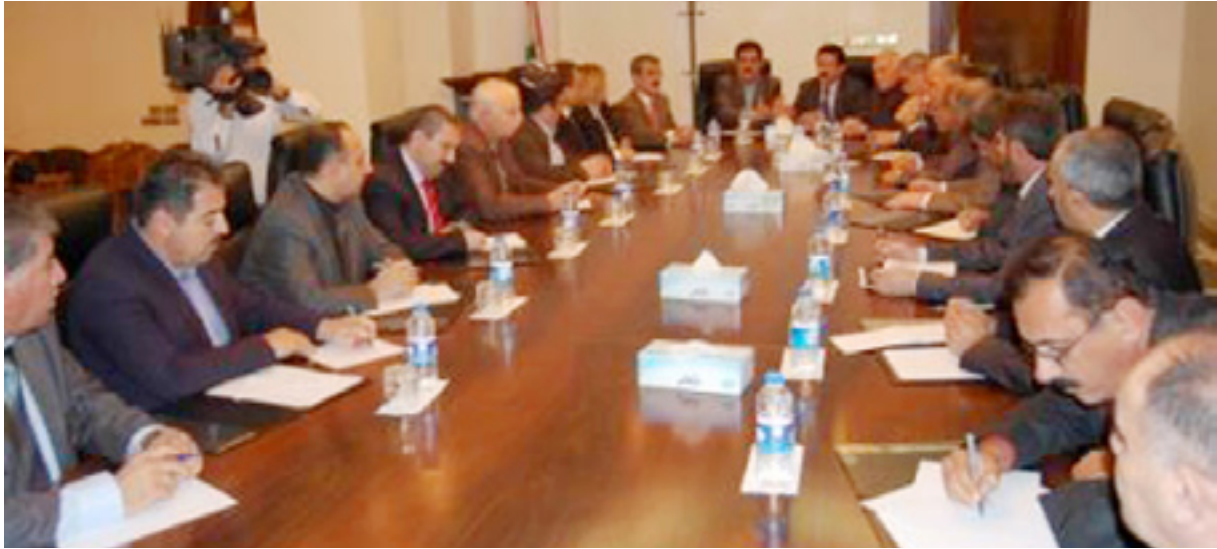
كۆبونه وهى راگه ياندنى لىستى هاوپه يمانى

باوه رى لايهنگه ركانيان به دهستپهيننه وه، چونكه چيتر خه لك نه وه قبوولناكات، كه نه و حيزبانه دوو ناراسته يان هه بئيت، له لايهك ئۆپوزسيون و له لايهك دهسه لات بن».