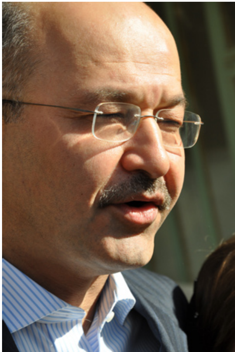
د. بەرھەم ئەحمەد سالج، سەرۇكى حكومتى ھەرېم

دەكرىت چەندىن بىانۋى دىكە رىزىكەين بۇ ئەنجامنەدانى ئەۋ چاوپېڭە وتە، بەلام بۇئەۋەى بىانۋەكان زۇر نەين، دەكرىت سەرۇكى حكومت بە فىعلى بەلېنى چاوپېڭە وتەكە جىبەجىبىكات و پىردى پەيۋەندى دىروستىكاتەۋە.