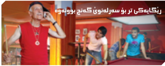
رینگایهکی تر بۆ سههر له نوێ گهنج بوونهوه