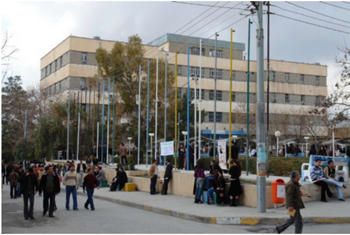
دېمەنېك لە زانكۆى سلېمانى

زانكۆكانى دىكەى دووپاتكردووہ، بەلام بەشيوہىەكى سەپرترا! وەك وتى: «گرفتى زۆرىي ژمارەى ئەو خەلكانەمان ھەيەكە حيزب بەناو و بەرگى مامۇستاي زانكۆ لە زانكۆكاندا جيگيرىكرودون».