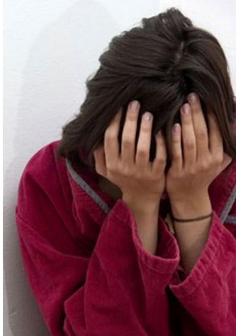
ده‌سه‌لآت سووکایه‌تی به‌ ژنان ده‌کات له که‌رکوک

به‌رپرسانی سهر‌بازی پارتی به‌ناوی (پ.ع)، هاوسه‌ری ئه‌و ژنه‌ی ده‌ستدریژی کراوته‌سهر، له مه‌له‌ندی یه‌کیتی له که‌رکوک ده‌وام ده‌کات و ده‌یکه‌رته‌وه «رۆژیکان دوا‌ی ته‌وا‌بوونی ده‌وام، رۆشتمه‌وه ماله‌وه‌و ژنه‌که‌مم بینه‌ی ده‌گیا‌و ره‌نگی تیک‌چوو‌بو، پرسیارم لیک‌ر، چی بو‌وه، بۆ ده‌گرت، وتی: شتیکی بو‌وه، ئه‌گه‌ر باسی بکه‌م هه‌ردوو‌کمان ده‌کوژن».