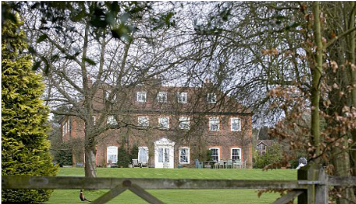
قۇياكەي ناشتى ھەورامى بەھاكەي (۴) مىليۇن پاۋەندەو لە گوندى فاولى لەسەر سنورى بويىنچا شاپرو ئۇكسۇفورد شاپر

ئەو دەلىت: كە ئەوان ئاگادارى ئەو بوون، كە ئەو كۇمپانىيە پروژەي زۇرى لە كوردستاندا ھەيە، بەلام لە پەيۋەندى ئەو كۇمپانىيە تۇنى بلىر ئاگادار نەبوون، ناشتى ھەورامى ئامادەنەبوو ۋەلامى پرسىيار بىداتەو لەبارەي لىكۇلنەۋەكەي.