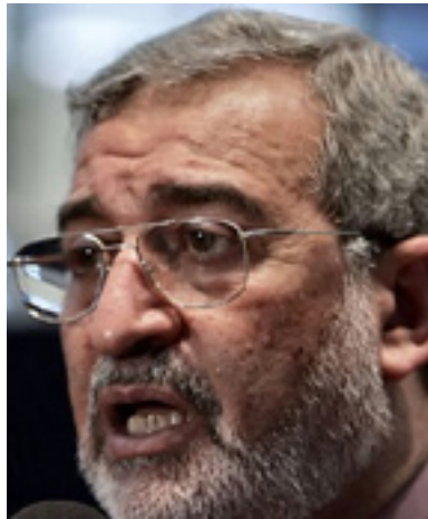
ئه ياد سامه رايي