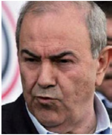
ئه ياد عه للاوي