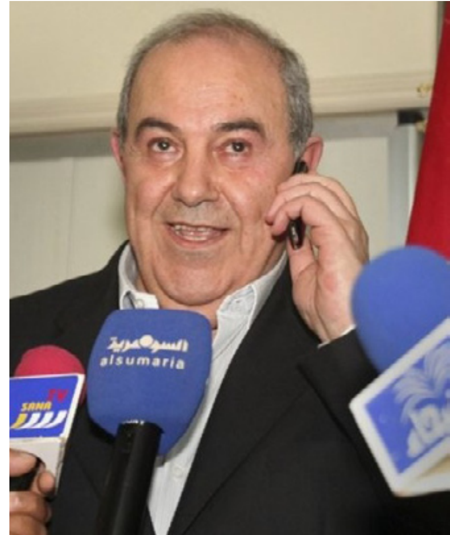
ئه‌یاد عه‌لاوی له‌ کۆنگره‌یه‌کی رۆژنامه‌وانیدا دوا‌ی راکه‌یاندنی ئه‌نجامی هه‌لبژاردنه‌کان

پاش چه‌ندین هه‌فته‌ له‌ ململانی سیاسی، گومان له‌وه‌دا نییه‌ عه‌لاوی، که پزیشکی ته‌مه‌ن (٦٥) ساله‌، هیزیکی له‌ پشته‌وه‌ هه‌یه‌، ئه‌م گه‌رانه‌وه‌یه‌ سێ ساڵ له‌مه‌په‌یش به‌هه‌چ جۆریک چاوه‌ری نه‌ده‌کرا، کاتی‌ک عه‌لاوی له‌ رووی سیاسییه‌وه‌ وه‌ک رابردوو سه‌یری ده‌کرا، عه‌لاوی نمونه‌ی حوکمه‌تیکی ناچالاکو گه‌نده‌لی پێشکه‌ش به‌ دیموکراتیه‌ تازه‌که‌ی عیراق کرد، کاتی‌ک سەرۆکایه‌تی یه‌که‌مین حوکمه‌تی دوا‌ی سه‌دامی له‌عیراقدا کرد، وه‌ک بژاره‌یه‌کی ئه‌مریکا، شه‌قام له‌گه‌لی نه‌بوو، وه‌ک پیای به‌هیزی دیموکراسی خۆی ده‌رخست و پێچه‌وانه‌که‌ی ده‌رکه‌وت، که ژماره‌یه‌کی که‌م له‌ هاو‌لاتیانی رازیکرد. هه‌رچه‌نده‌ شیعه‌یه‌، به‌لام زۆریه‌ی له‌خۆی تۆران‌دووه‌ به‌ ته‌به‌نیکردنی دیدگایه‌کی عه‌لمانی بۆ عیراق، زۆریک له‌ عیراقیه‌کان گومانیان له‌بوونی په‌یوه‌ندیی عه‌لاوی هه‌یه‌ به‌ حیزبی به‌عسی سه‌دام حسینه‌وه‌، هه‌رچه‌نده‌ عه‌لاوی، له‌ سالی (١٩٧٥) دا ئه‌و حیزبه‌ی جیه‌په‌شتو له‌ هه‌لو‌یکی تیرۆکردن، که له‌لایه‌ن دیکتاتۆره‌وه‌ دارپێژابوو، رزگاری بوو. کاتی‌ک له‌ کۆتایی سالی (٢٠٠٥) دا هه‌لبژاردن بۆ حوکمه‌تی گواسته‌وه‌ ده‌کرا، عه‌لاوی له‌لایه‌ن حیزبه‌ دینییه‌ شیعه‌کانه‌وه‌ به‌ ئاسانی تووشی دۆران بوو، عه‌لاوی به‌مه‌ دپۆنگ بوو، هه‌رچه‌نده‌ ئه‌ندامیکی