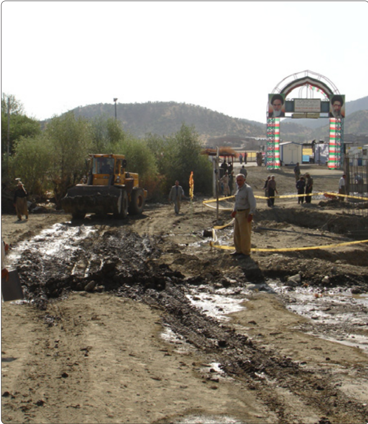
باشماخ، لەو رۆژەو ھەک دەروازەى رەسمىی ناسراو، بیکیشە نەبوو

لەگەڵ ئەو ھى مەرزى باشماخ خالیکی ئۆتۆمبیلەتیپەو رۆژانە بەسەدان تەن کالایى جۆراوچۆرى لێو دەھینریت بۆ ھەریمی کوردستان و بەپێچەوانەشەو، چاودێرانى ئابوورییش، ئەم مەرزە بەسەرچاوەیکى بەھیزی ئابووری ھەریمی کوردستان دادەنن، کە لەئێستادا فشاریکی زۆرى لەسەرەو حکومەتى ھەریمی کوردستانیش تا ئێستا نەیتوانیو پلانیکى مۆدێرن و باش بۆ ھاوچۆکردن و بواری بازرگانى داھینت، کە رێگای مەرزى باشماخ بۆ پینجوین تەنیا (٨ کیلومەترەو) نەبوونى خزمەتگوزاریی، نارەزایى لای سەدان شوڤیری ئەم مەرزە دروستکردووە.