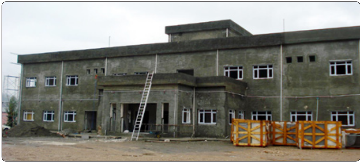
ئەو نه‌خوشخانه‌یه‌ی چوار قه‌زا چاوه‌روانییه‌ی

قه‌زاکانی سۆران و میزگه‌سوور و رواندزو چۆمان، چاوه‌روانی ته‌واوبوونی نه‌خوشخانه‌ی له‌دایکبوونی سۆران، ئەگه‌رچی له‌سه‌ر بودجه‌ی پارێزگای هه‌ولێر له‌سالی (2008) ده‌یه‌بری (7,112,430,300) سه‌ه‌ت ملیار و سه‌ه‌و دوازه‌ ملیون و چوارسه‌ه‌و سه‌و پینچ هه‌زارو سه‌یسه‌د دیناری بۆ ته‌رخانکراوه، به‌لام تا ئیستا نه‌خوشخانه‌که ته‌واو نه‌بووه له‌ واده‌ی خۆی دواکه‌وتوه.