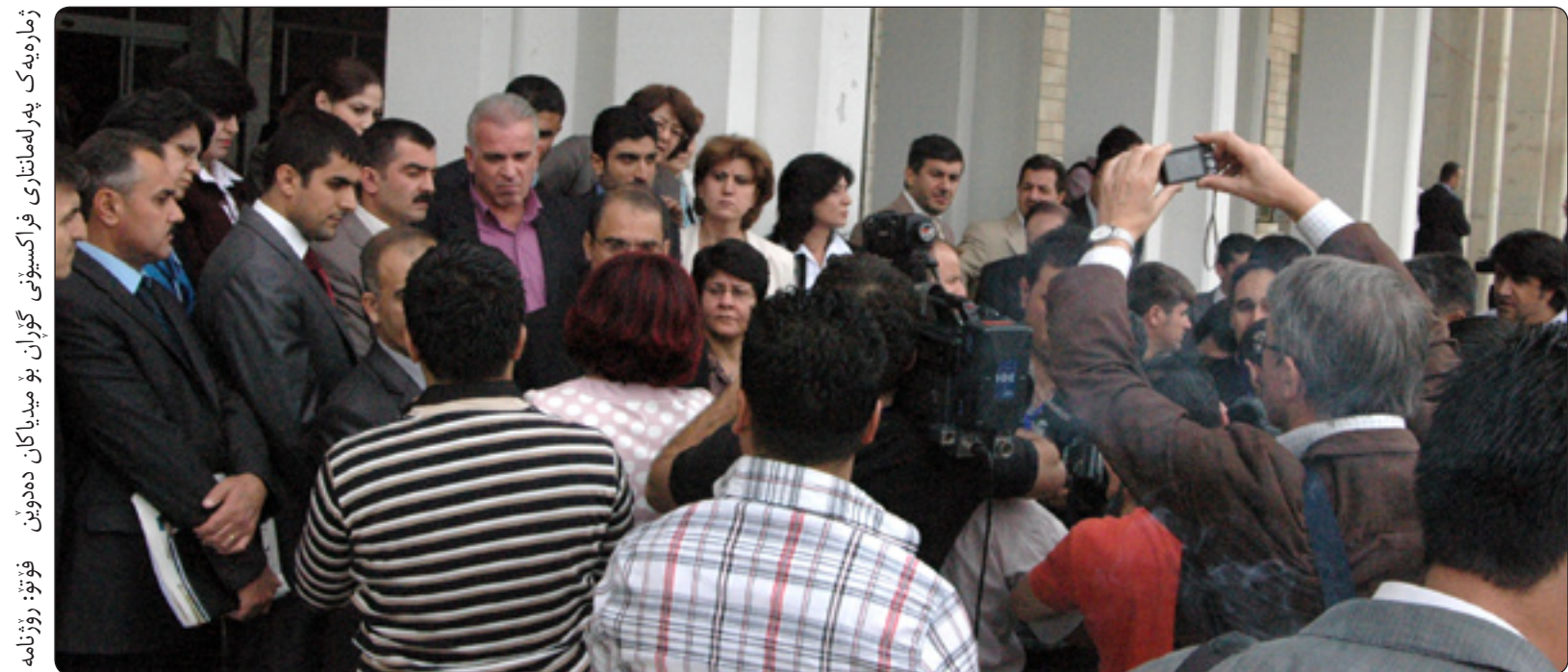
ژماره یه ک په رله مان تارکی فراکسیونی گوران بۆ مه دیاکان ده دن. قوت: روژنامه

وته بیژی لیستی کوردستانی پیبویه؛ سه ره رپای شه وه ی یه ک حکومه تی یه کگرتومان هیه و یه ک په رله مانمان هیه، هیشتا ئاسه واری بچوکی شه ری ناوخو ماوه، بۆیه شه و ده زگایانه یه کته خراونه ته وه، له به رنه وه پیویسته هه ر دوو دیوانی چاودیری دارایی و هه ر دوو ئاسایش یه کخرینه وه».