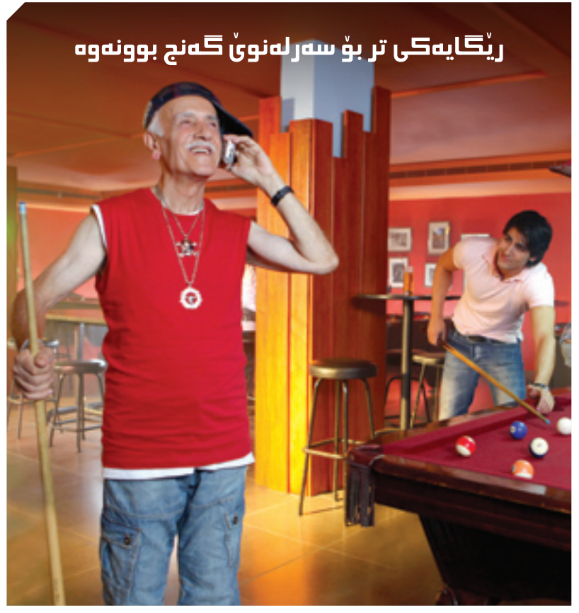
رینگایهکی تر بۆ سههر له نوێ گهنج بوونهوه

له گه ل دروستبوونی مملانی له نیوان یه کیتی و پارتی له سههر دیاریکردنی پۆستی جیگری سه روکی هه ریم، په رله ماناران به نیازن پروژە یه ک پێشکه شی سه روکیه تی په رله مان بکن، به مه به ستی هه لوه شانده وه ی هه ردوو پۆستی جیگرانی سه روکی حکومه ت و