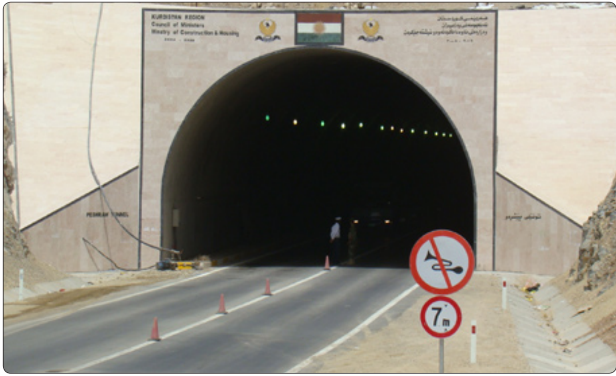
تونیلی پیشره، که برپاروو له ماوه ی ۳۰۰ رژدا ته واوبکړیت

بری (۸) ملیون دواډی بو سیستمی ههواگورکی و ناگرکوژاندنه وه کارهبا له تونیلی پیشره و ته رخانده کړیت نه نداز یار یکیش جگه له وهی له نیستادا پر ژمه که به پیوست نازانیت، رایدمگه یه نیت؛ «نهدیوو پر ژمه که به و شوپوه بکرا یه ته وهو به کار به یئرایه، چونکه نه وانه به شی سهرمکی پر ژمه که ونه که گهر به و شیوه ی نیستا رو دواډی کی تیدا بکه و یتوه هه مو و نه و که سانه ی تیدان، دهنه هوربانئی».