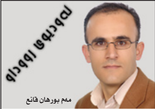
مهم بورهان حههجان