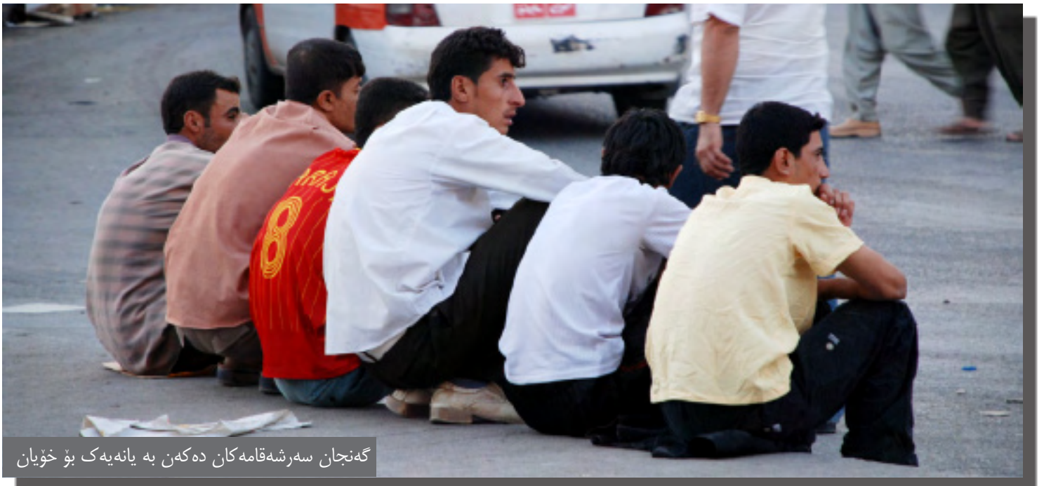
گه نجان سه ره شه قامه کان ده که ن به یانه یه ک بو خویان