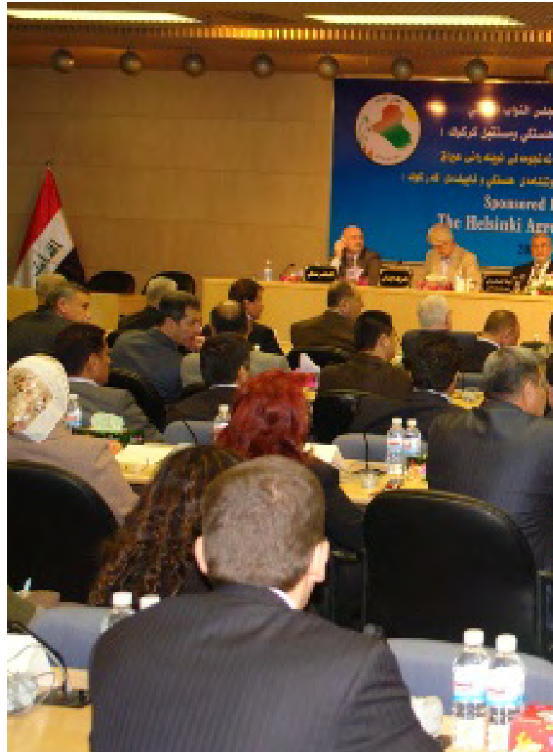
کۆنگره‌ی نیشتمانی که‌ركوك به‌غدا ۱۹-۲۱/۱۱/۲۰۰۹

بهنه‌ماکانی ریکه‌وتنه‌نامه‌ی هلسنکی له (۱۷)به‌ند پیکهاتوه‌وه‌ مانگی ئایاری سالی (۲۰۰۹) له‌ لایه‌ن (۲۲)ئەندامی ئەنجومه‌نی پارێزگای که‌ركوك‌وه‌ له‌ کۆی (۴۱)ئەندام‌ئیمزاکراوه‌وه‌ پیکهاتوه‌ له‌ پابه‌ندبوون به‌ یه‌کێتی خاکی عێراق و ده‌ستوروو کارکردن بۆ هه‌موارکردنه‌وه‌ی ده‌ستور به‌په‌ی به‌نا په‌سه‌ندکراوه‌کان و پابه‌ندبوون به‌ رێگاچاره‌کانی ئاشتی و دیموکراتی و پابه‌ندبوونی هه‌موو لایه‌نه‌کان به‌ ئەنجامی دانوستاندن و گفتوگۆکان و پشتمه‌ست به‌ ده‌ست‌اوه‌ستکردنی ئاشتبهنه‌نامه‌ی ده‌سه‌لات و ره‌تکردنه‌وه‌ی ده‌ستپه‌ردانی ده‌ره‌کی و هه‌ریه‌می له‌ کاروباری ناوخو ریزگرتنی مافه‌کانی سه‌رۆق و پاراستنی ئازادیه‌ سه‌ره‌کیه‌یه‌کان و ریزگرتنی که‌مینه‌کان و ریزگرتنی سه‌ربه‌خوایی ده‌سه‌لاتی دادوه‌ری و به‌شداریه‌ی ئازادانه‌ی هه‌موو هه‌یزه‌ نیشتمانیه‌کان له‌ کاروباری سیاسی و لاتا به‌په‌ی به‌نا دیموکراتیه‌یه‌کان و