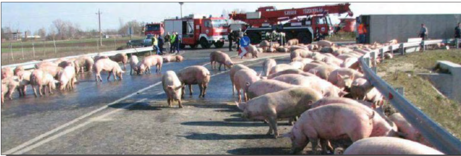
سهنگه جهمال نیان مه جید

نه نفلونزای به راز دووم هاولاتی کورد دکوژیتو ریژو تووشیوانی په تاکه ش بؤ (۲۸) کس به رزدهکاته وه به پرسیانی ته ندروستیش باسله وده که گن که تووشیوانی فایرۆسه که چارسه رگراون.