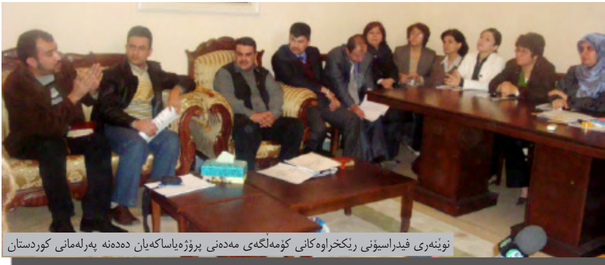
نوښته‌ري فيدراسیونی ريڤخراوه‌كاني كومه‌لگه‌ي مده‌ني پروژة ياسا‌كه‌يان ده‌دنه په‌رله‌ماني كوردستان

نه‌دناماني گروپه‌كه خويانه‌وه ددریټ و مؤلټ وهرده‌گرن و پاره‌دار كردنیشيان به‌پني پروژة ده‌بیت، نه‌ك موچه‌ي مانگانو بو ټو مه‌به‌سته له ياسا‌كه‌دا داوا كراوه سالانه به‌شيك له بودجه‌ي هه‌ريم بو ټو بواره ترخان بكریت.