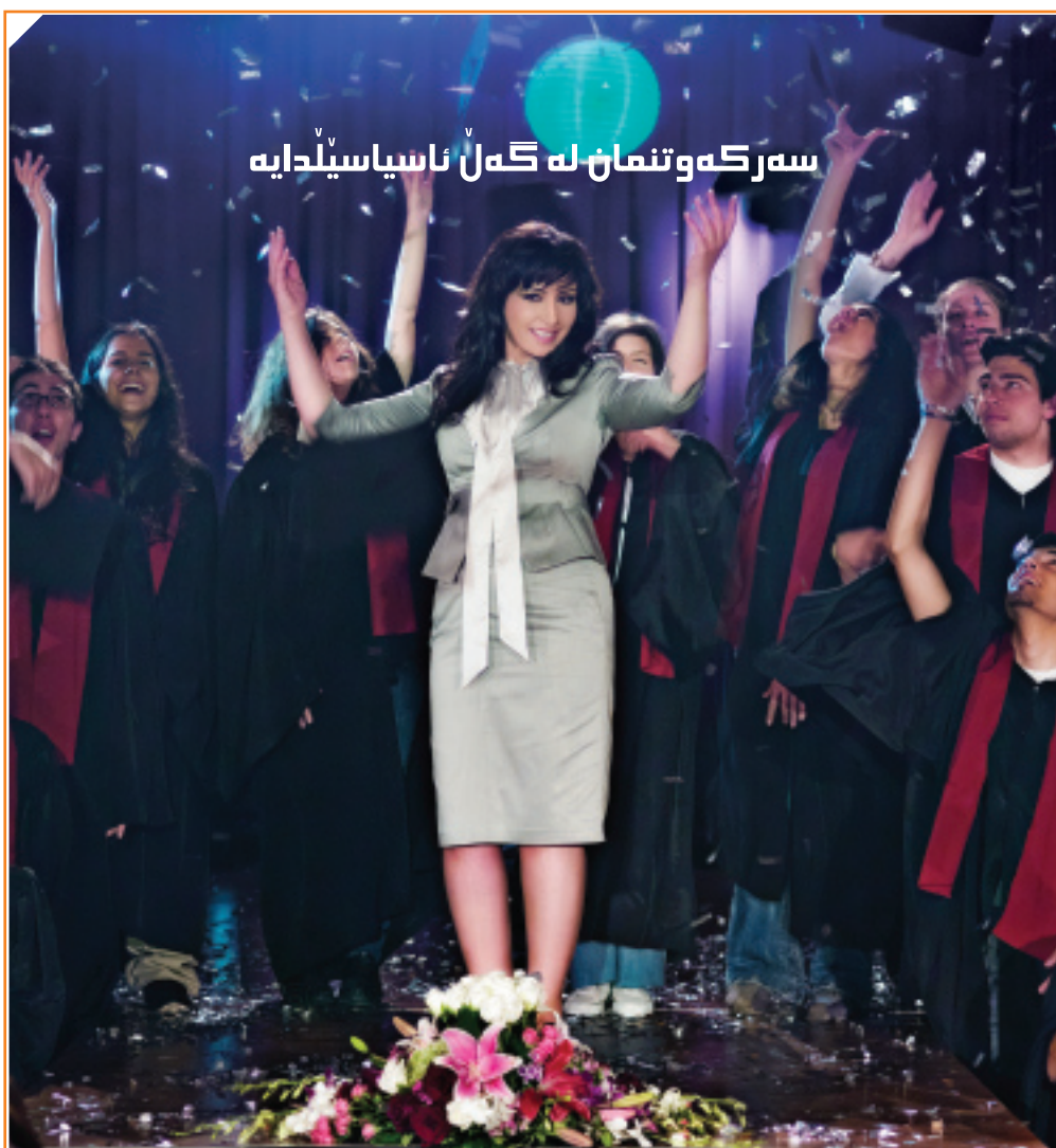
سهر که وتیمان له گهڵ ناسیاسیله

ناسیاسیله کۆمپانیایهکی نیشتمانی پێشتهنگه له بواری پێشکەش کردنی خزمهتگوزاری په یومندیکردن که به بهردوامی کار دهکات بۆ دابینکردنی پیدایهستییهکانی بازار و بهشاربووانی و گهیشتن به ناستی ههموو تازمهگهری و پێشکەوتنهکانی تهکنولوژیا له بواری په یومندی کردن، چونکه باوهری وایه که ئەمه رێگهیهکه بۆ ناساندن و جیگیرکردنی خۆی