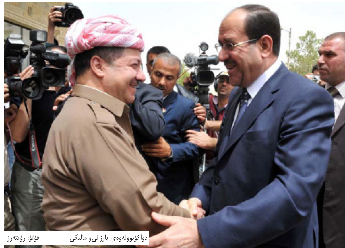
دواکۆبوونه‌وه‌ی بارزانی و مالیکی