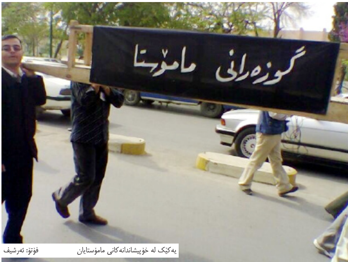
به کیک له خۆپیشاندانه کانی مامۆستایان

فه رمانی له سه ر کارلبردنی شه وه بهرپووه بهر، له ئیواره ی رۆژی (7/27) و دوای دهوامی ناسایی په روه ده دهرچووه وه به بی شه وه ی لیژنه ی لیکۆلینه وه ی بۆ دروستکریت و به بی ئاگاداری که بهرپووه بهرکه خۆشی فه رمانه کی دهرچووه، دواترو دوای شه وه ی که بهرپووه بهرکه له فه رمانه کی ئاگادارده کریت وه، سکالا دنه وسیت و داوا ده کات له ریی لیژنه وه بریاربدریت، نه ک هه روا به هه ره مکی بریاری له سه ر کار لادانی بهرپووه بهرپیک حیزب جیکریت. محمه د ره حیم وتیشی «دوای سکالاکم، له بهرپووه بهرپیتی