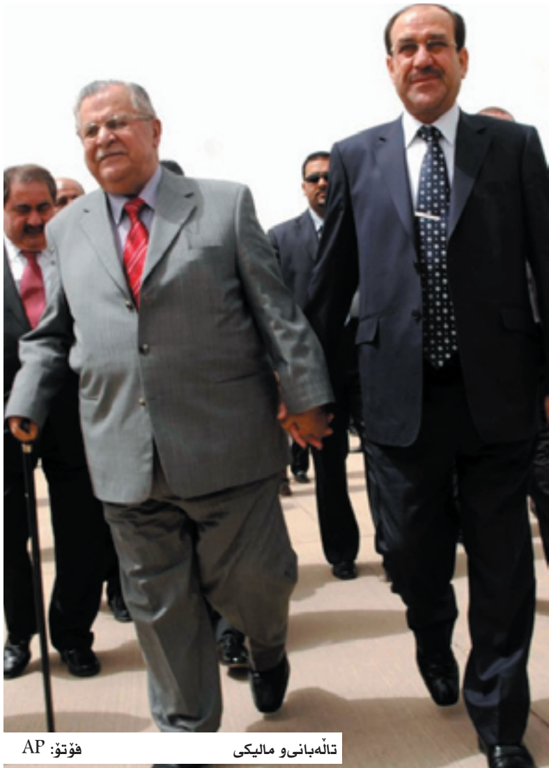
تالەبانی و مالیکی

عەرەب و کورد دەنوسیت، کیشە کیکراوەکانی نیوان کورد و عەرەبی عێراق دووبارە دەردەکەونەو، (زە ناشنال) لەسەر زاری سەرۆک خێلە عەرەبەکانەو دەنوسیت «ئیمە پارێزگاری لە مافی خۆمان دەکەین و بەشداری شەڕەدەکەین و لایەنی سوپای عێراق دەگرین، چی دەبێت با بێت». لە بەرامبەریدا لەسەر زاری کوردەکانەو دەگوازیتهو که «ئەگەر دبلۆماسییەت ئیشینەکرد، دەبێت ئامادە ی ئەرکی پێویست بین، پێموایە خەلکی ئیمە ئامادەیه بۆ ئەم ئەرکەش». بەرزبوونەوی ئەم کیشانە لەپاش دەرکردنی دەستووری کوردستان دیت که کەرکۆکی وەک بەشێک لە هەریمی کوردستان ناساندوو و داوا ی ریفرا ندۆمیش کیشەکانی قولتر کردووتهو، لە کۆتایی راپۆرتەکیدیدا زە ناشنال بە وەرگرتنی رای چەندین کەس ئەو رادەگەیهنیت که دانیشتوانی ئەو ناوچانە دژی هەلگیرسانی شەرن لە ناوچەکیداندا دەیانەو ئیت کیشەکان بە دیالۆگ چارەسەر بکریین.