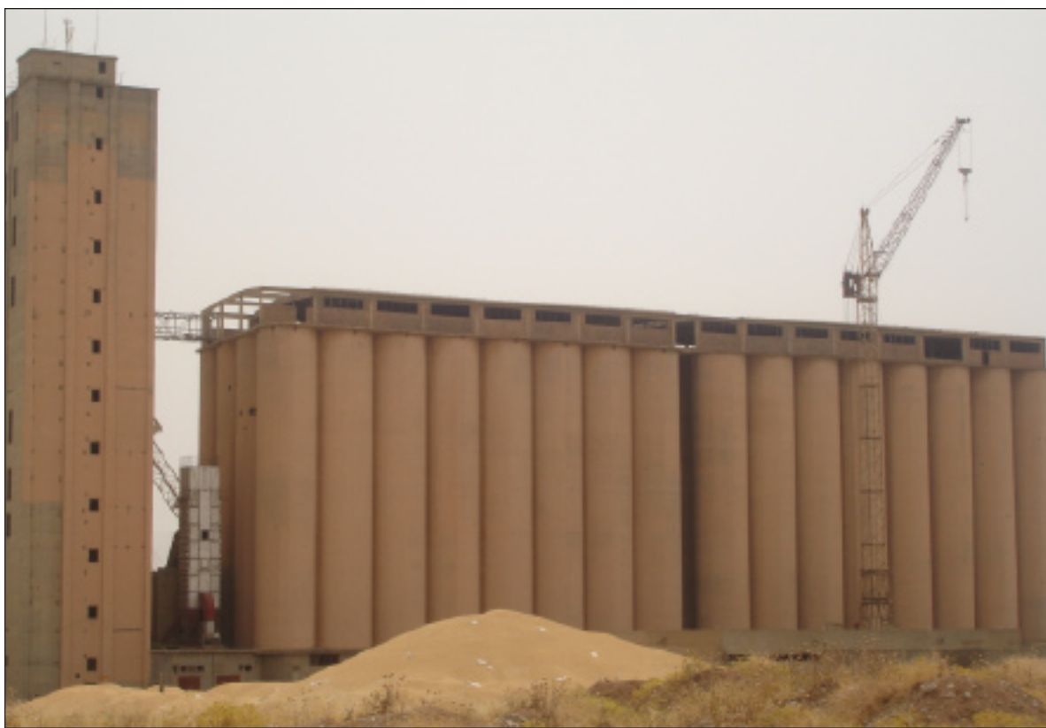
ته سلیم به حکومهت کردوه ته وه، به لام به شیک له جوتیاران نه یان تانویه له کاتی بفرۆشنه وه.» دیاریکردا گه نهم کانیان به حکومهت وتیشی، تائینستا (65) هه زارو (820) تن گه نهمیان له جوتیاران

خالی حه مید، ئاماژه ی به وه دا «تائینستا به شیک زوری جوتیاران به ره مه کانیان