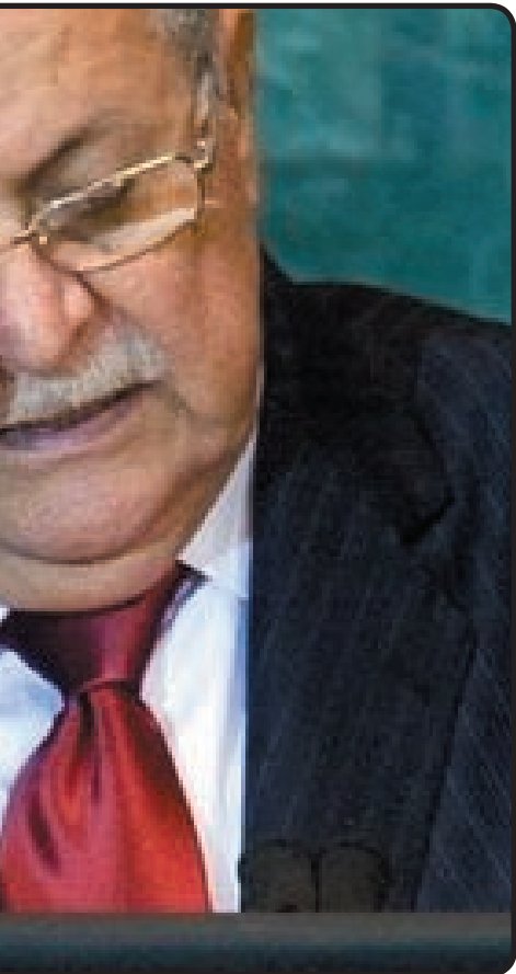
که له سهره وه دسه پیندریت، له بهر نه وه نه گهر شکست هه بیئت دارژدهری سیاسه ته که لئی بهرپرسه، نهک جیبه جیکار، وتیشی: «نه وه کاردانه وهیه یه»

لیستی کوردستانی بوو، به وپیه یه له زوربه ی ناچه کان لیستی ئۆپوزسیون توانویه تی سهرکه وتن به ریژه یه یه بهرچاو به سهر لیستی نه و دو حیزبه دا مسوگه ر بکات، له کاردانه وه ی نه م حاله ته شدا سکرتری یه کیتی چند به پرسیکی مه لبه نده کانی حیزبه که ی نارد وه ماله وه و چاوه ریشده کریت نه م لادانه بهرپرسی هه موو نه و ئۆرگانانه بگریته وه، که له سنوره که یان لیسته که ی تاله بانوی بارزانی دوو چاری دۆرانیکی قورس هاتووه.