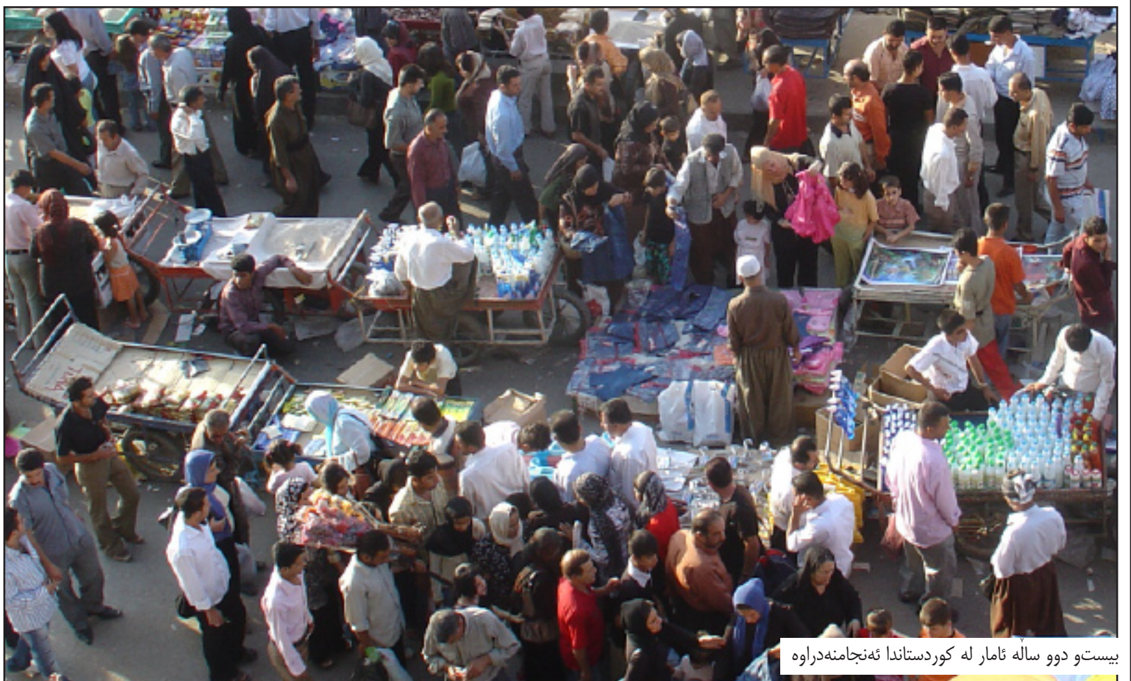
بیست و دوو ساله نامار له کوردستاندا نه نجامده دراوه

بهر یوه به ری ناماری سلیمانی نه پیشارده وه، که ترس له وه هیه سالیکی دیکه شه نه نجامدانی سه رژمییری دواخریت، به تابیته نه گه ر بخریته مانگی نیسانی (2010) به وپینه ی که هه لیزارنه کان واده کات نه توانریت سالی داهاتووش نه نجامداریت، «چونکه چند هه لیزاردنیک ده کرایت و حکومتی نوی پیکه هینریت، نیستاش بریار ی کوتای نه دراوه له وهی سه رژمییرییه که بو سالی نایند دواخریت و توپه که له گورپانی نه جومه نی وه زیرانی عیراقیه».