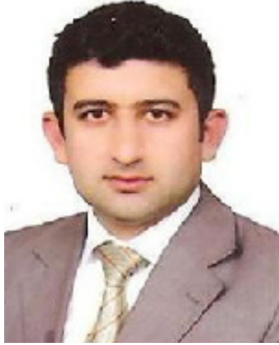
عه بدولر لامحه مه ده ئەمین خدر

له ماوهی (۱۸) سالی حوکمرانی رابردوودا خه لکی ناوچه کهو گوندنشینه کان پشتگوی خراون که لانکهی شورش و پیشمه رگه بوون، زوربهی ئەو گوندانهی سهردانمان کردوون له خزمه تگوزاریه سهره تاییه کانی وه ک ناوو ریگابان و نه خوشخانه و قوتابخانه و پیوستیه کانی گه نجان و لاوان بیبه شن