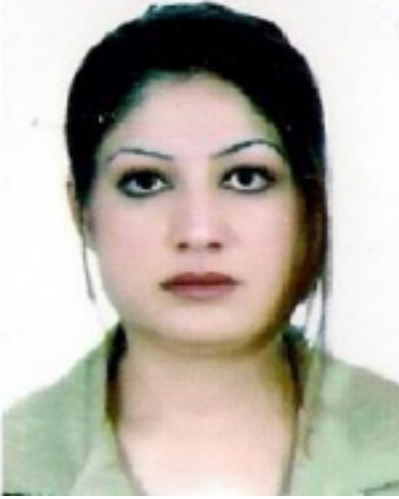
فیان عه بدولر هجیم عه بدولر

له ماوهی (۱۸) سالی حوکمرانی رابردوودا خه لکی ناوچه کهو گوندنشینه کان پشتگوی خراون که لانکهی شورش و پیشمه رگه بوون، زوربهی ئەو گوندانهی سهردانمان کردوون له خزمه تگوزاریه سهره تاییه کانی وه ک ناوو ریگابان و نه خوشخانه و قوتابخانه و پیوستیه کانی گه نجان و لاوان بیبه شن