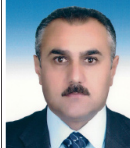
نهریمان عه بدولاً

پیداگیری و کار ده که م بو دابینکردنی خزمه تگوزاریه سه ره کییه کاندیدی ده ره بندیخان، چونکه مه حرومه له ئاوی خواردنه وه و ئاویکی ژه هراویمان هه یه، له کاتیکدا که خومان له پال به حریک ئاوداین