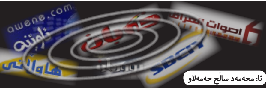
ئا: مه مه د سالح هه مه لاهو

پۆستی سه رۆک هه ریمی داهاووی کوردستان بکاتو روونیکردوه هه رچه ند پینشینیازیکی له و جوړه هه بووه، به لام من ئاماده نیم پاشه کتسه بکه م. له میانه ی رۆژنامه وانه ییه که دا میراوه دیلی تیشکی خسته سه ر ئه وه ی که «که س نازانیت داها تی هه ریمی کوردستان و ریژه ی (17٪) هه کی هه رپم چون و به چ شینوه یه ک خه رجه ده کرت». وا تانیستاش بازاریکی نازاد له هه ریمی