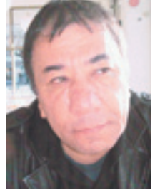
... هەلبژاردنى ئايندى پارلەمان و سەرۆكى ھەرىم، چەندىن دىيارەدو - كلتورى - تازەى لىدونى

ھىنايە كايەو.. يەكېك لەو كلتورى تازەيەى لىدون كە لە داھىنانى (دەسلەتە، بريتىيە لە لاڊردنى ئەتەكېتى لىدون، كە زۇرجار قەسى سەرچادە و باونەماو، بئەماى ديارى قەسو لىدونەكانە، تاوانباركردن بە «تابورى پىنج» ھەلبژاردنى دەسلەتە.. بەلى دەسلەتە سەرچوپی سىمپانەكانىان ئەو رەوتە مەزە جەماورەيەى «گۇران» بە - تابورى پىنج - لە قەلەمدەدا.. لەوچۆرە «زۇرنالىدانەمان» زۆردەمىكە گۆي لىبوو، خوڭو ومانەتە وەو لەسەرى راھاتووين.. بەلام ئەو پىووست دەكات ئەمجارە ھەلوەستەيكە لەسەر بەكىن كە كام لەو زورناژەنانەن لەوچۆرە لىدونانە دەدەن!؟