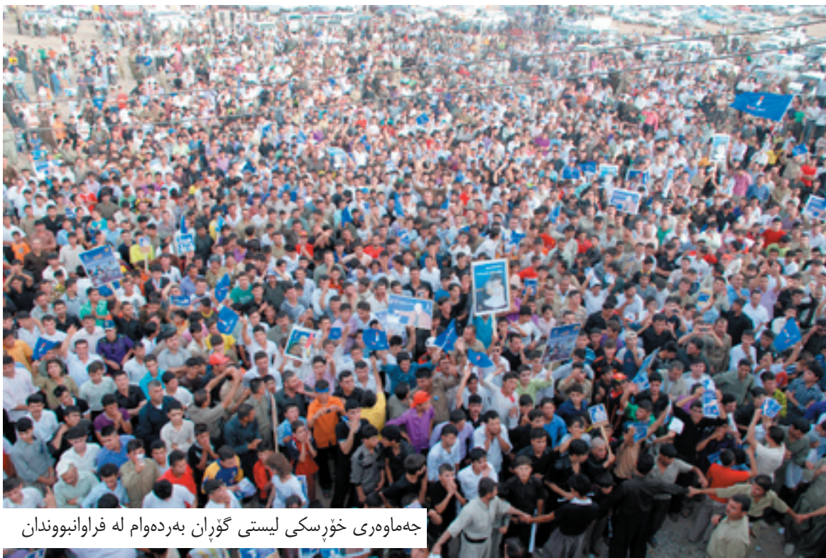
جەماوەرى خۆپسكى لىستى گوران بەردەوام لە فراوانبووندا

دىموكراسىدا كاتىك لايەنگرانى حىزىيەك يان لايەنىك دەپ ئىكەن سەرجادە لايەنگرانى لىستەكانى دىكە رىزىيانلىدەگىرن، ئىمەش داوا لە دەسەلاتداران دەكەين رىز لە ئىرادەى جەماوەرى گوران بگىرن، بەنمونه كاتىك دەبينن ئەو جەماوەرە ئاھەنگدەگىرن با وازيانلىبينن و لەشوينىكى دىكە ئاھەنگىگىرن، واتە ئىستىفزازى لايەنگرانى ئىمە نەكەن، دەبىت دەسەلات دان بە وەدانىت كە زۆرىنەى شەقام لەگەل ئەواندا نىن، ئەمەش دياردەيەكى شارەستانىيە مافى گوزارشتكردە لەبىروباوەرى جىواون.