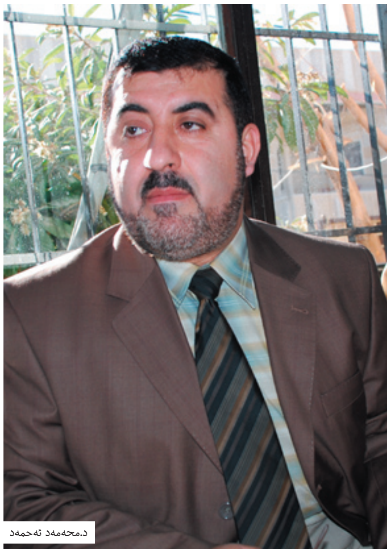
د. محمه د ئهمه د

خراپ مامه له کردنه هینایه و ه، که کار یگه ری له سه ر چاره سه رنه کردنی کیشی کهرکوک هه بووه و وتیشی: «ده رهنانی نه وت به راستی کیشی کهرکوک ئالوز کرد، له کاتیکدا هچ سوو دیکمان له ده رهنانی ئه و نه و ته نکردو ئیستاش سه قامگیری له قازانجی کورده، هه میشه لیوانه کانمان