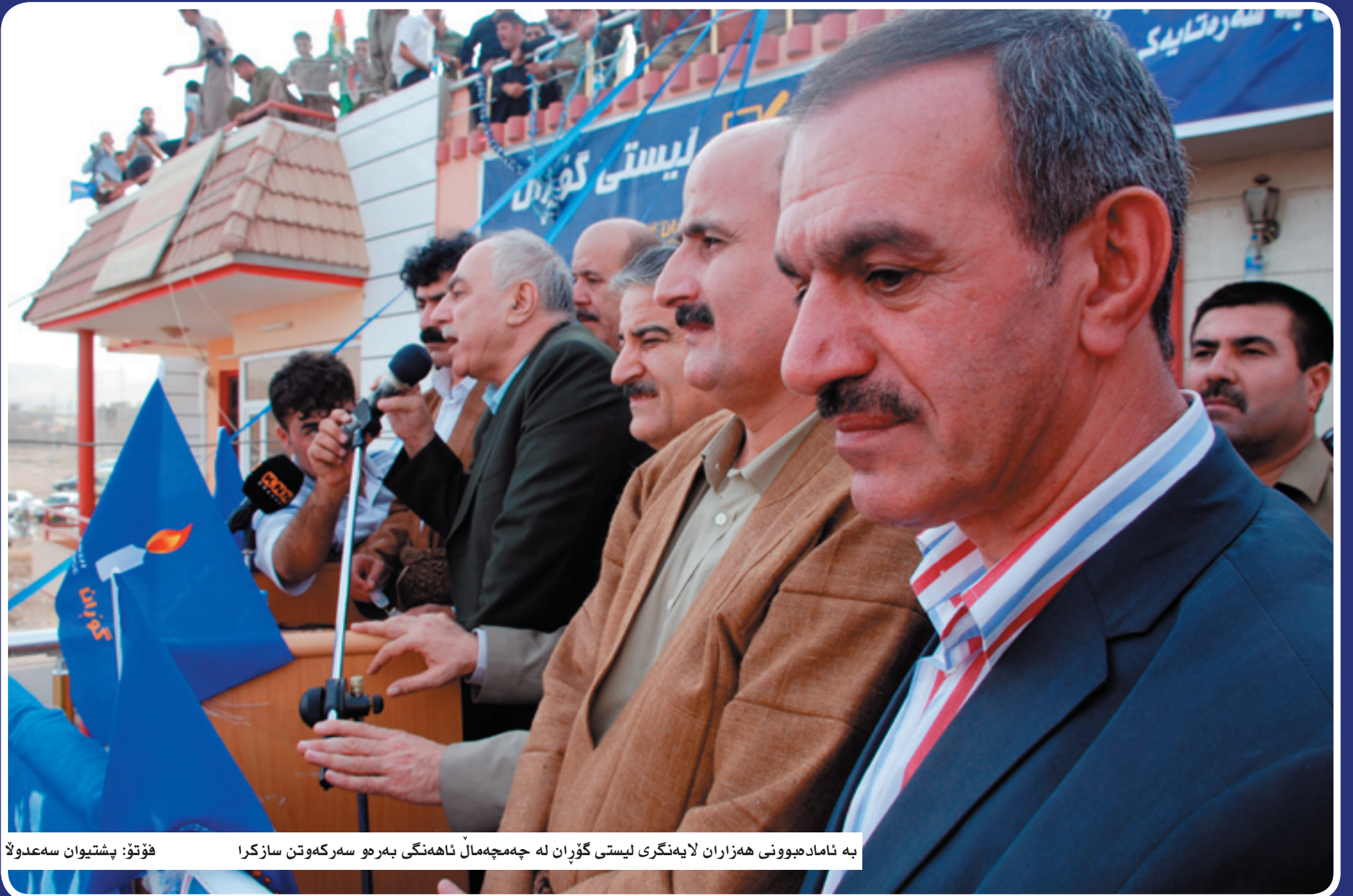
به ناماد مپوونی ههزاران لایهنگری لیستی گۆران له چه مچهمال نا ههنگی به ره مو سهرکه وتن سازکرا