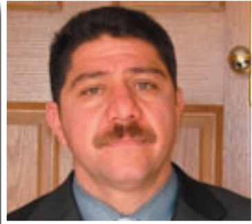
پروفېسسور ي. دكتور ياسين سەردەشتى