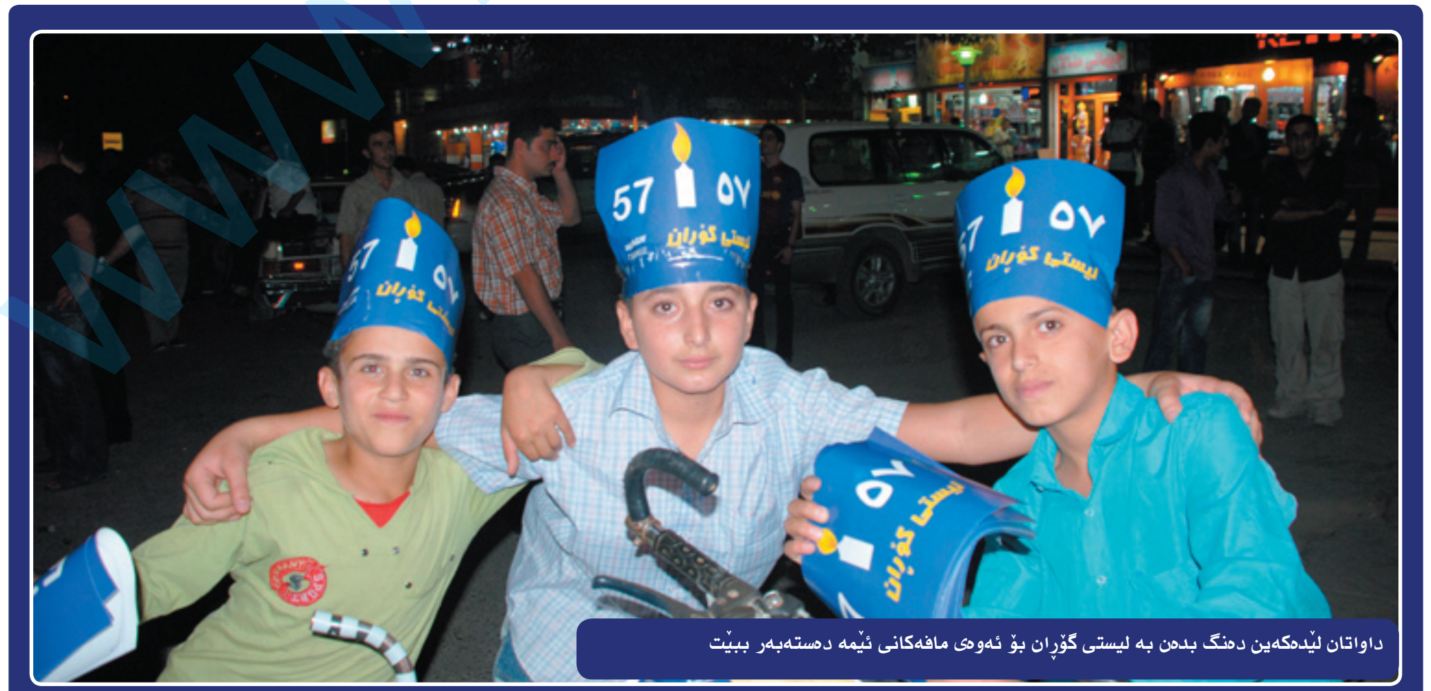
داواتان لیده که یه دننگ بدن به لیستی گوران بؤ نه وه ی مافه کانی ئیمه ده سه بهر بیته