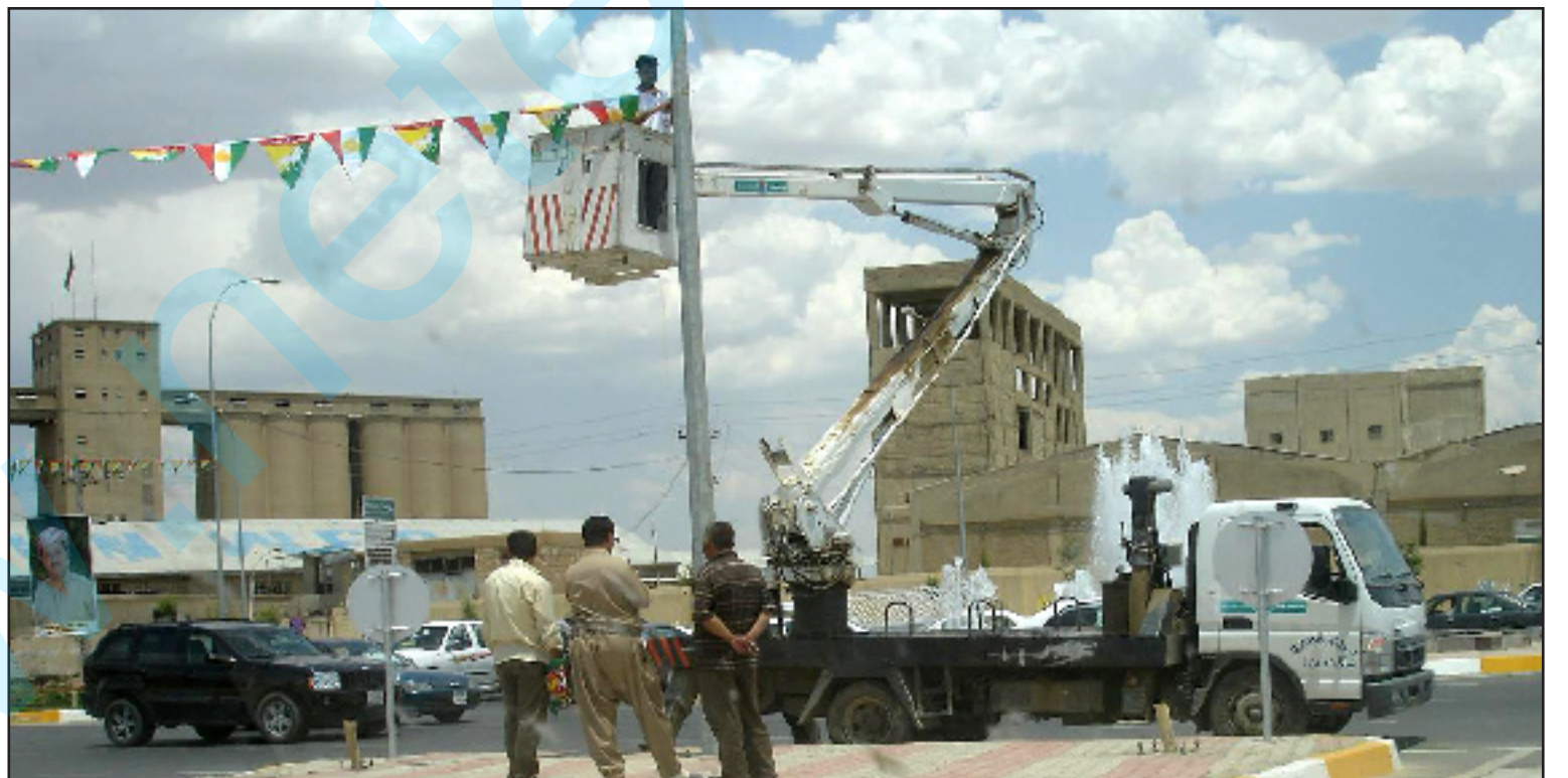
ئۆتۆمبیلی فه‌رمانگه‌ی دابه‌شکردنی کاره‌بای هه‌ولێر له‌ بانگه‌شه‌ی هه‌لبژاردندا به‌کارده‌هێنریت

فه‌ره‌ج سه‌یده‌ری، سه‌روکی کۆمسیۆنی بالایی سه‌ربه‌خۆی