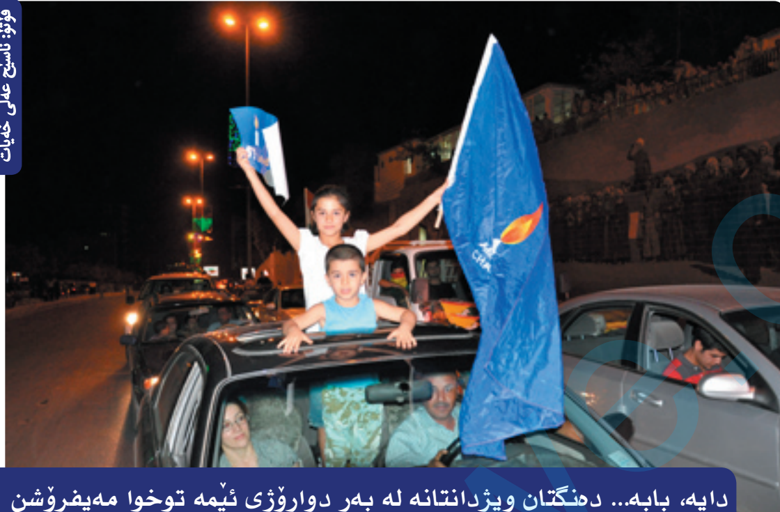
دایە، بابە... دەنگتان ویزداننە ئە بەر دواروژی ئێمە توخوا مەیفروشن

نموونه ئاستی بواری ئابووری کۆمەلگە زۆر تەحەکۆم دەکات و دەبێتە هۆی ئەوەی کە ئەو لیست و قەوارەیی بەهۆی هەژاری و لاوازی بواری ئابوورییەو سەیتەرە بەسەر عەقڵ و هۆشی دەنگدەردا دەکات و عەقڵ و فیکری دەکریت.