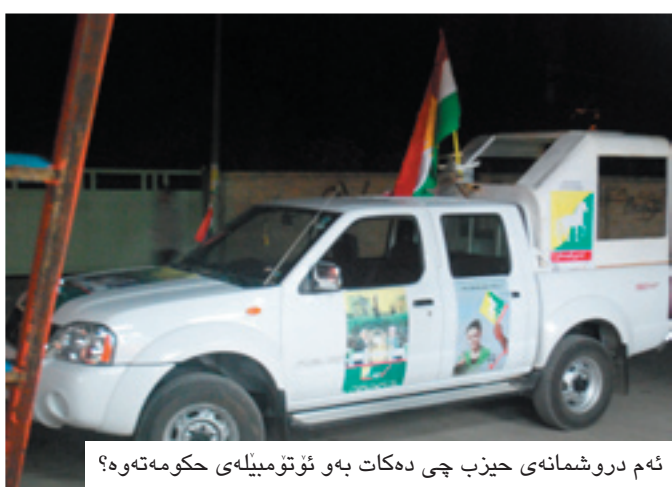
ئەم دروشمانەى حیزب چى دەکات بەو ئۆتۆمبیلەى حکومەتەو؟

ئاڭجەلەرى لیستی گۆران بە (بەرەو گۆران) راگەیاندى: لەسنوورى ناحیەى ئاڭجەلەر بە کەلوپەلو پێداویستیگى حکومییەکان کە ھى ھەموو لایەنیکەو مولکی گشتییە، بانگەشەو ریکلام بۆ لیستیگى دیاریگراو دەکریت، لەو چوارچۆیەشدا ئۆتۆمبیلیگى سەرۆکایەتی شارەوانی ئاڭجەلەر روژانە بە پۆستەرو وینەکانی ئەو لیستەو بە سنوورەکەدا دەسووریتەو بانگەشەو ریکلام دەکاتو ئالای ئەو لیستیگى ھەلگرتوو.