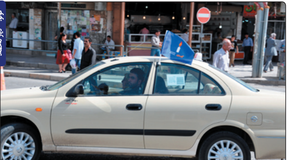
چۆن لەبیرمان دەچیتەو بۆ چۆری بەنزین شەوانە لە بەردەم بەنزیخانەکاندا دەماینەو