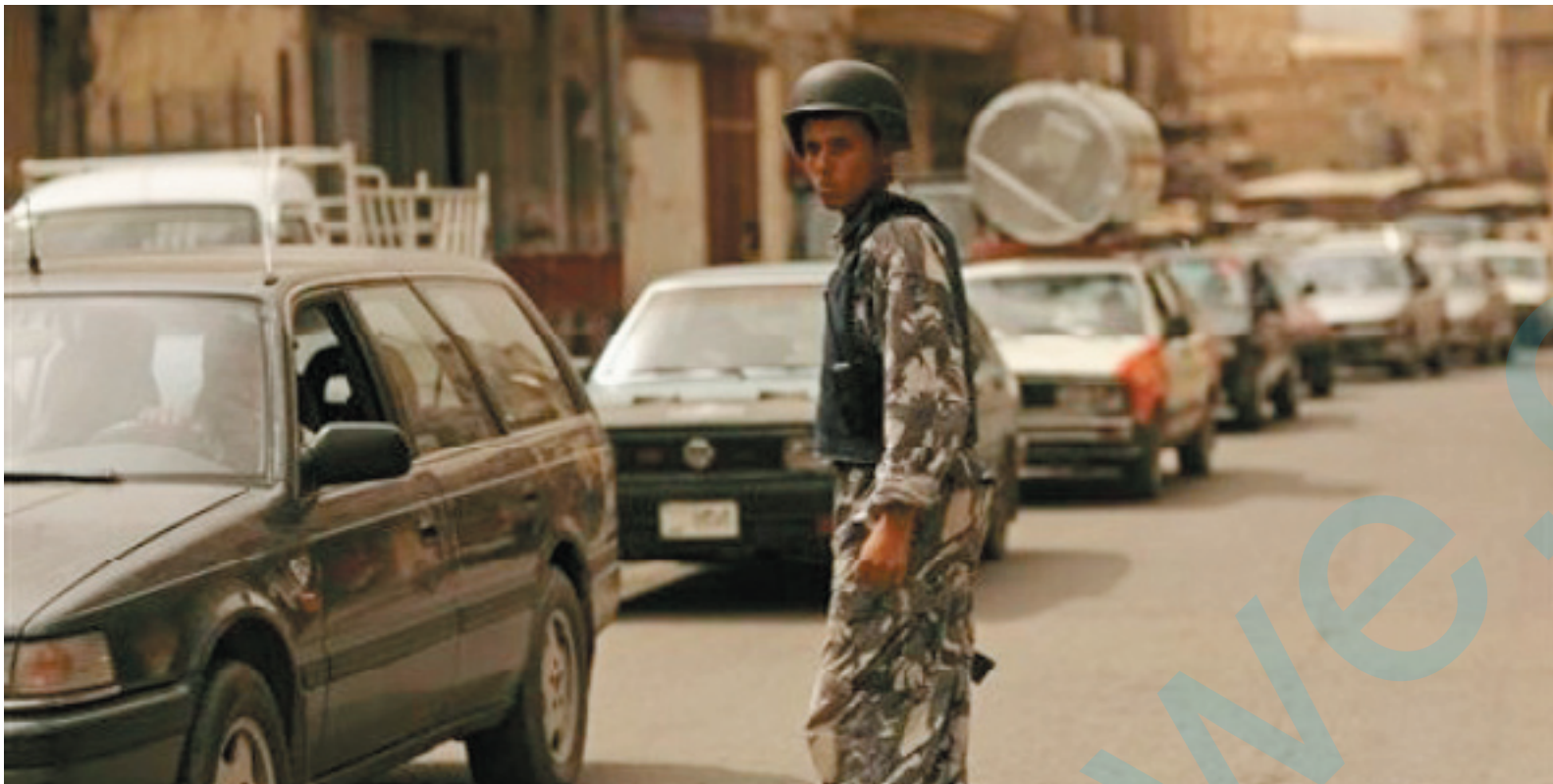
سه ر کهوت له تیف

دوای خستنه پرووی چەندین لیکۆلینه وه ده‌رچوونی سێ مادهی یاسایی، تائیس‌تاش بارودۆخی ناوچه‌کانی جینی ناکوکی نیوان حکومه‌تی هەرێمی ده‌سه‌لاتی ناوه‌ندی وه‌ک خۆیه‌تی، به‌کشانه‌وه‌ی هیزه‌کانی ئەمریکا له‌ ناوچه‌کانه‌دا، مه‌ترسی رووبه‌رووبوونه‌وه‌ی پێشمه‌رگه‌و سوپای عێراق به‌ دور نازانیت.