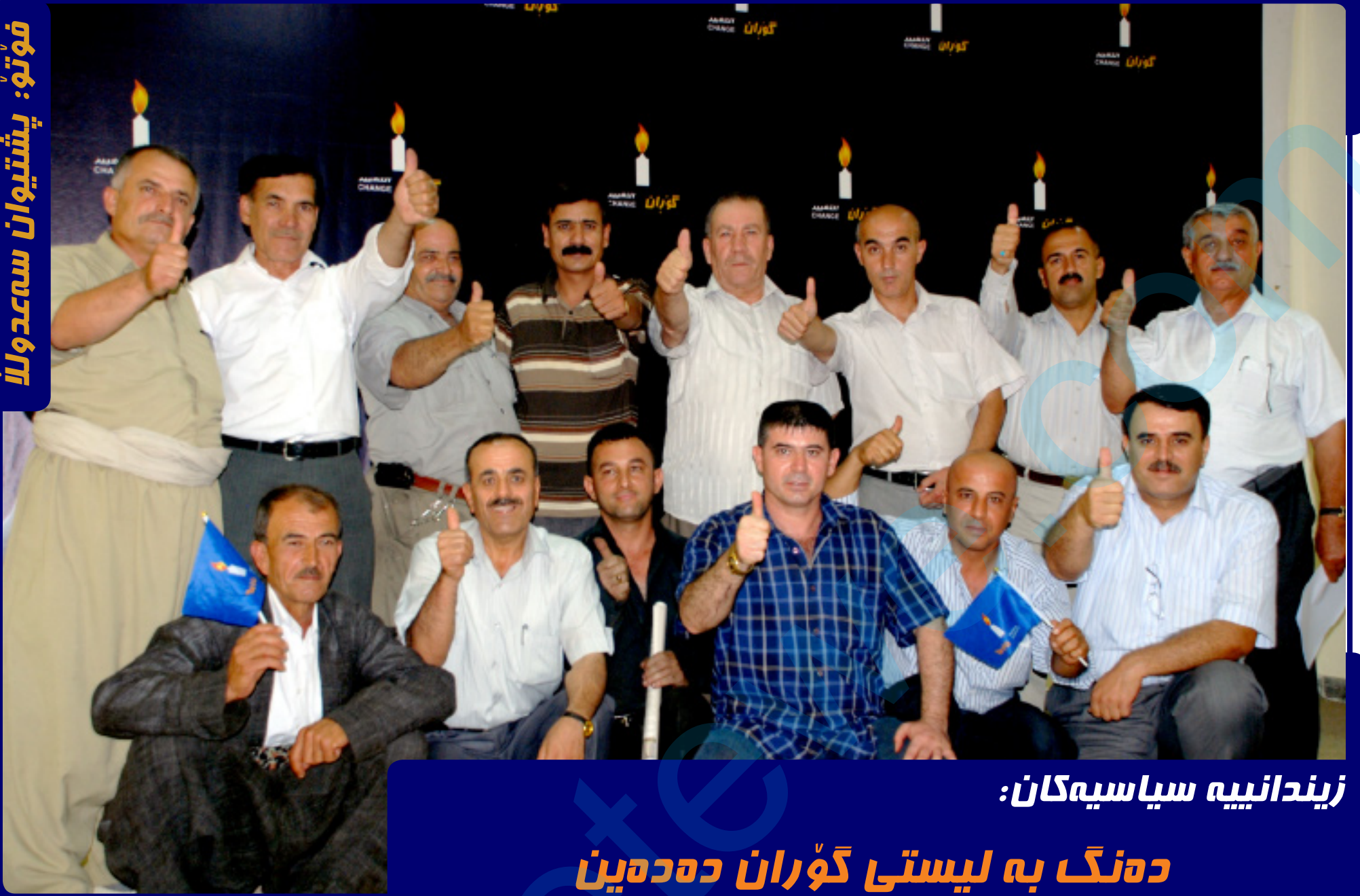
زیندانیه سیاسیه کان: