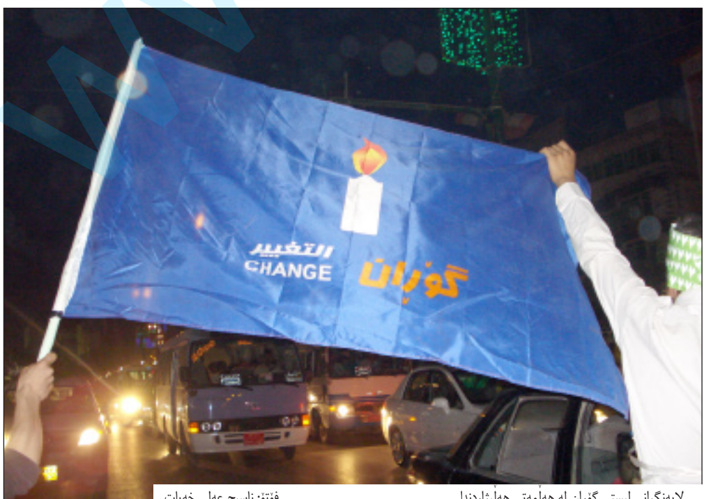
لیسته گۆران له هه لمه تی هه لیزاردندا

نیشتمانی هه ریم بکه ن، نه ک حیزبه سیاسییه ده سه لاتدارهکانی کوردستان، وه ک له ماده ی (117) دا هاتوو ه). لایه نی کوردی له به غدا نه یئاویوه شه را که تی سیاسی رۆشن له گه ل هیزه عیراقیه کاندای بنیات بنیت، نه یئاویوه گوشار به ئاراسته ی چه سپاندن و جیه جیه کردنی ئه وه ماده ده ستوریانه دا دروستبکات که مافهکانی گه لی کوردستان ده سه له منداریه کی کورد نیه نه دایه بیت، سه ره کردایه تی سیاسی کورد هه له وه که موکو ری له به غدا وه کوردستان هه بووه، هه رچه ند هه له وه که موکو رییه کاندای ناکاته ئه وه ی که بو تریت سه رکرایه تی کورد ده یوانی هه موو شتیک بکات و هه یچه نه کردوو، به لایم له گه ل ئه وه شدا سه رکرایه تی کورد ده یوانی کاری زیاتر بکات. لیستی گۆران که لیستی جیاواری هه لیزاردنی داهاتوو ی په رله مانی کوردستانه وه له لایه ن نه وشیروان مه سته فاوه سه روکایه تی ده کریت، به یه کیک له لیسته گه ورهکانی نیو ئه وه هه لیزاردنه داده نریت، له به رنامه و پرۆگرامی لیستی گۆراندا باس له به دینه هاتنی خواسته نه ته وه ییهکانی گه لی کورد کراوه له ماوه ی چه ند سالی رابردوو دا، که ئه وه هه ر به رپر ساری تییه کی گه وره ی سه رکرایه تی سیاسی کورد، که که مه تر خه مانه مامه له ی له گه ل ئه وه خواسته و مافانه دا کردوو. هه ره وه ک له په یام به رنامه ی لیستی گۆراندا هاتوو ه «له دوا ی روه خانی رژی می عه سه وه، سه رکرایه تی کوردستان به هه موو قورسای خۆیه وه له به غدا ئاماده ی، چه ندین پۆستی سیادی و وه زاری هه ستریا یی حکومتی عیراقی فیدرالی و درگرتوو، که چی کارنامه ی نیشتمانی