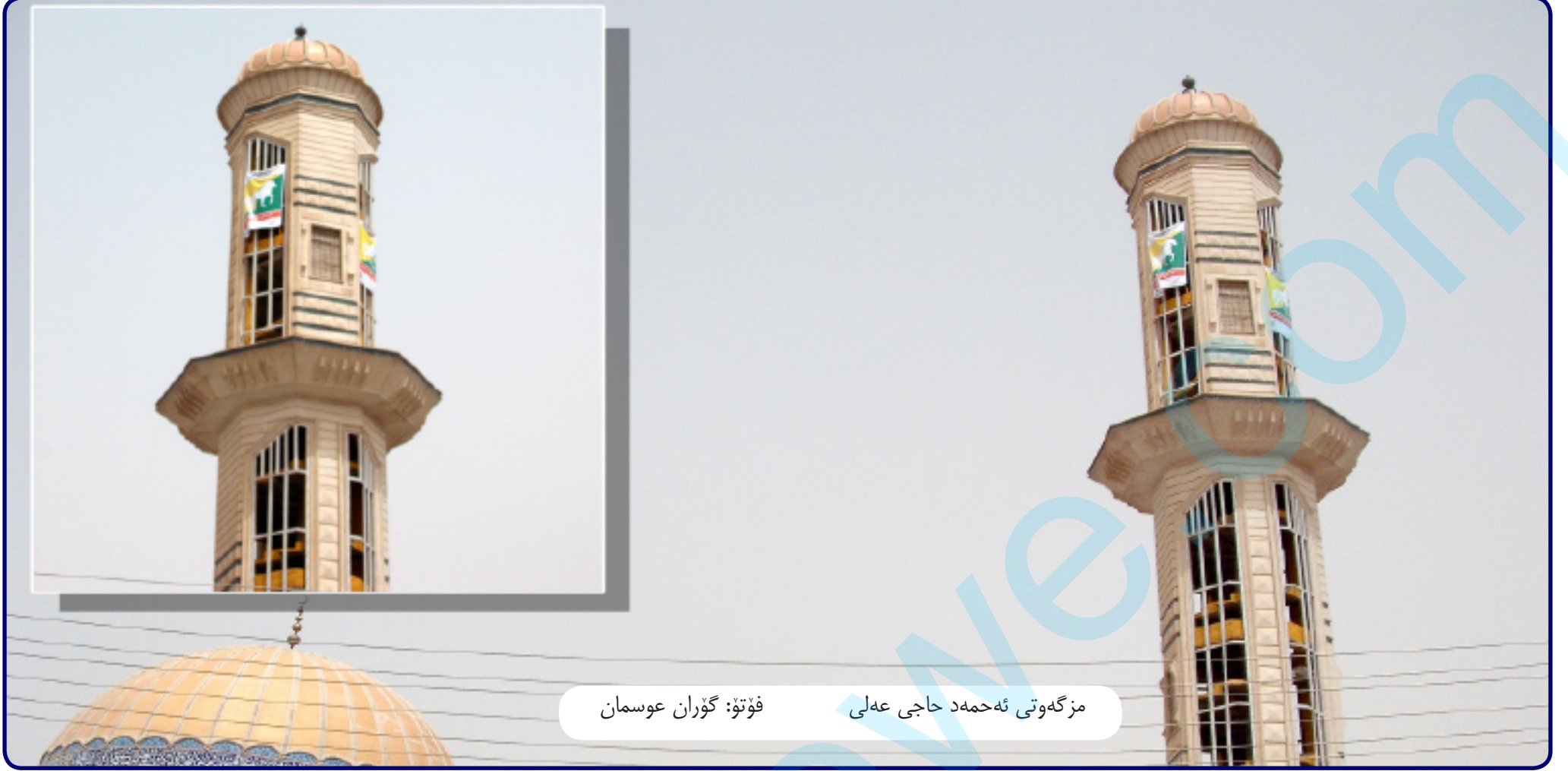
فوتۆ: گوران عوسمان