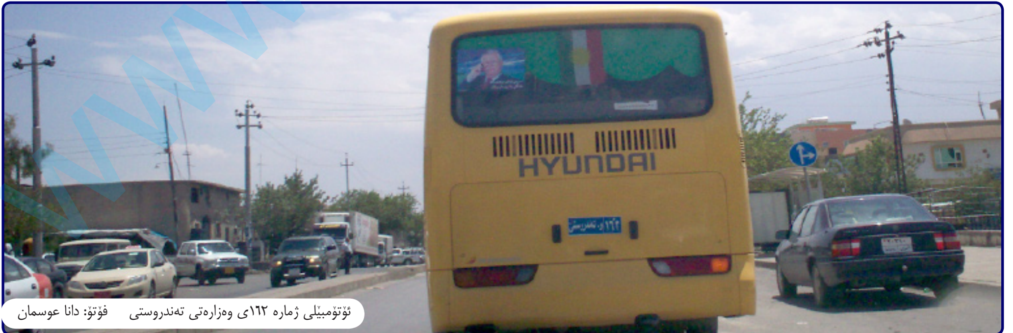
ئۆتۆمبیلی ژمارە ١٦٢ ی وەزارەتی تەندروستی