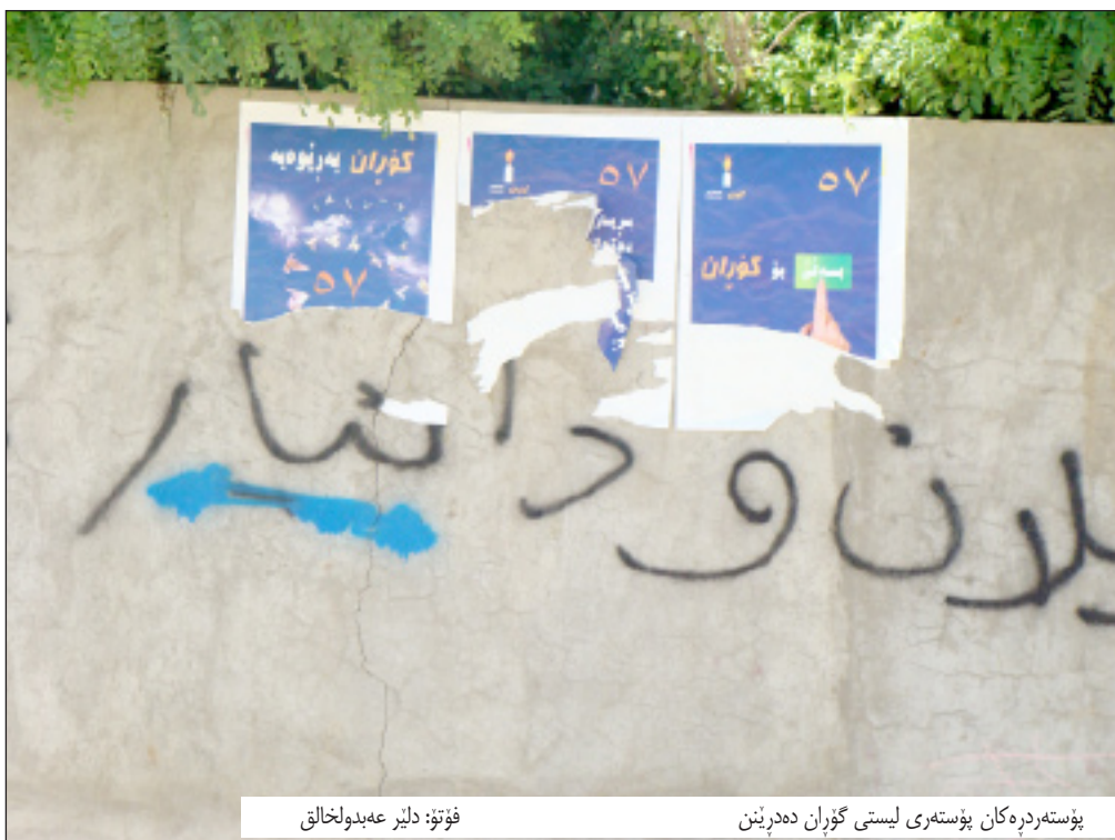
پۆسته درهكان پۆسته ییستی گۆران دهرنن