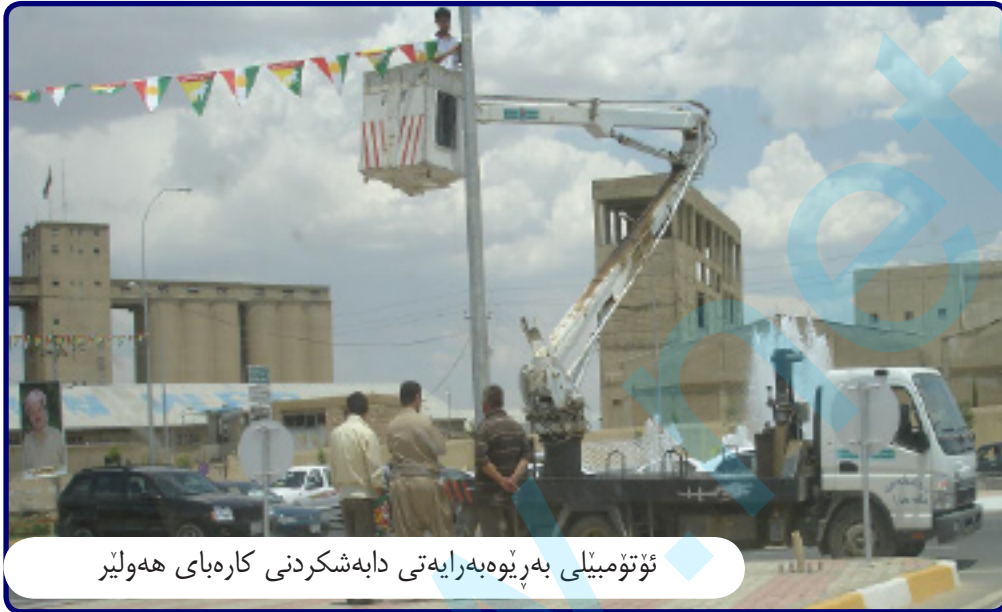
ئۆتۆمبیلی بەرپۆهەرایەتی دابەشکردنی کارەبای هەولێر