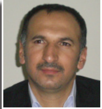
فه ره يدون حه مه ره شه يد

نه هه مته تی و نه گه یه تیبه کانی خه لکی کوردستان ده سته پیده کات، که کورد گه وهره ترین قوربانی و به شه مه یه تی بۆ ئه گه ری راپه رین و هاتنه کایه ی دهسه لاتی کوردی کردووه، وه لی نه پتوانی وه ک ته مه ناو تموجه کانی خۆی پاداشتی مافی هاو لاتیبوون له دهسه لات وهر بکیریته وه. له بزیکسی یه که م ته قه ی شورش له ۱۹۶۱/۹/۱۱ و هاتنی لیوا عه شه رین له سالی