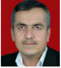
نهجات ئه سپینداره یی