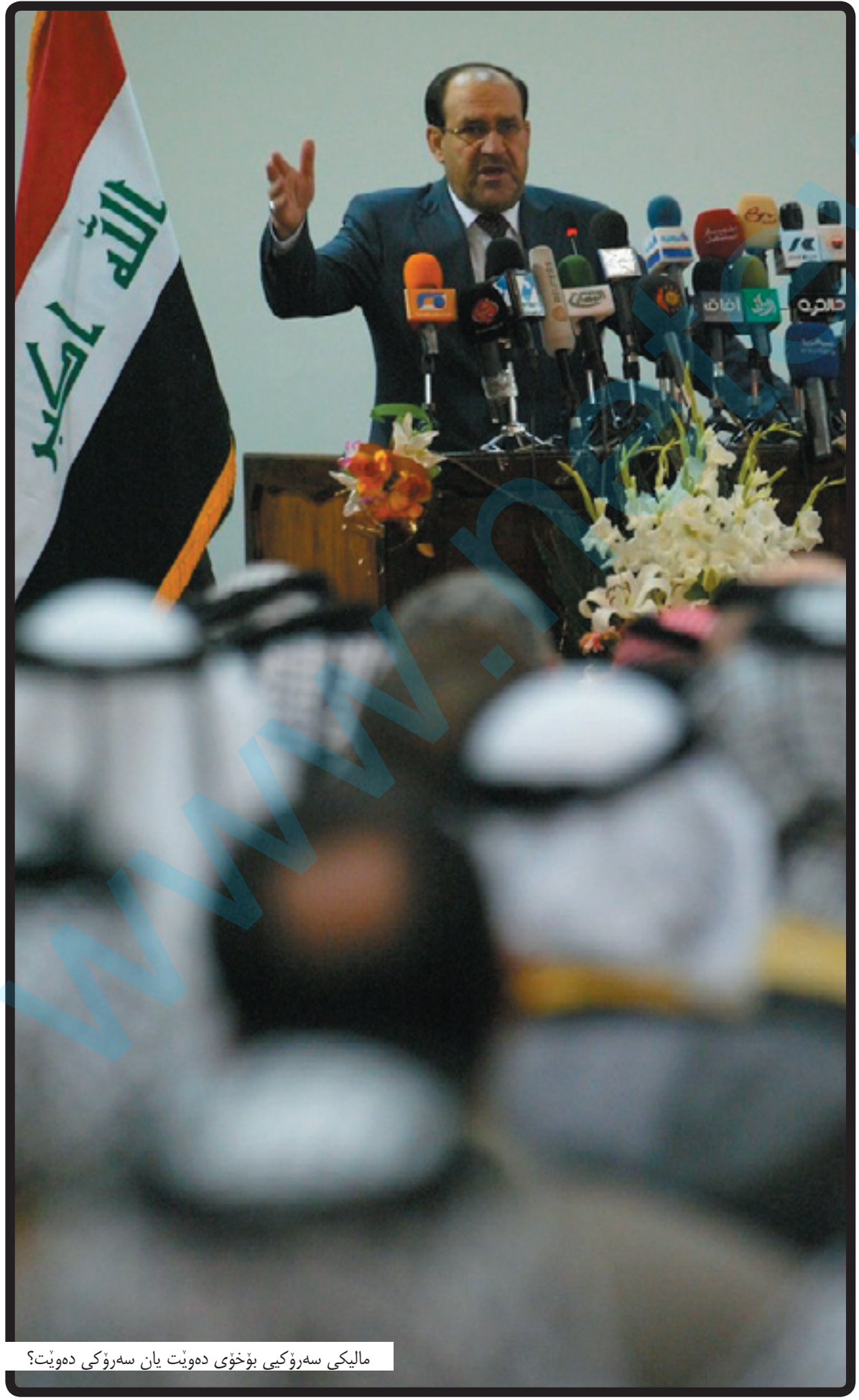
مالیکی سەرۆکی بۆخۆی ده‌وێت یان سەرۆکی ده‌وێت؟

ئەندامه‌که‌ی لیستی هاوێپەیمانی کوردستان ئەوه‌ی نەشارده‌وه‌ مالیکی هەولە‌کانی به‌و مه‌به‌سته‌یه‌ کە پۆستی سەرۆک وەزیران بۆخۆی بمانیته‌وه‌، هەرچه‌نده‌ پاش هەلبژاردنه‌کانی ئەنجومە‌نی پارێزگاکان، ئەنجومە‌نی بالای ئیسلامی توشی پەراویز بووه‌و ئەو هاوێپەیمانییە‌یه‌ له‌گەڵ دعووه‌ گه‌رموگور نیه‌، هەردوولا هەولده‌دن پێوه‌ندییه‌کانیان باش بکەنه‌وه‌ و هاو‌به‌شیان وه‌ک یه‌ک بێت،