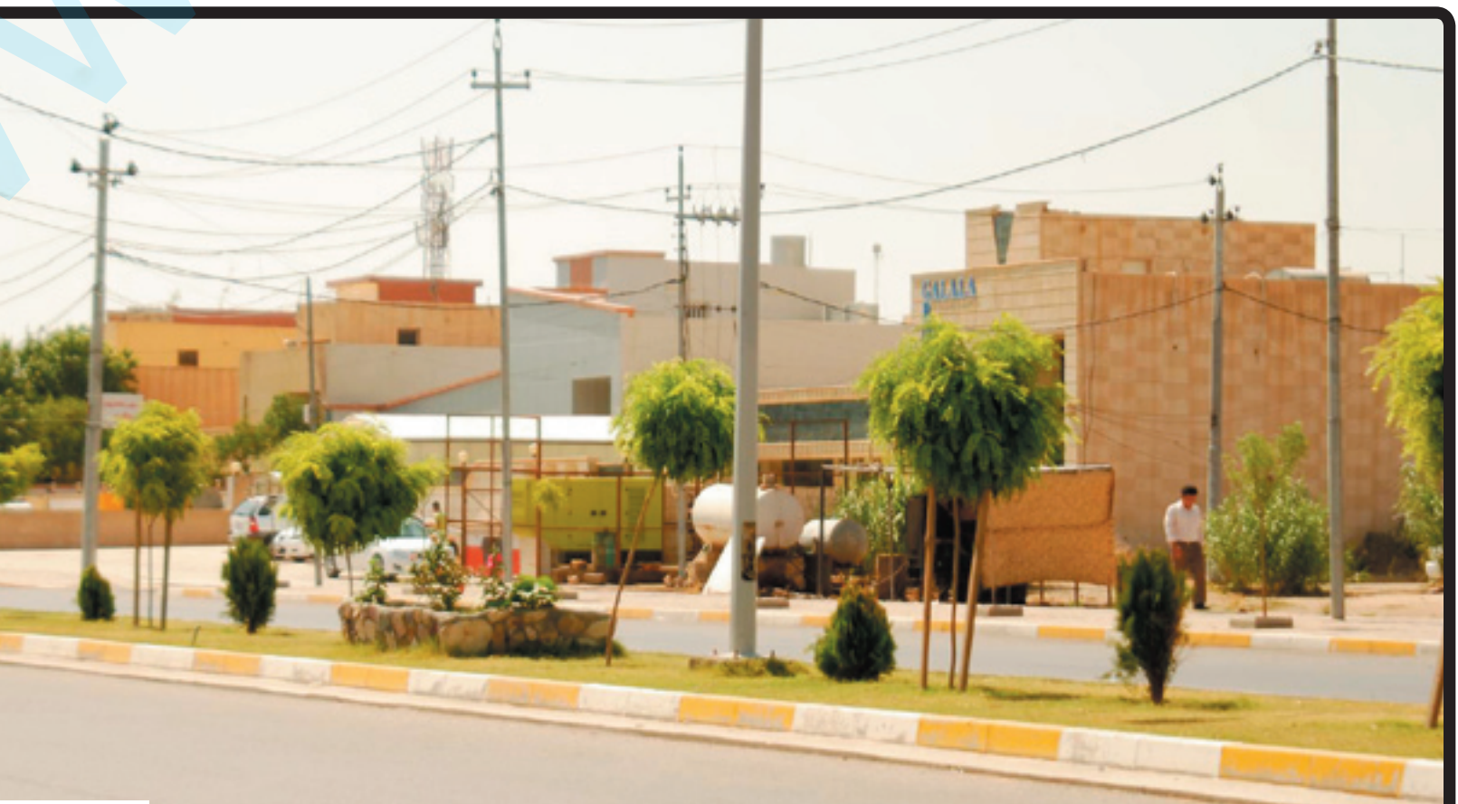
ھەولير، بەشیک لە خانووى ئەمەن عامەکانى سەردەمى بەعس

بەھەمانشيوھ باسى خراپى بارى دەروونى و گوزەرانى خيزانەکانى نيشتەجىي ئەو خانووانە کرد، ئەو کە خاوەنى سى مندالە، وتى: «لە يەک خانوودا زياتر لە (۱۵) خيزان دەژين، ماليش ھەيە ھەشت سەرخيزان لە يەک ژوردا دەژين کە جيگای دانيشتن و نووستن و ميواندارى و خۇشتيانە.» ھەندىک لەو ئاوارانە رەخنەى ئەوھ دەگرن کە تائيسا کارىكى ئەوتويان بۆ نەکراوھو ئەو بەلئانەى پيشترش پيناندراوھ، جيبەجيبەکراون، جگە لەوھش قەرەبووکردنەوھى ھەندىک لە ھاوالاتيانى نيشتەجىي سى خانووى دیکە، خيزانەکانى دیکەى بيزارکردوھ. ھيوا دەلئت: «لەتەنیشت خانووهکانى