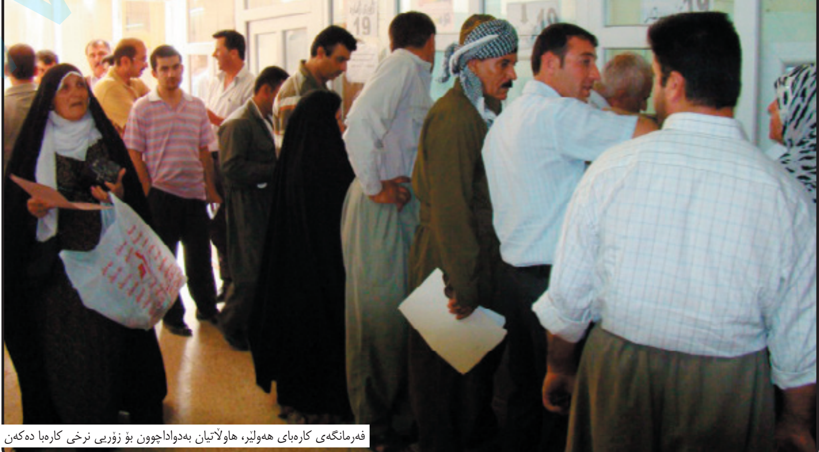
فرمانگه کی کاره پای هه ولیر، هاو لاتیان بهدوداچوون بو زوری نخه کاره با ده کهن

پاره کی کاره با مان زیاد کرد بوئوه کی هاو لاتیان ده ست به کاره باوه بگرن و به پی پیوستی خویان کاره با به کاره بېرن، له به رنامه شماندایه پاره کی کاره با زیاتر بکین بوئوه کی هاو لاتیان که متر کاره با به کاره بېرن