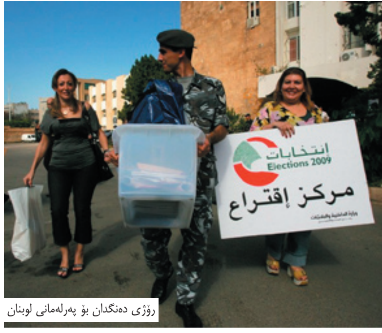
روژی دنگان بۆ په رله مانی لوبان

پیوست ده کات حکومه تی ئه و ولاته له هه مو لایه نه کان پیکیت، ئه گه رچی هاوپه یمانیتی لایهنگری خورناوا حه فتا کورسی هیناوه، به لام ناتوانیت به بی حیزبوللا که خاوه نی (۵۸) کورسیه، حکومه ت پیکه یینیت و ئه گه ری