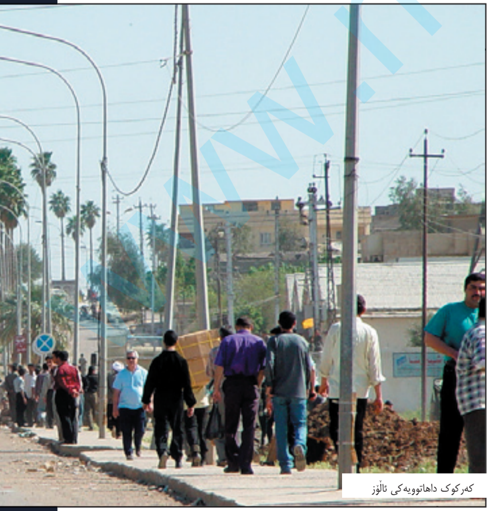
کهرکوک داهاتوویه کی ناوژ

هیلتهرمان: دروسته تو ده توانیت بلینت نه م ماده یه ده ستوری و ده بیت جیبه جی بکریت، به لام که من بلیم نه مه هه له یه، مه به ستم له وه یه نه م کاره واقعی نییه و نه ناماندریت، ده کریت له لایه ک تو بلینت یاسا و مافمان هه یه، له لایه کی دیکه ش سیاست بریتیه له به ده سته یان، بویه له گوشه نیگایه کی ریالیستانه وه نه م کاره واقعی نییه.