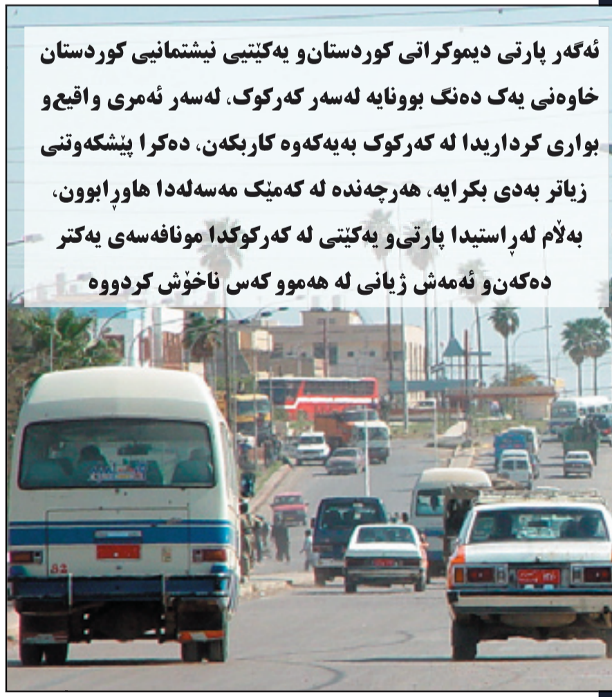
ئەگەر پارتی دیموکراتی کوردستان و یهکیتی نیشتمانی کوردستان خاوهنی یهک دەنگ بوونایه لهسەر کەرکوک، لهسەر ئەمری واقیع و بواری کرداریدا له کەرکوک بهیەکەوه کاربکەن، دهکرا پیشکەوتنی زیاتر بهدی بکرایه، هەرچەندە لە کەمیک مەسەلەدا هاوڕابوون، بەلام لەراستیدا پارتی و یهکیتی له کەرکوکدا مونا فەسەى یهکتر دهکەن و ئەمەش ژيانى له هەموو کەس ناخۆش کردوو