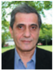
چیا عه باس

ئه وه ئیمه‌ی هاو لاتی ساده و بیده‌سه لاتی ئەم خاکو میله‌ته نین که به‌ریزان لاتی ئەم میژوه‌تان هه‌و ریگه لابه‌لاو چه‌وت و زیگزاگانه‌ی پی پیشان دابن و جه‌نابتانی خزانیتته ناو گیزاوی شیژوفرینای سیاسیتانه‌وه، ئه‌وه خوتان به‌راده‌ی سهره‌کی له په‌شوکبه به‌پرپرسن، چونه‌که ئه‌و ساتو ئیستاش ههر له‌لوتکه‌ی دسه لاتدان. بیگومان ئەگهر له‌سهر پیناسه‌ی به‌رژوه‌ندی با لای نه‌ته‌وایه‌تی کوکو یه‌ککرتو بو‌نایه، نه‌ده‌کرا ئه‌و شه‌رو ململانی خه‌ستانه بگهن که کردوتانه. ههر یه‌کک له به‌ریزتان ئه‌و به‌رژوه‌نده‌ی به‌لایه‌کدا برده‌و به‌ پی پیناسه‌ی خزی له‌گه‌لیدا سیاسه‌ت و رفه‌تاری کردوه. که بارودوخه‌که ره‌خسا به‌یه‌که‌وه بن، ئومیدو چاره‌روانی لای میله‌ت زیندبوونه‌وه، به‌لام به‌داخه‌وه به‌ریکی و به‌پی سه‌وه‌ری یاساو دادپه‌وه‌ری کومه‌لایه‌تی و به‌شه‌فافی‌ته‌وه به‌ریوه‌تان نه‌بهرد.