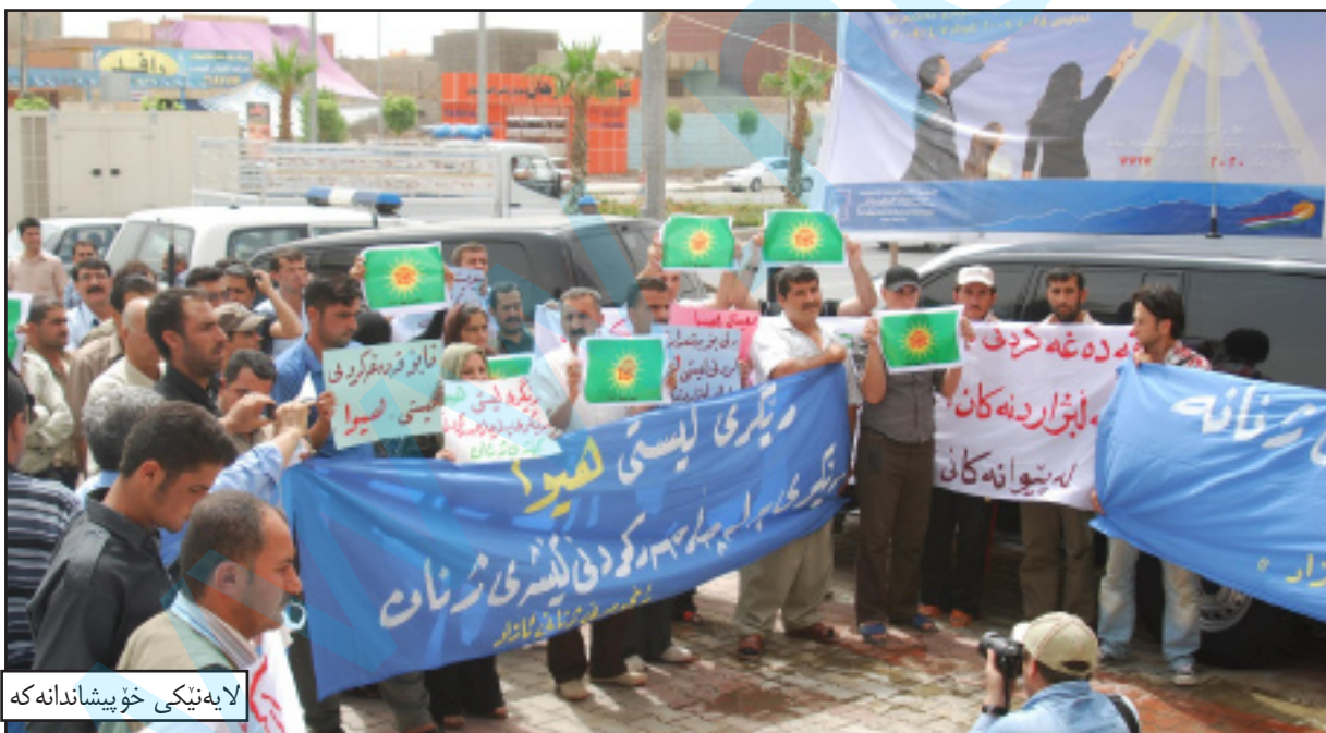
لایه نیکی خۆپیشانانکه که

فهرج حه یده ری سه روکی کومسیونی بالای هه لیژاردنه کان، ئامازه ی به وه کرد، ئه م برپاره ی ئه وان هه یج گوشاریکی سیاسی له پشته وه نییه، وه زاره تی ده ولت بۇ کاروباری ئاسایشی نیشتمانی عیراق، نووسراوی ره سمیان بۇ ناروین، که نابیت ئه م قه واره سیاسیبه به شداری هه لیژاردن بکه ن، چونکه باشنییه بۇ کارکردن له هه ریمی کوردستان، داوی ئه وه ی ئیمه ش لیکولینه وه مان کرد بۇمان دهرکه وت که وه زاره تی ده ولت راست ده کات نابیت ئه م قه واره سیاسیبه به شداری هه لیژاردن بکات. فهرج حه یده ری ئامازه ی به وه شکرد، ئه م قه واره سیاسیبه ده توانیت له دادگا سکالا تومار بکات و ئه وه به لگانه به درؤ بختا وه به درؤدا بۇ ئه وه ی ئیمه ش به شداریان پیکه یین.