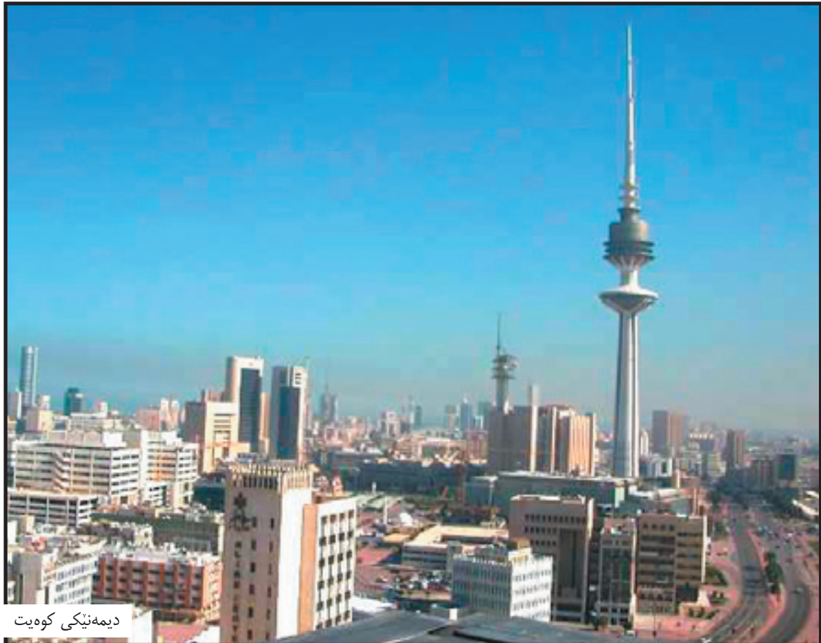
دیمه تیکی کوهیت

روژنامه ی کوهیت تایمز نووسیویه تی که بالیوزی ئه و ولاته گه راوه ته وه بۆ کوهیت دواي ئه و ی وه کو نۆینه ی ولاته که ی بۆ گفتوگۆکردن له گهل به پرسانی عیراقی، ده ستنیشا نکرابوو که له ژیر چاودیری نه ته وه یه کگرتوه کاندا