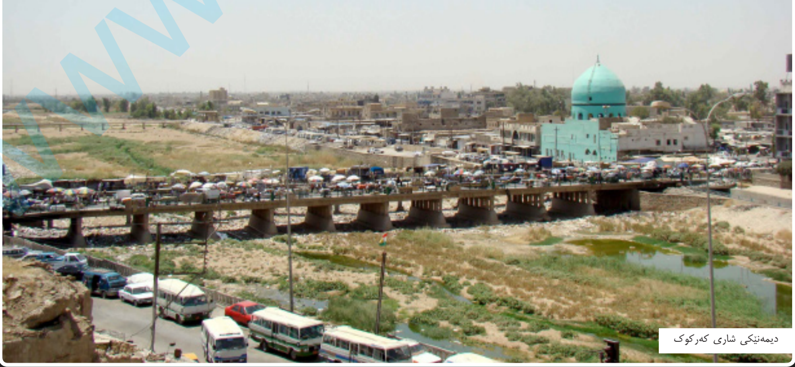
دیمه نیکی شاری که رکوک