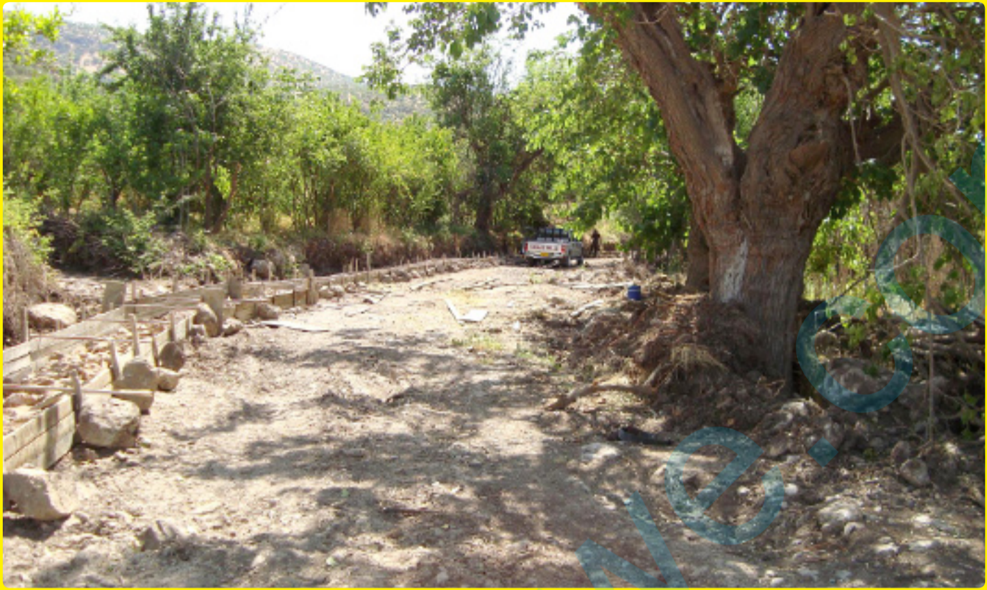
جۇگاي ئاودېرىي گوندى توتمه لەقۇناغى دروستکردندا، بەلام ئەوى خەنگەكى نىگەراندردوو شۆفل ليدانه لەجۇگاکان، كە جگە لەجۇگاکە لەتەنىشتەو بەدرېژايى جۇگاکە باغى ھاوالاتيان تېكدراون.