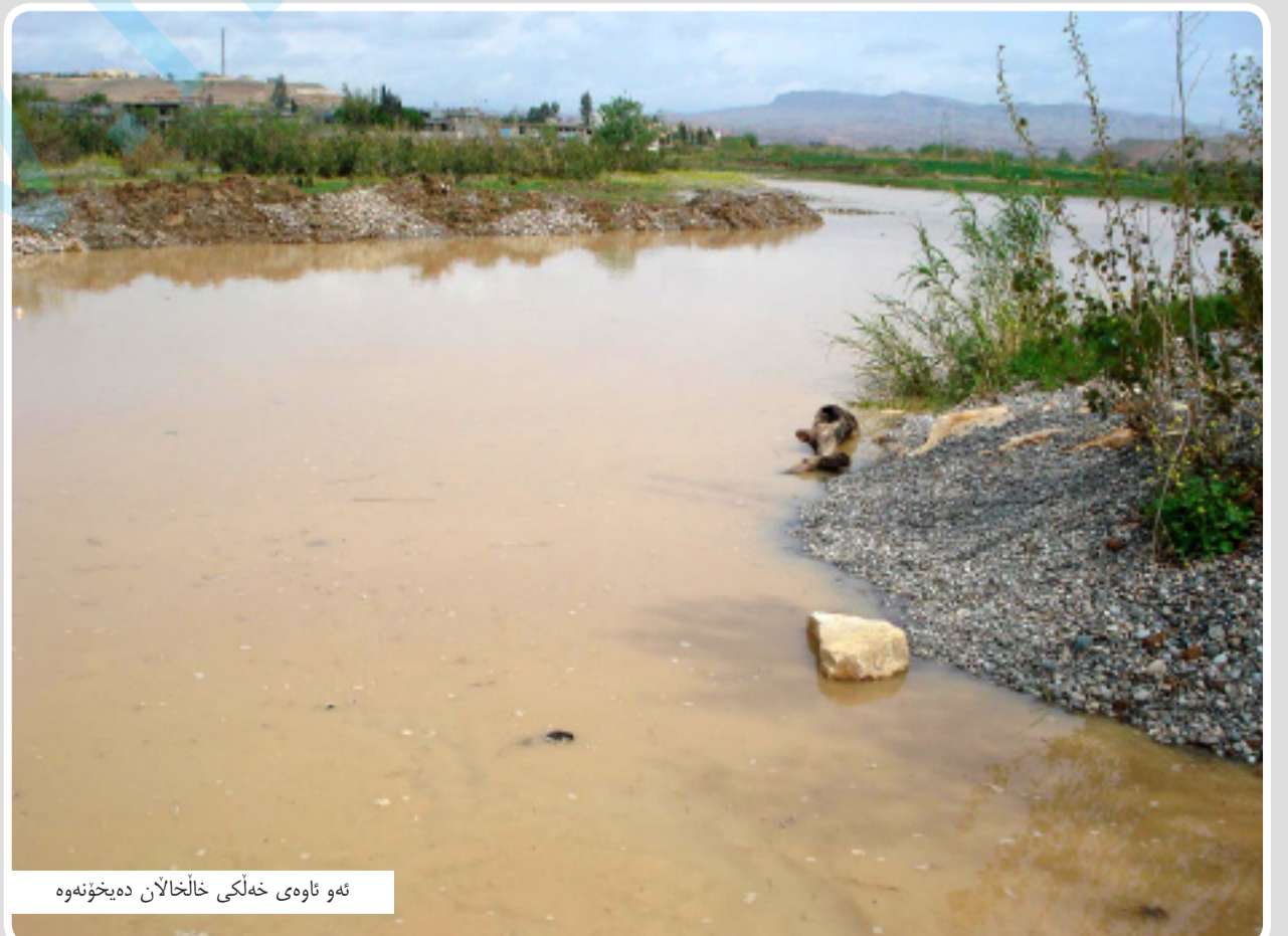
نه و ناوه ي خه لكي خالخالان ده بخونه وه

قهيس وتيشي: «گوزهراني نيمه به وشيوه يه يه، له كاتيكدا كه زور به مان كه سووكاري شه هيدو نه نفالين و نه ها ولايتيانه ن كه بهر له راپه رين خزمه تي پيشمه رگه يان دهكرد، نيسا ناوي خوار دنه وه ي پاكمان نيه و نازانين سهر