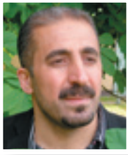
حما که که ره ش

(دسه لات گورگه له هه ر کاتو شوپنيکا بيتا!) هوبز