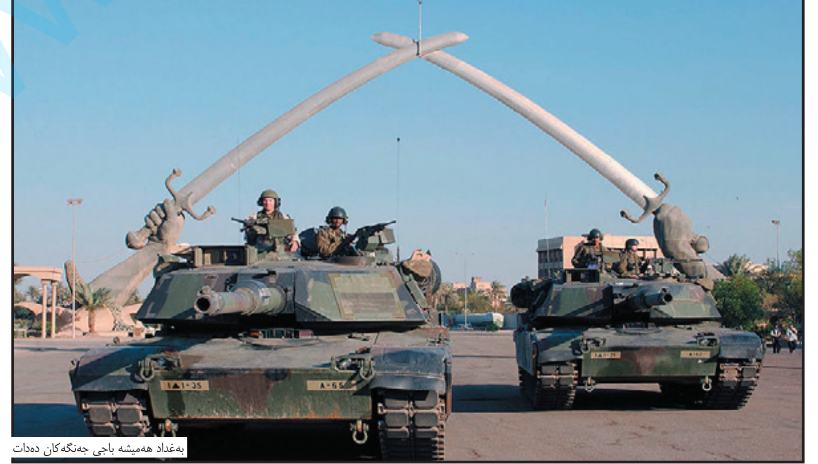
به غدا هه میشه باجی جهنگه کان ده دات

کوهیت دواي کردبوو که کۆمه لیک کیشه ی نیوان ههردوولا، له وانه چاره نووسی دیله کان و ونجووه