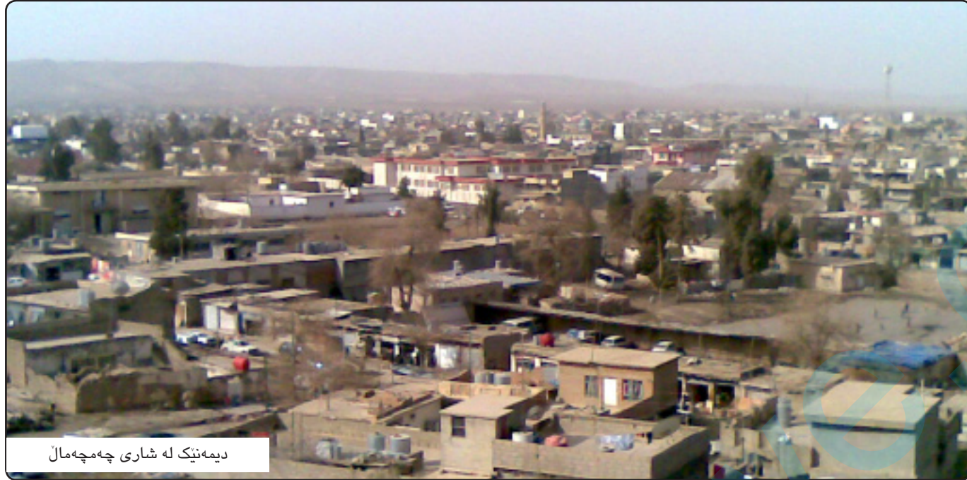
دیمنیک له شاری چەمچەمال

تائیسنا تۆری ئاو نەگەبشتووہتە گەرەکەکەمان، چەندینجار سەردانی لایەنی بەرپرسیمان کردووہ، بەلام ھەرچارەو بە بەلینیک بەریمانەدەکن و دواتریش ھیچمان بۆ ناکەن».