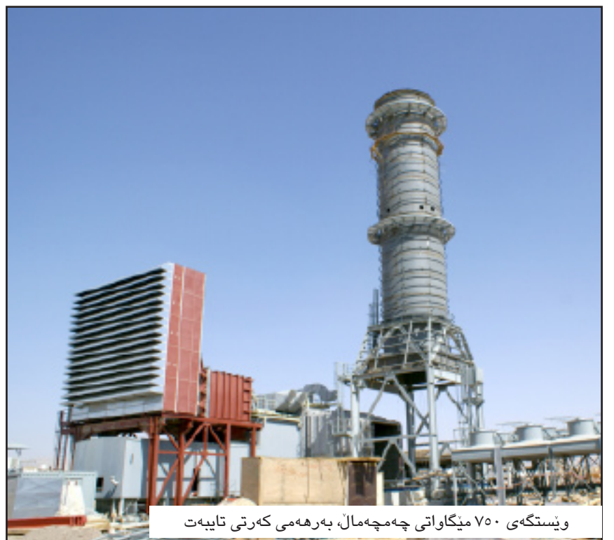
ویستگه ی ۷۵۰ میگاواتی چه مچه مال، به ره می کهرتی تایبه ت