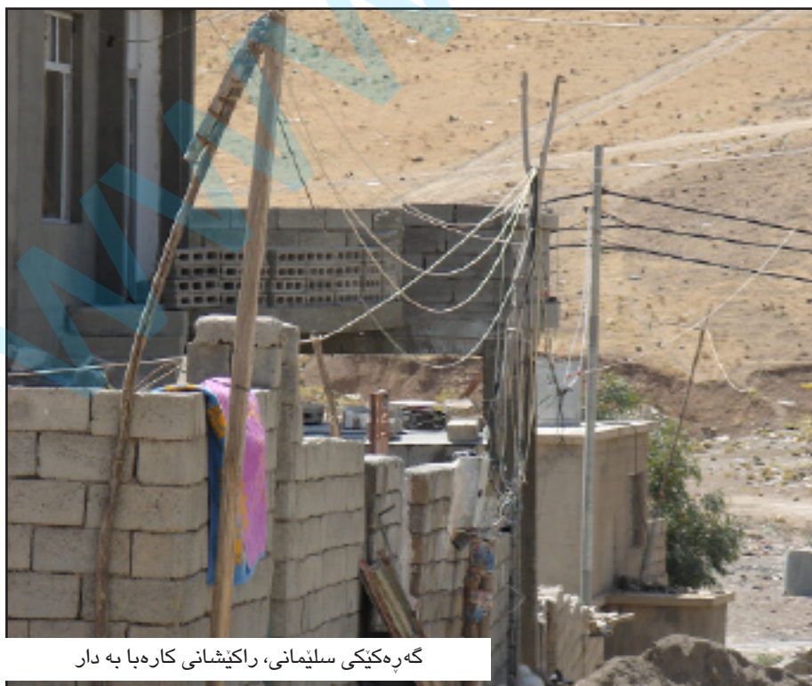
گه ره کیکی سلیمانی، راکیشانی کاره بای به دار

وهزیری کاره بای باس له وه شه دکات که له لایه کی دیکه وه هه ولدراوه بو نوژنه کردنه وهی ویستگه کانی دوکان و دهر به ندیخان و دانانی ویستگه یه کی ها یدرۆ پاوه ر به توانای (۳۰) میگاوات له قهرزی یابانی، دانانی ویستگه یه کی (۳۰۰) میگاواتی حه راری له لایه ن حکومتی کوریا و دانانی ویستگه یه کی ها یدرۆ پاوه ر به شیوه ی (BOT)، له م نزیکانه دا دیراسه ی جه داو دیزاینی ویستگه که ته واوده بییت، دیراسه ی جه داو بو ویستگه ی ها یدرۆ پاوه ری ده لگه و خالوان و گه لی بالنده و ویستگه ی ها یدرۆ پاوه ری (باوه نور) له لایه ن بانکی نیوده وه لته تی، دیراسه ی جه داو بو (۱۵) شوینی ویستگه ی به ره مهینان له وه ی باو ئه نجامدانی دیراسه یه که له لایه ن (JBIC) ی یابانی دهر به ری پرۆژه کانی ها یدرۆ پاوه ر له هه ریمی کوردستان ده کرین، به لām تانیستا ئه و ویستگانه ته نیا هه ول بوون و زۆربه یان نه که وتوو نه ته کار.