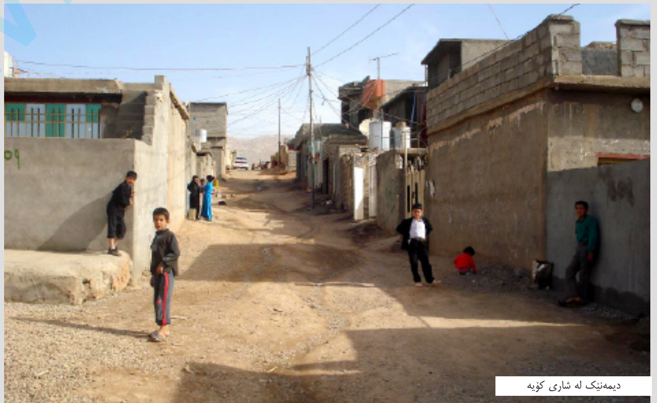
دیمه نیک له شاری کو یه

له گهل ټهوه شدا ټاساس سه ویزی، هوکاری سهره کی نه گه یشتنی پروژهی خزمه تگوزاری بو سه رجه م گه ره که کانی کو یه ی بو ټهوه گه رانده وه که له ماوه ی (۵) سالدا زیاتر له (۱۰) گه ره کی نو ی له کو یه زیادیکردوه و پنیوایه له وکاته وه که بودجه ی باشیش بو کوردستان ته رخانکرا هیشتا گه ره که کونهکانی کو یه کیشه یان چاره سهر نه بووو، که گه ره که نو یکانیش دروستکران، له به ره وه نه یان توانیوه کونترولی ټهوه هه موو گه ره که بکه ن به و بودجه یی بویان ته رخانکراوه، وتیشی: «دووسالیش به هو ی به کگرتنه وه ی هه ردوو ئیداره ی حکومته وه، کو یه له بودجه بیبه شبووه و ټهوه ش وایکردوه ټهوه هه موو کیشه یه به سهریه کدا که له که بن و بمیننه وه».