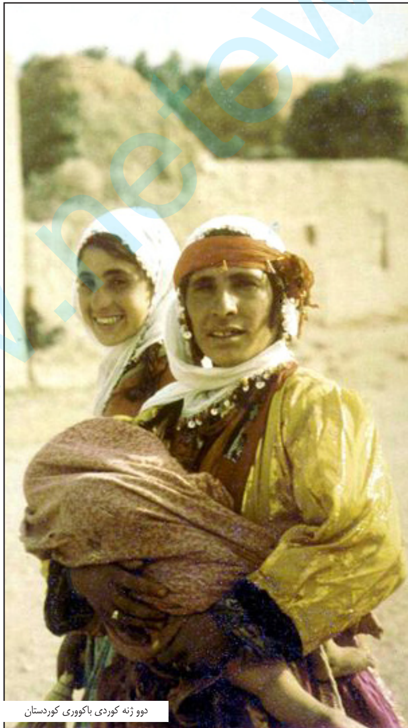
دوو ژنه کوردی باکووری کورده ستان