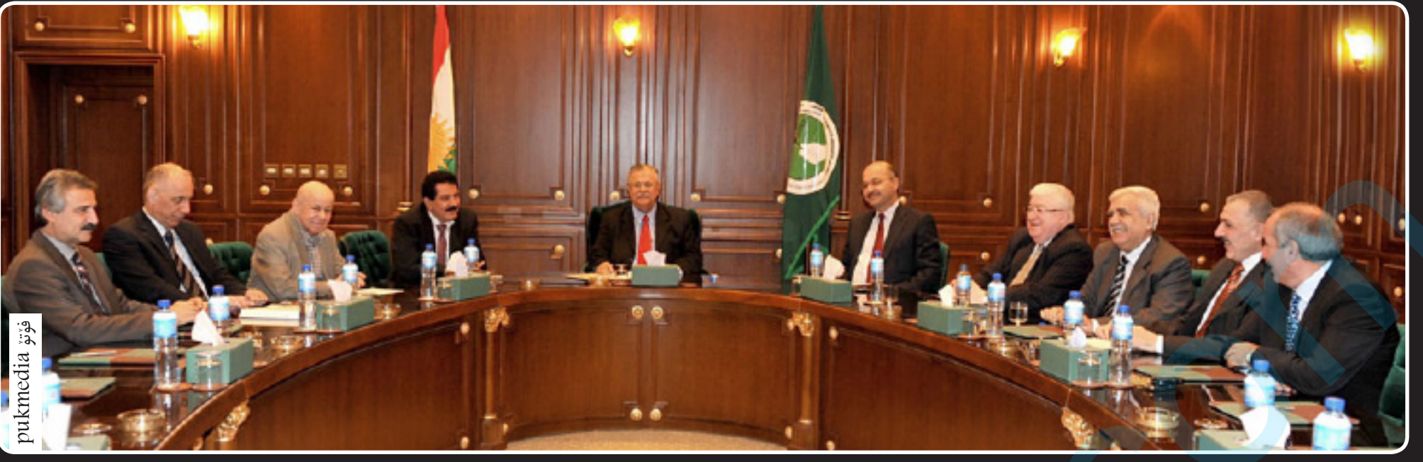
فوتو پۇك مېديا