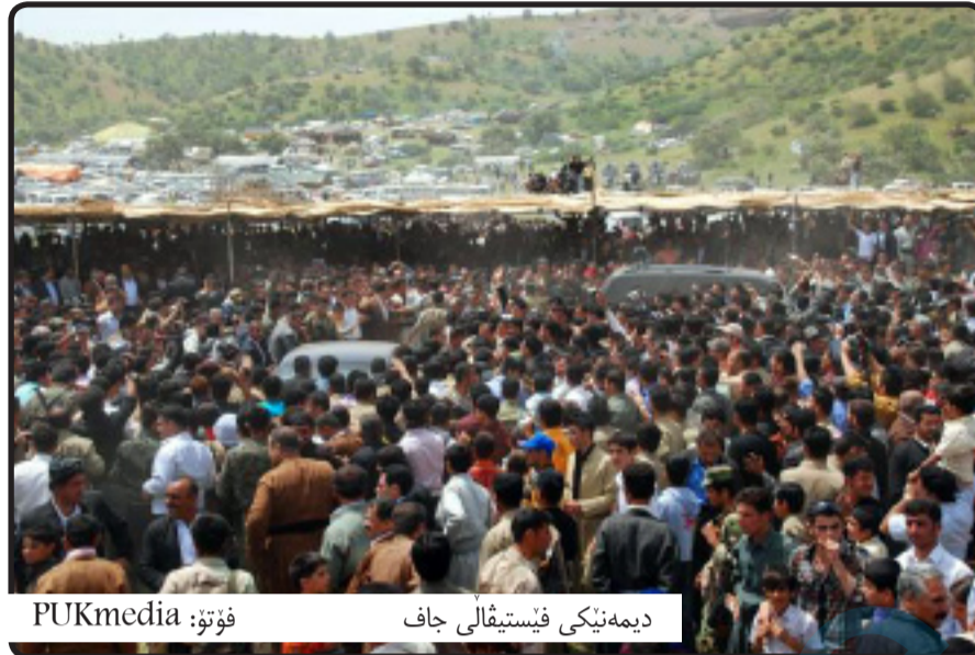
دیمه نیکى فېستيفالى جاف

له جاران ئەم پرسيارانهى ئاراستهى حيزبو حكومت كردوه: 1- ئايا تايستا ئاورىك له خيزان و بنه مالهى ئەو (9) كەسه دراوه تەو كه له بنگرد له سىداره دران؟ 2- ئايا خانوو و قەرەبوو بۆ ئەو (9) كەسه كراوه كه (3) سال له عەمماره گيران؟ 3- ئايا قەرەبوويهك بۆ دۆلى جافايهتى كرا؟ 4- ئايا جادهو رىگاوبان و ئاوو كارەباو مزگهوت و قوتابخانه و نهخوشخانه دروستكران؟ 5- ئايا ريزىكى بەرچاو له كه سوكارى ئەنفال كراوه كان گيرا؟ 6- ئايا داواى چاره نووسى ئەو كورە جافانه كرا كه له شەرى ناوخودا بيسهرو شوين كران؟ 7- ئايا داواى وەرگرته وهى زهويه كاني ئوردوگاي بنگرديان كردوه؟ يان دواى چەند سعاتىك له فېستيفاله كه، ئاشبه تالى پیده كريت و هەر كەسه بۆ مالى خۆى بەريده كريت و نازانيت بۆچى هاتوه و بۆ كوئ دهچيت؟ بۆيه ههقه بپرسين فېستيفالى جاف بۆچى ئەنجامده دريت؟