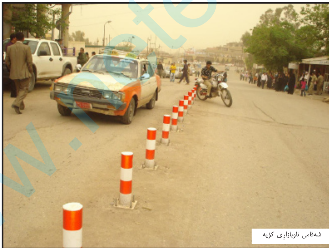
شه قامی ناو بازار ی کۆیه

دووساید کردنی شه قامی سهره کی ناو بازار ی کۆیه، شو فیری تاکسی کۆیه و هه ندیک له هاو لاتیان نیگه ران ده کات و بیانویه ئه و شه قامه له توانایا نییه بکریته دووساید، ره خنه ی ئه وه ش ده گرن، که پارکیک نییه بو وه ستانی ئۆتۆمبیل، سه روگی شه روانی کۆیه ش ده لیت: «بو که مکردنه وه ی قه ره بالغی شه قامه که مان کردو وه ته دووساید، ره نگه له داها توودا بیشیکه ی نه وه به یه ک ساید».