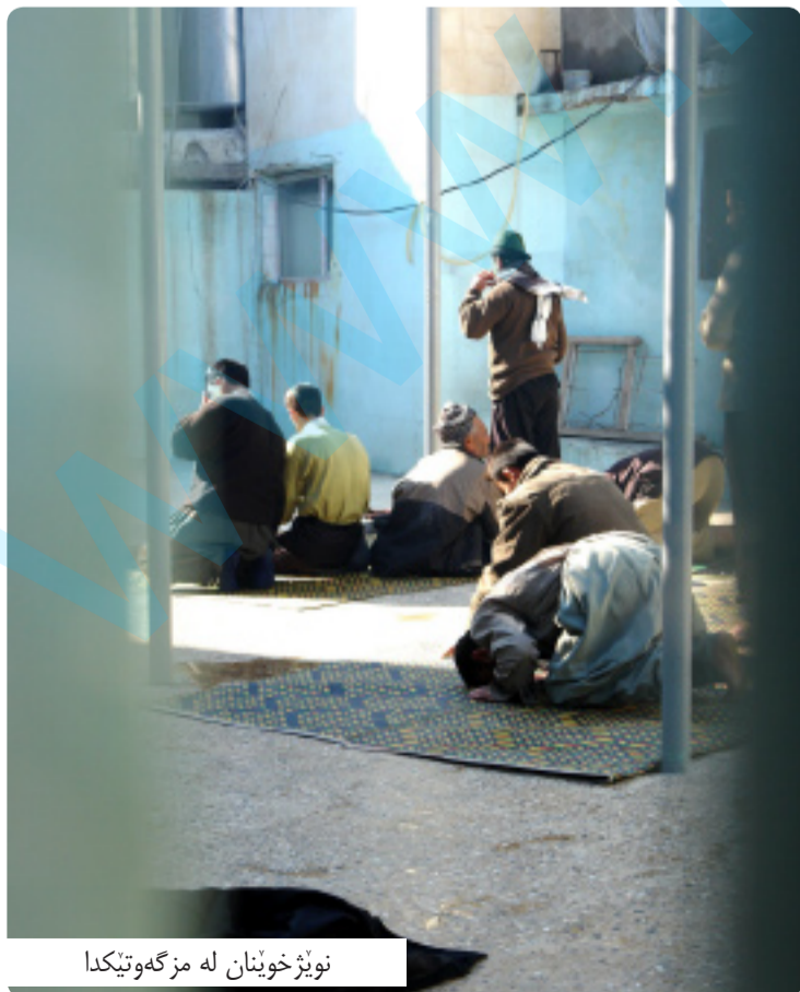
نويز خويان له مزگهوتيكدا

زورجار له هەولير و سلیماني نويزم كردوه، له كاتى هەر پيچ فەرزەكاندا (خاديم) واته خزمه تگوزار له پيش خەلكيدا به نيو سهعات هاتوه و دەرگاي مزگهوتى كردوه تەوه، له دواى هەموو خەلكيش رويشتوه و دەرگاي داخستوه تەوه، يان له وەرزی زستاندا زوپاكانى داگيرساندوه و كوژاندوه و نييه تەوه و بەردوام سەرپەرشتيى مزگهوتى كردوه و خاوينى كردوه تەوه، كه چى له رانيه به هوى به دوا دانه چوونى ئەوقاف، خزمه تگوزار به هفته يهك جاريك له مزگهوتدا كاردەكات و به هيچ شيوه يهك كارى كردنه وه و داخستنه وه و گەرم و ساردى مزگهوتەكه ئەنجام نادات، كه داواشى لىكریت له وهلامدا ده ليت «ئەوقاف به منى وتوه رۆژانه نيهم و له هفته يهكدا جاريك يا دووجار سەردانى مزگهوت بكەم»، باشترين به لگهش كردنه وهى دەرگاي